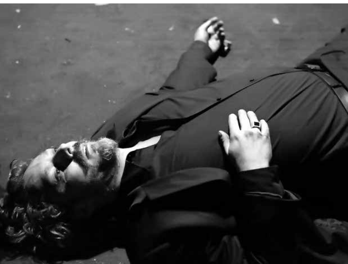
Zé Alfredo (Alexandre Nero) é morto pelo próprio filho