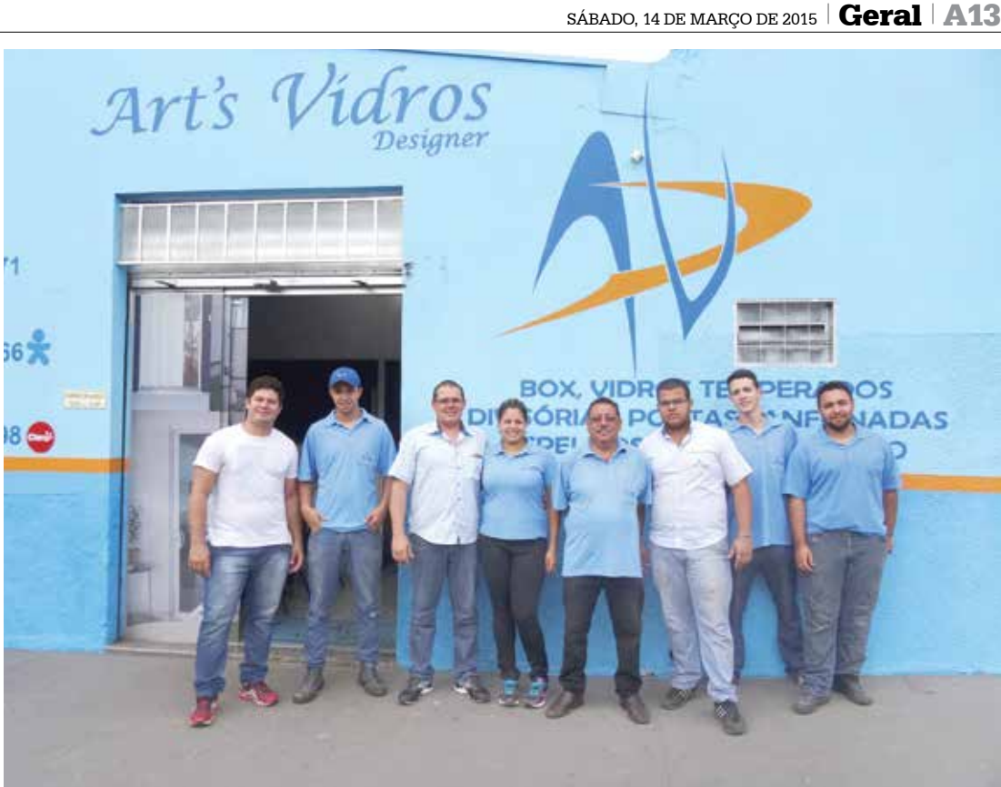
Equipe capacitada, treinada para implementar novas tecnologias e ferramentas em seus serviços

COMO ENCONTRAR A Art's Vidros fica situada à Rua Vitório L. Arantes, nº 332, no bairro Ilda Helena. Telefones para contato: 3463-4471 ou 9 97511766.