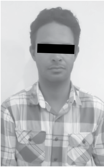
O morador de Ouroeste W.F.D. foi preso

Ainda em diligências, a PM recebeu uma ligação do advogado do proprietário do JAC/13, relatando que seu cliente havia tomado ciência