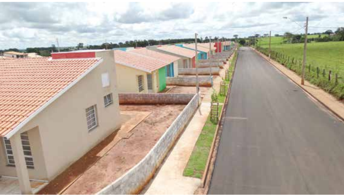
As unidades habitacionais foram edificadas próximo ao Residencial São Lourenço 4 e conta com total infraestrutura urbana