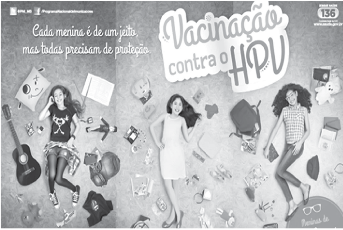
Slogan da Campanha Nacional de Vacinação contra o HPV