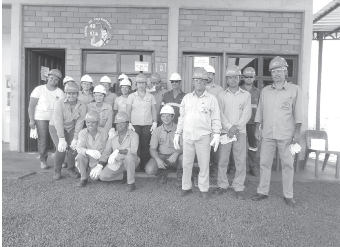
Profissionais do departamento de Controle de Vetores realizaram mutirão para eliminar focos do Aedes aegypti na Usina Bungee

Segundo o departamento responsável por Controle de Vetores, alguns problemas na cidade já foram detectados e as providências estão sendo tomadas, como por exemplo: acúmulo de água no interior dos postes com placas, entre outros. No próximo dia 18 haverá uma palestra informativa para a população, no salão paroquial de Ouroeste, a partir das 9h. A Secretaria de Saúde pede a compreensão e a ajudada população para juntos