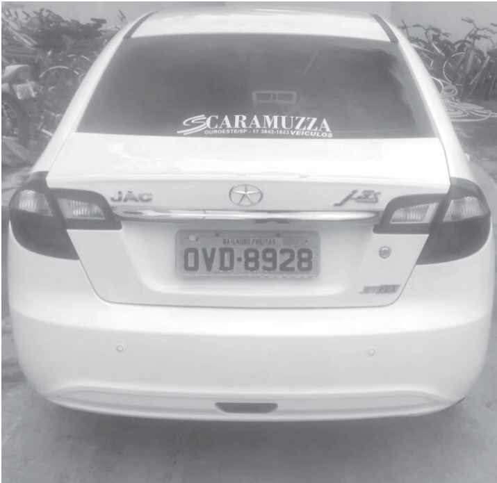
O veículo importado JAC/J3 de cor branca estava com o chassi adulterado e documento falso e era também “produto de roubo” em Ribeirão Preto

cido em Ribeirão Preto. W.F. ainda indicou aos policiais outra pessoa, que também comprou um veículo com o mesmo homem em Ribeirão Preto. Trata-se de um JAC/J3, de cor branca, com placas da Bahia. O automóvel estava em posse do servidor municipal C.D.F., 39 anos, que prestava serviços para a Ciretran (Circunscrição Regional de Trânsito) de Ouroeste.