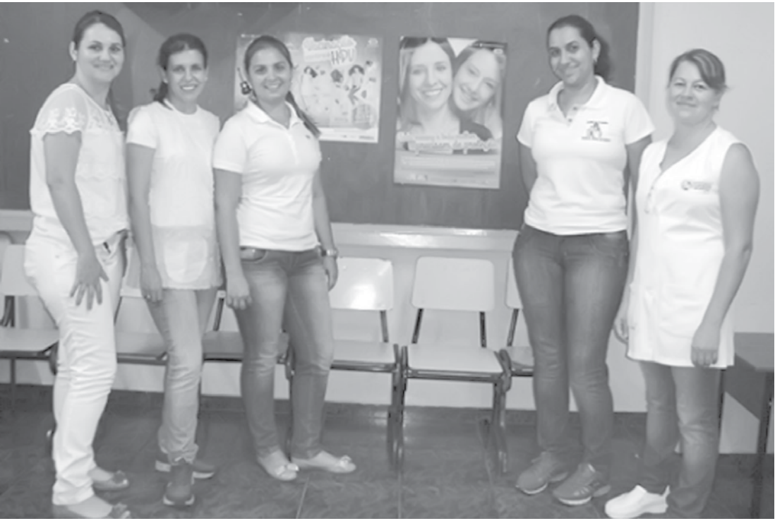
As equipes de Saúde já estão vacinando meninas de 09, 10 e 11 anos de idade

primeira e a segunda dose é de seis meses e entre a primeira e terceira dose, de 60 meses (5 anos). A vacinação iniciará nas escolas, mas também poderá ser realizada nas Unidades de Saúde de Ouroeste. Não esqueça a carteirinha de vacinação!