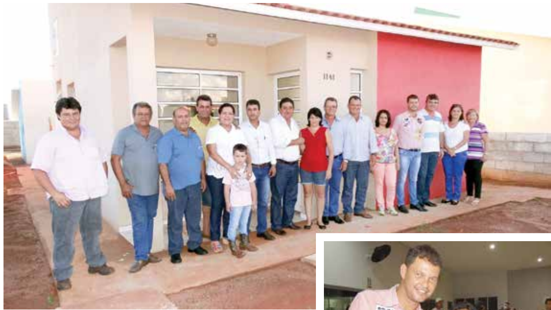
Autoridades municipais fazem a entrega da chave a uma das famílias contempladas no sorteio