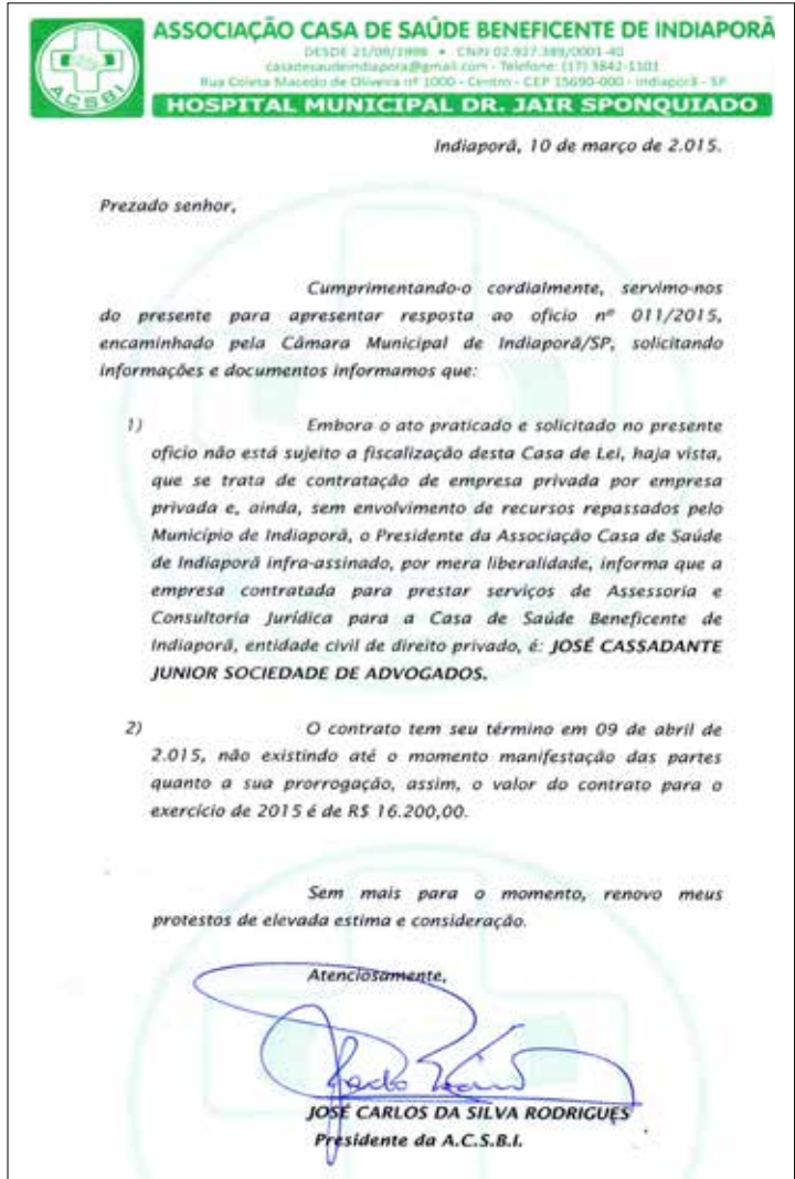
Ofício em resposta ao presidente “Mancha”