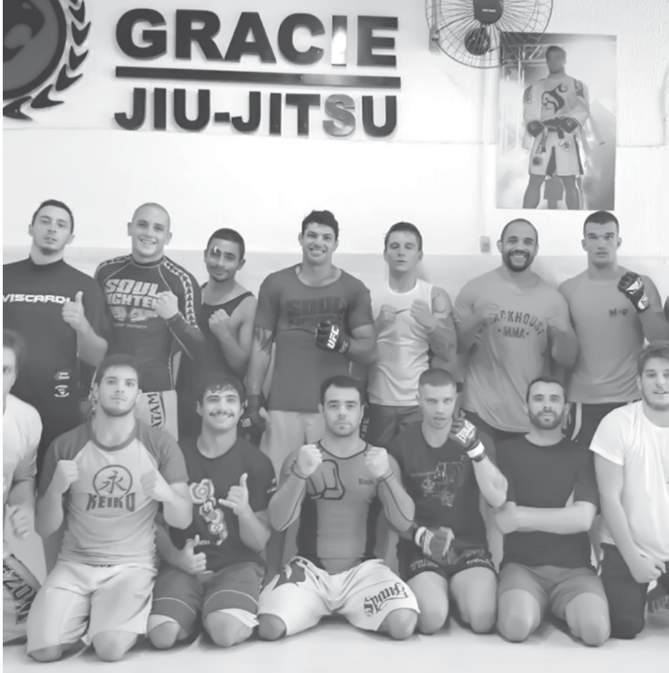
Com os companheiros de treinamento na academia Gracie Jiu-Jitsu, em SP