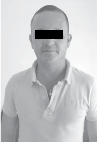
O funcionário da Ciretran C.D.F. foi indiciado pelos mesmos crimes, porém, não foi autuado em flagrante por ter entregado o veículo de livre e espontânea vontade