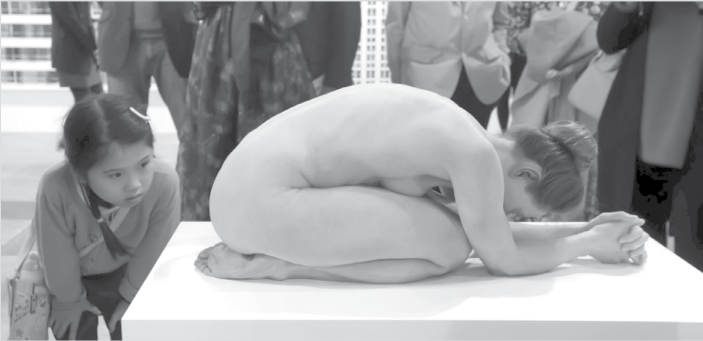
imagem do dia

Uma menina observa a obra de arte “Untitled” do artista australiano Sam Jinks, exposta na feira Art Basel 2015, em Hong Kong, na China. O evento apresenta obras que vão do início do século 20 até de artistas atuais.