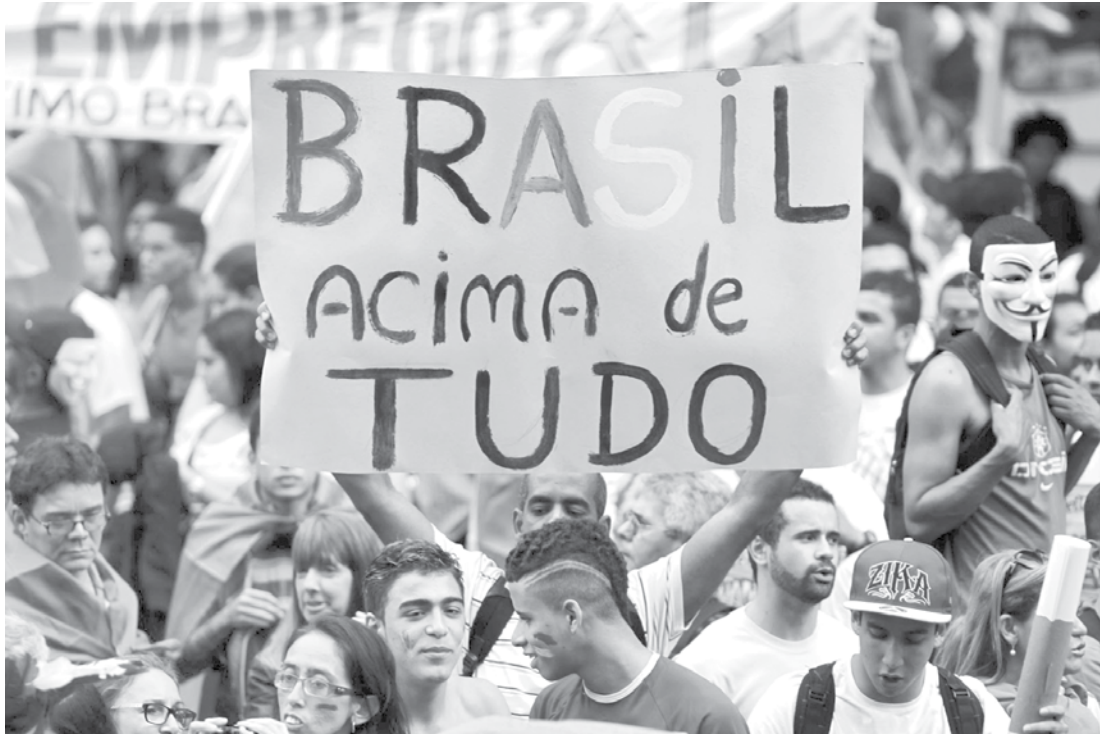
Manifestações acontecem por todo o Brasil

A Secretária de Trânsito (SEMUTRAN) já autorizou o percurso que será feito pelos manifestantes. A Polícia Militar também vai trabalhar com efetivo reforçado neste domingo, para garantir a ordem e tranquilidade dos participantes. Um ofício inclusive foi protocolado na 1ª Cia do 16º BPM/I. O Departamento de Fiscalização da Prefeitura também autorizou a utilização de som na área central, já que em Fernandópolis existe um Decre-