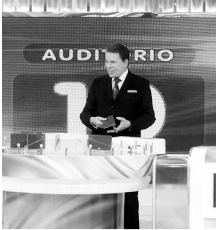
TV de Silvio Santos se torna a terceira emissora bilionária do país

O SBT fechou o ano passado com o maior faturamento de sua existência: cerca de R$ 1,15 bilhão. O balanço ainda não foi publicado e está sujeito a pequenas mudanças. O lucro da emissora não está fechado, mas deve ficar entre R$ 60 milhões e R$ 80 milhões (mais que os cerca de R$ 52 milhões de 2013). Em 2013, a propósito, houve um certo desapontamento porque a emissora tinha certeza que atingiria a marca do bilhão, mas terminou o ano com R$ 998 milhões. Quase. Mas o resultado de 2014 foi redentor e o SBT se torna, assim, a terceira emissora bilionária do país -- atrás de Globo e Record, respectivamente. Mas a segunda e terceira colocadas ainda estão bem atrás da líder. A Globo faturou “modestos” R$ 16 bilhões no ano passado, com lucro em torno de R$ 2,5 bilhões. Dois bilhões e meio de reais é, aliás, previsão de faturamento total da segunda colocada, a Record, para 2014. Mas, enquanto a concorrência consegue lucro -- seja milionário ou bilionário -- a Re-