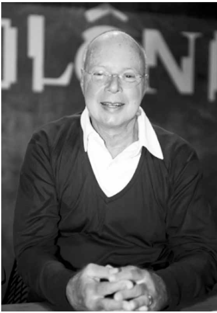
Gilberto Braga, autor de “Babilônia”

não passa aperto, mas acha seu apartamento no Leme, com vista para a comunidade, muito pouco. Extremamente ressentida e invejosa, a advogada, casada com Homero (Tuca Andrada) e mãe de Alice (Sophie Charlotte) quer mais, de preferência a mesma vida de luxo de Beatriz (Gloria Pires), sua ex-amiga de adolescência. A arquiteta, toda-poderosa da construtora Souza Rangel, subiu na vida graças ao seu maior talento: a sedução. Foi levando o empresário Evandro (Cássio Gabus Mendes) para a cama logo após ele ficar viúvo que ela recuperou dinheiro e status após uma fase difícil. Mas o casamento não impede que ela colecionasse amantes. “A primeira vez que Gloria Pires faz papel de mulher sexy vai marcar a novela. Sempre quero botar a Gloria em algum papel. A gente pensou: o que ela nunca fez? Mulher sexy, que é o que ela é. A Beatriz é meio tarada. Não chega a ser ninfomaniaca, é quase. Mas ela vai ter um amor sério, vai se apaixonar pelo Diogo, isso vai desestabilizá-la. Ela come todo mundo, mas nunca se apaixonou. Dessa vez vai ser diferente”, adianta o autor. Irmão de Regina, Diogo é tam-