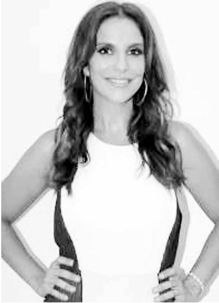
Ivete estará fora da edição Global

do programa e deverão permanecer em seus postos. Além disso, o nome de André Marques está garantido para a próxima edição do programa. O apresentador foi promovido pela direção da emissora a apresentador e a partir de Abril, quando o reality show volta ao ar, ele dividirá o palco com Fernanda Lima, que até então era a apresentadora principal da atração. André conseguiu essa promoção devido ao bom desempenho que teve na edição passada e, também, por ter conduzido com maestria o programa ‘Mais Você’ junto com Cissa Guimarães nas férias de Ana Maria Braga.