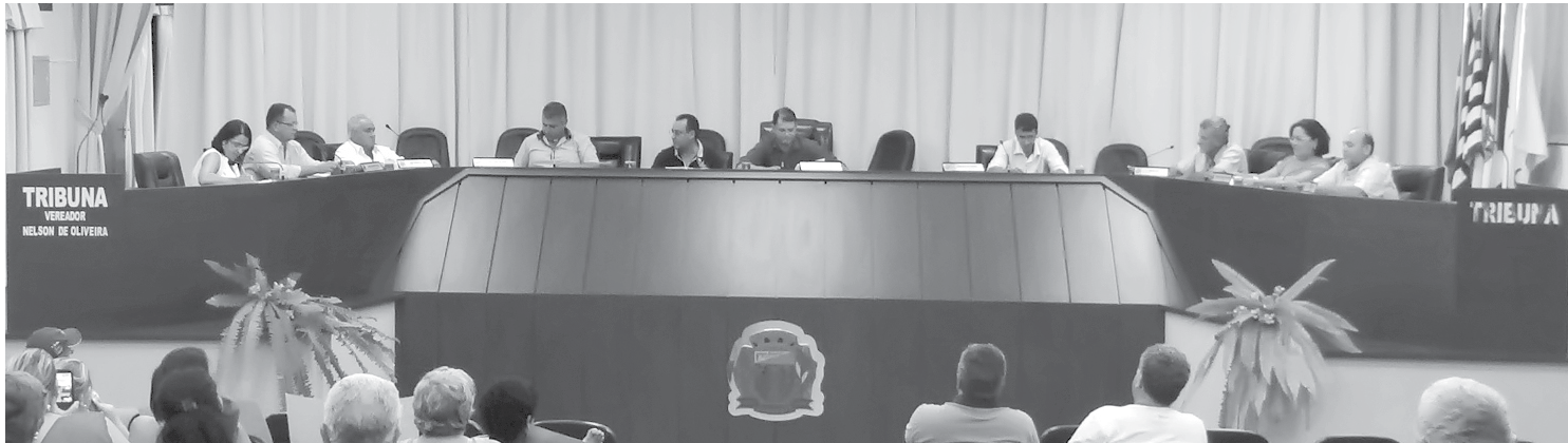
Sessão ordinária na Câmara Municipal de Ouroeste: normatização para implantação e funcionamento de funerárias está aprovada

Na segunda sessão ordinária de março, apenas um projeto de lei foi à votação. Trata-se do Projeto de Lei nº 17/2015, que estabelece diretrizes para a instalação de empresas funerárias no município. Foi determinado que os serviços funerários e planos de assistência familiar serão comercializados e executados exclusivamente por empresas instaladas no município e que estejam devidamente cadastradas na Prefeitura. Também levando em conta o número de empresas, que deve ser proporcional ao número de habitantes. Uma funerária para cada dez mil moradores. Sem muitas matérias a serem discutidas, poucos vereadores se pronunciaram. Os que usaram a Tribuna fizeram questão de parabenizaram as famílias contempladas