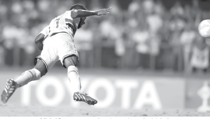
Michel Bastos acerta cabeceio certeiro no “peixinho” que garantiu a vitória do Tricolor no Morumbi

Dos cinco clubes brasileiros que entraram em campo nesta “roda-