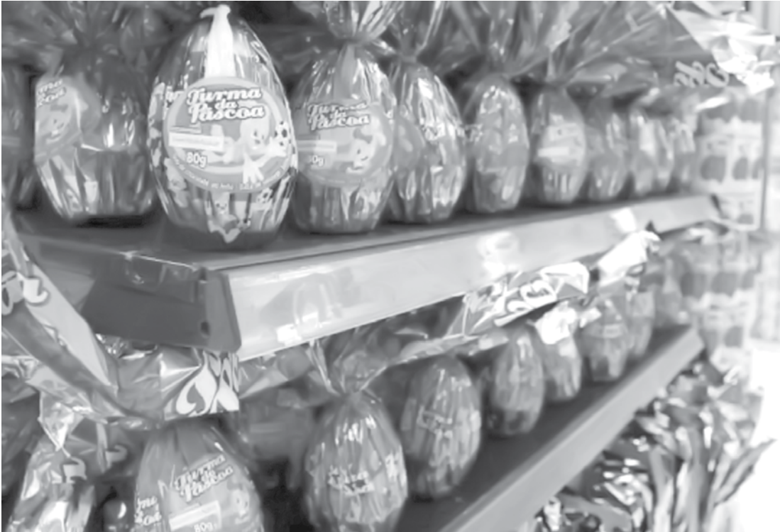
Empresários locais não estão otimistas com as vendas em 2015

A primeira coisa que vem em mente ao se falar de Pás-