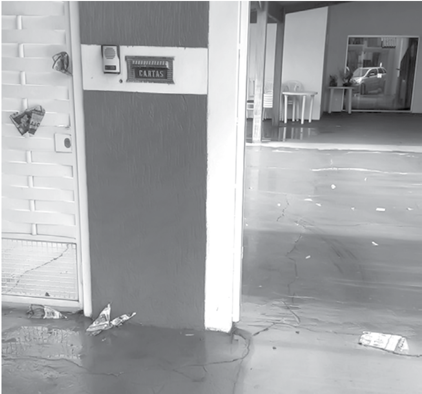
Panfletos são jogados diariamente nas residências da cidade

nicipio. Quem descumprir as normas será penalizado com multas. Para a apreensão e posterior destruição, do material propagandístico, cumulada com multa de 100 (cem) Unidades de Referência do Município – URMIs, imposta ao responsável quando a distribuição estiver sendo promovida por empresa não autorizada na Prefeitura; multa de 80 (oitenta) URMIs, imposta ao responsável pela distribuição, quando esta estiver sendo feita por pessoas que não portem o jaleco da empresa ou por menores de 18 (dezoito) anos; multa de 50 (cinquenta) URMIs, imposta ao responsável, quando o folheto não trouxer a advertência ao leitor e a identificação mencionada no inciso III, do art. 3º, da lei.