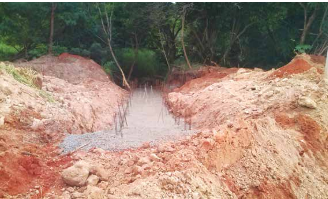
Escada hidráulica está sendo implantada pela equipe da Prefeitura