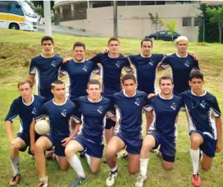
Equipe espera enfrentar difíceis adversários na primeira etapa do ano

em incentivo a portadores de necessidades especiais na prática esportiva.