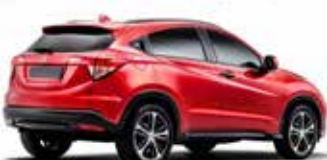
Novo Honda HR-V: já disponível nas concessionárias em 3 versões abriu a caça