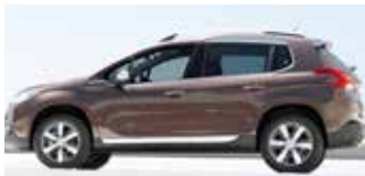
Peugeot 2008: requinte e sofisticação com previsão de apresentação no próximo mês