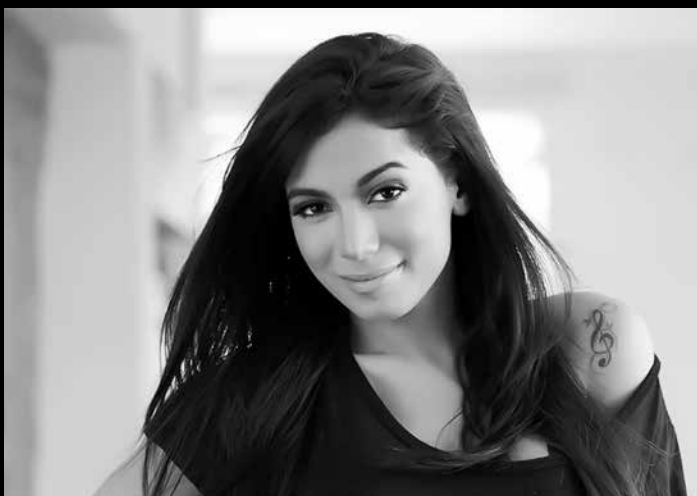
‘Estar solteira é uma opção’, afirma Anitta