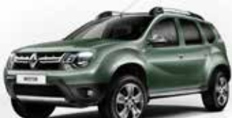
Renault Duster: nova reestilização e mais tecnológico em breve