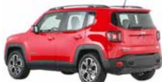
Jeep Renegade: fabricante abre mais 120 concessionárias para atender possível demanda