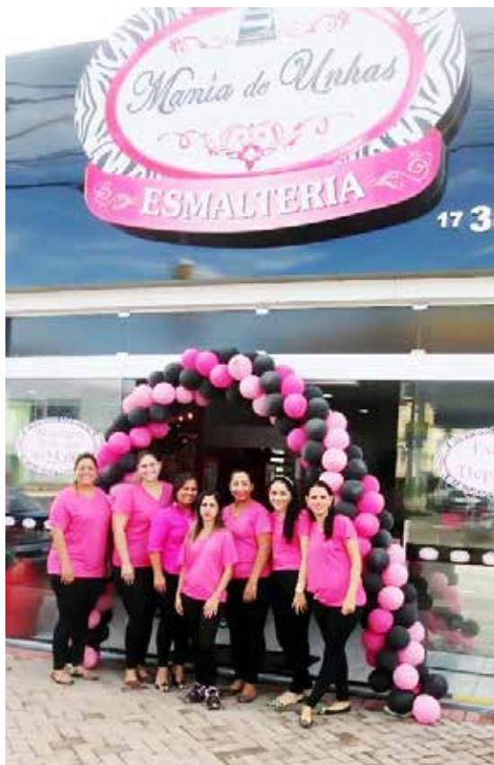
Preços especiais - manicure e pedicure a partir de R$25. Ambiente climatizado, wi-fi, Nail-bar, excelentes profissionais! Agende pelo telefone 17-3462 3538.

Na última quinta-feira (19), a Mania de Unhas Esmalteria , localizada na Rua Rio Grande do Sul, próximo ao supermercado Sakashita, no Centro, comemorou seu primeiro aniversário.