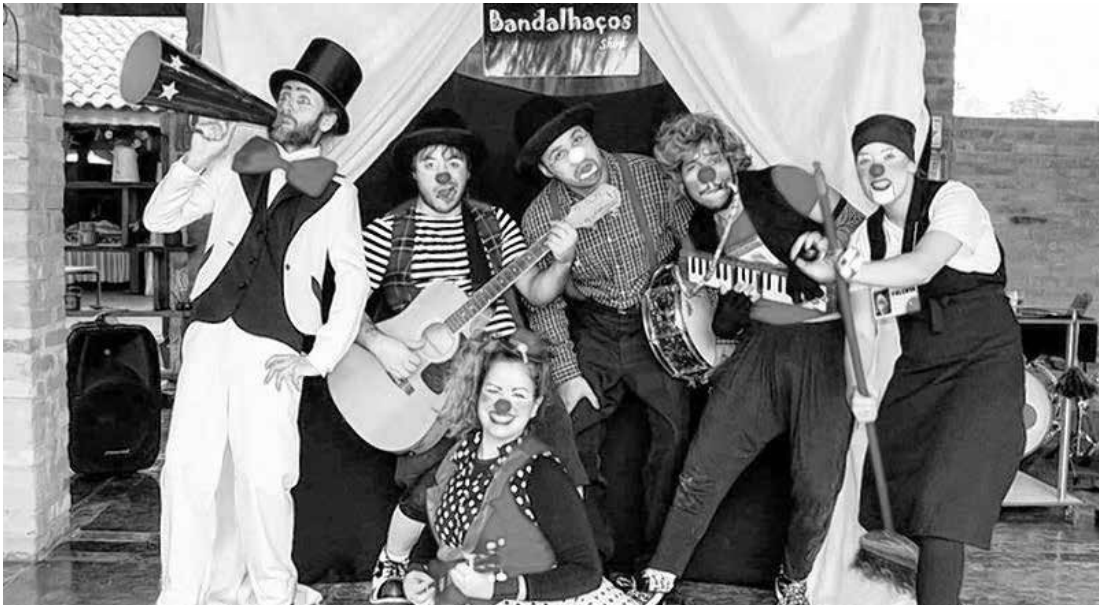
‘Bandalhaço Show’, da Companhia Riz, se apresenta na Praça de Eventos em Ouroeste

Riz. Uma banda de palhaços ou... um bando de palhaços?! Uma divertida confusão surge neste fantástico show de variedades circenses! Para organizar a fuzarca, o Mestre de Cerimônias se divide entre conduzir a banda, anunciar os números dos palhaços e... lidar com uma fã louca que faz de tudo para entrar na banda! Ou no bando?! Nesse espetáculo só uma coisa é certa: Diversão Garantida! A apresentação está marcada para as 20h30, na Praça de Eventos. É gratuita e toda comunidade ouroestense está convidada!