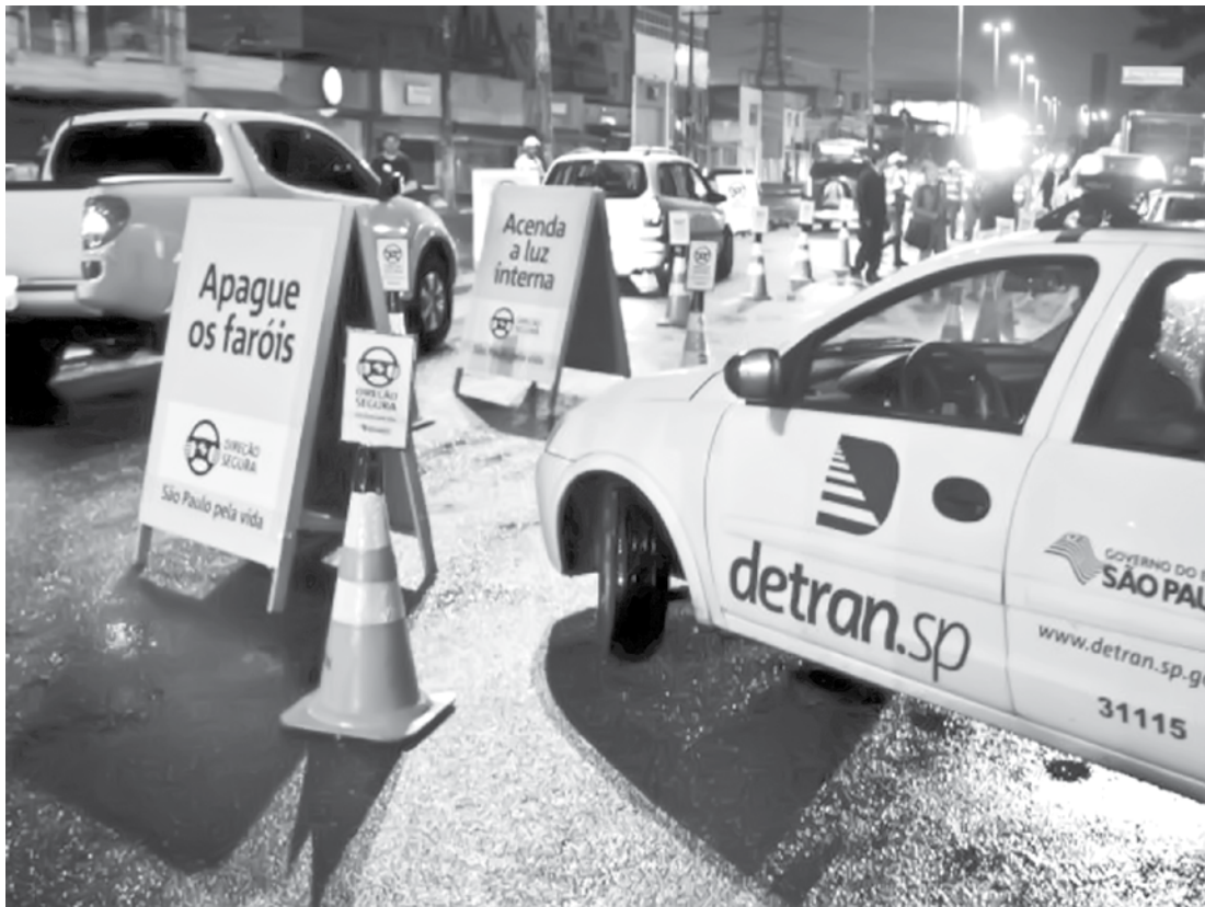
Blitz de fiscalização da Lei Seca foi realizada entre a noite de sábado (21) e a madrugada de domingo (22); ao todo, 110 condutores foram submetidos ao teste do etilômetro

→ Da REDAÇÃO contato@oextra.net O Programa Direção Segura – ação coordenada pelo Detran.SP para a prevenção e redução de acidentes e mortes no trânsito causados pelo consumo de álcool combinado com direção – autuou 11 pessoas em operação de fiscalização da Lei Seca realizada em São José do Rio Preto. A blitz foi realizada nas Avenidas dos Estudantes e Bady Bas-sitt entre a noite deste sábado (21) e a madrugada de domingo (22). Ao todo, foram aplicados 110 testes do etilômetro (conhecidos por “bafômetro”). Os 11 condutores autuados por embriaguez ao volante terão de pagar multa no valor de R$ 1.915,40 e responderão a processo administrativo junto ao Detran.SP para a suspensão do direito de dirigir por 12 meses. Três dos motoristas flagrados, além das penalidades acima, responderão na Justiça por crime de trânsito. Eles apresentaram índice a partir de 0,34 miligramas de álcool por litro de ar expelido no teste do etilômetro. Se condenados, poderão cumprir