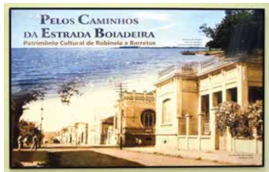
Objetivo é mostrar às novas gerações o que foi a chamada “Estrada Boiadeira”