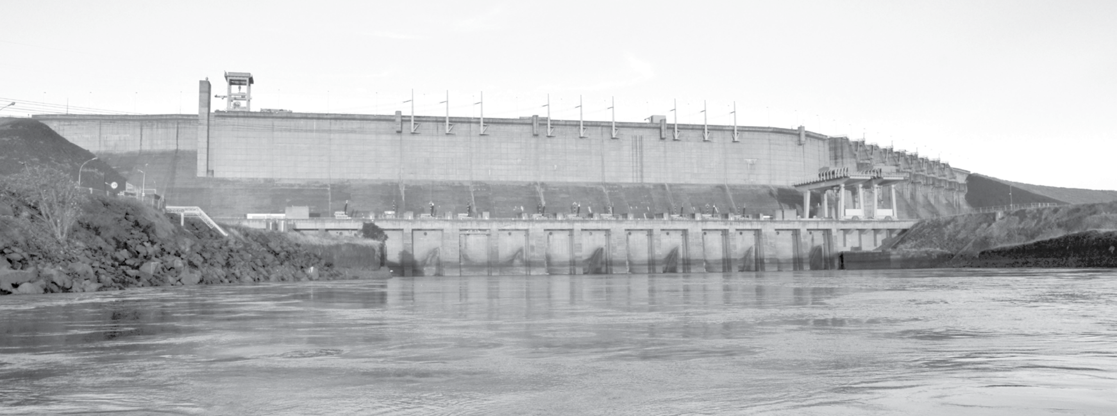
Vista da barragem da Usina Hidrelétrica de Água Vermelha: chuvas chegam à região e elevam índices do reservatório

Março deve ser o primeiro mês de 2015 com “índice positivo” no comparativo com dados do ano passado