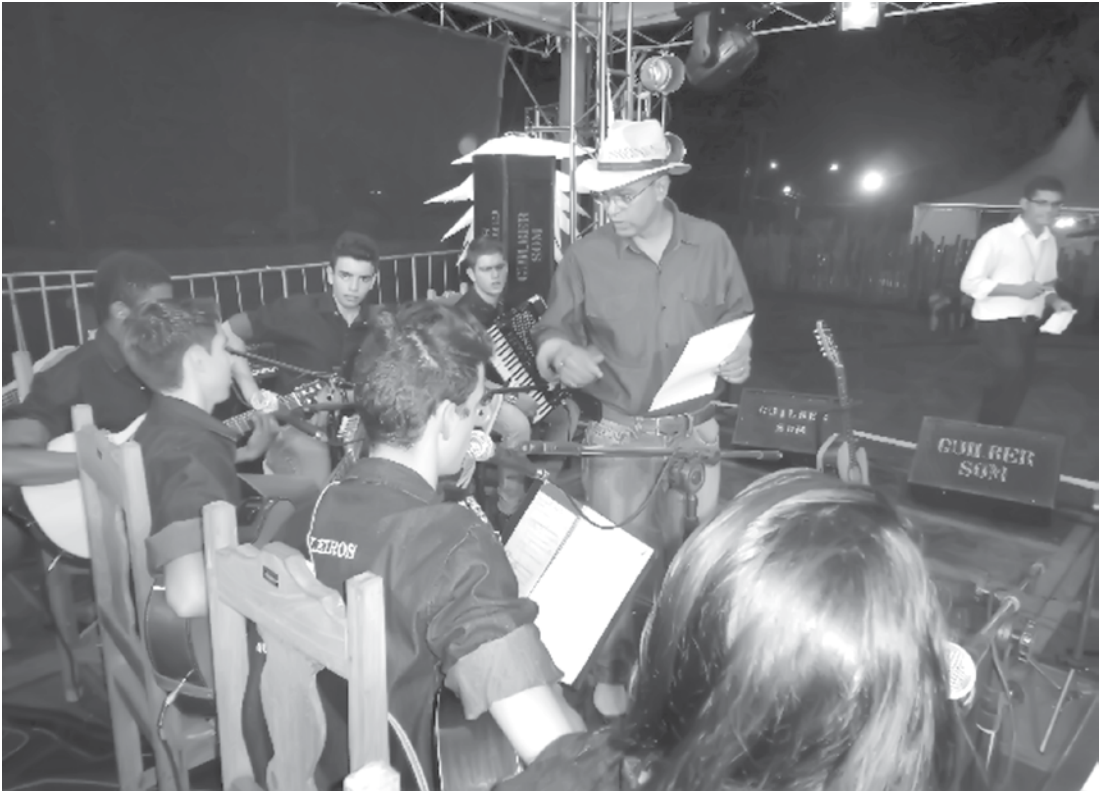
Orquestra de Violeiros realiza concertos em várias cidades da região e também em outros estados, bem como em programas de rádio e televisão

→ JOSANIE BRANCO jo@oextra.net Numa tentativa de mudar o ambiente formal dos prédios do Judiciário paulista, a Presidência do Tribunal de Justiça de São Paulo instituiu, no ano passado, o Projeto Arte e Cultura no TJ, criado para fomentar a cultura e estimular a motivação e a valorização dos servidores, com a promoção de shows gratuitos de música, saraus, leitura de textos e outros eventos culturais. Em Fernandópolis, a próxima apresentação no saguão principal do Fórum acontece nesta sexta-feira, dia 27, a partir das 16h, e terá como grande atração a Orquestra de Violeiros de Fernandópolis. Os shows, que têm periodicidade mensal, contemplam artistas com repertórios variados e têm atraído a atenção de servidores e do público que frequenta o Fórum. São shows gratuitos de música, leituras de textos, exposição de artes plásticas e esculturas e outros eventos relacionados à cultura brasileira. O projeto teve início na cidade em setembro de 2014 e já contou com a participação