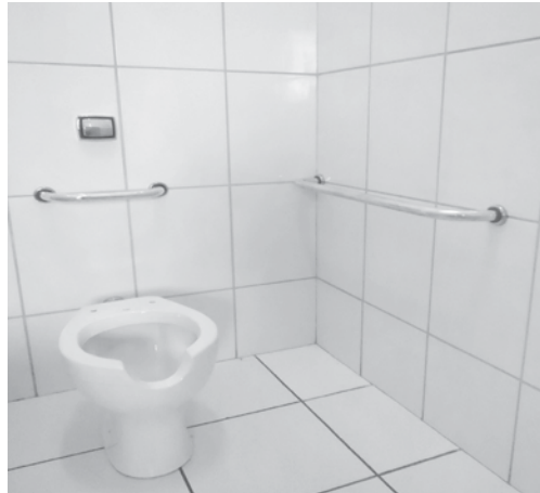
Foi construída mais uma sala de aula além de rampas e reformas nos banheiros