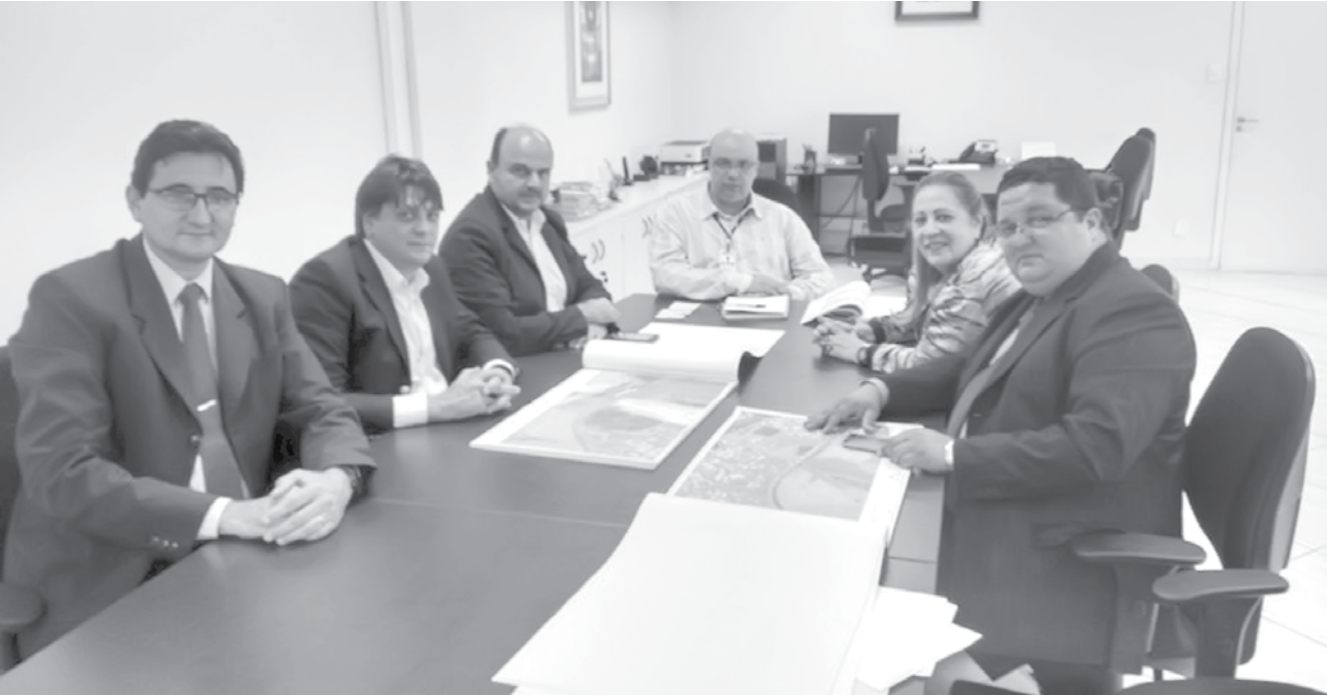
Vereadores e a prefeita de Fernandópolis durante a audiência no DNIT, na Capital