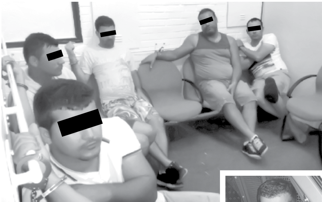
Quadrilha presa foi levada à sede da Polícia Federal

A Polícia Federal de Jales estourou um laboratório de refino de cocaína que funcionava em uma fazenda em Campina Verde/MG. O chefe do bando foi peão profissional de rodeio e, além do peão, dois dos demais presos são de Manhuasu/MG, dois de Ouroeste e um de Aparecida do Taboado/MS. A droga estava guardada no interior de latões e foi enterrada. No local havia uma prensa hidráulica para formar os tijolos da droga. A Polícia Federal informou que 51 quilos de