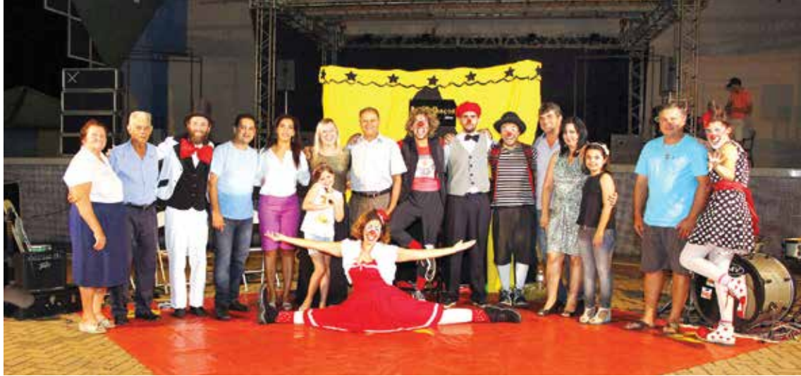
O programa é mantido pela Secretaria da Cultura do Estado, em parceria com a Prefeitura de Ouroeste, através da Secretaria Municipal da Cultura