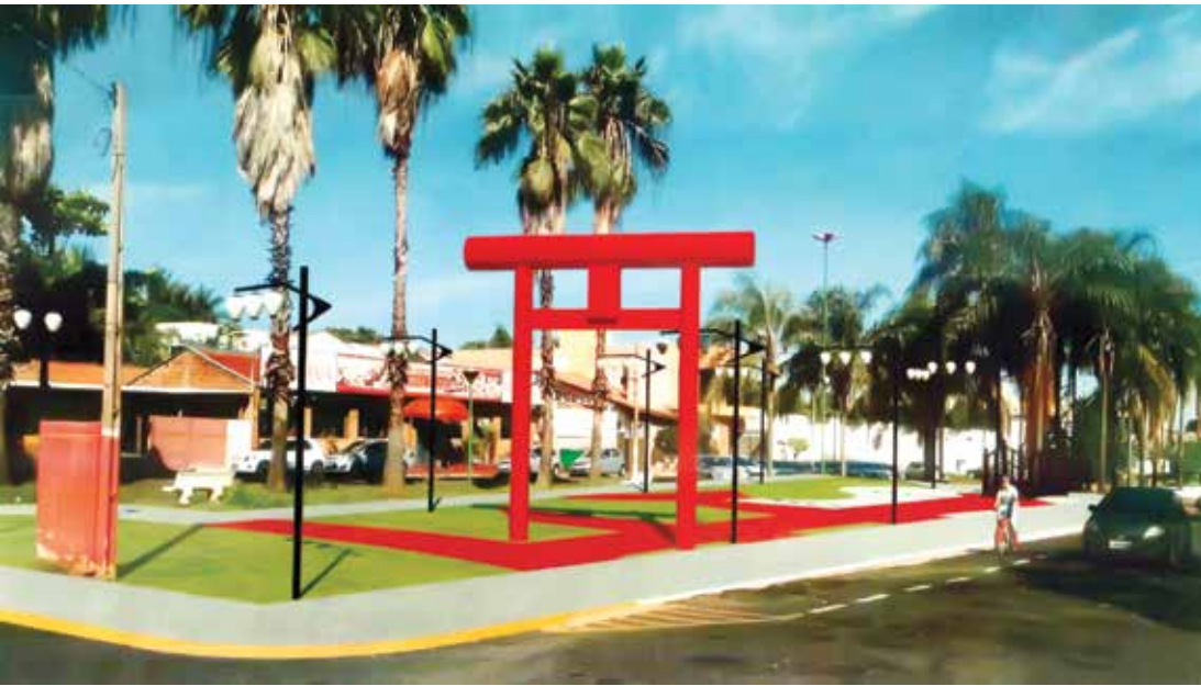
Maquete da "Praça do Sol Nascente", que será inaugurada na próxima semana