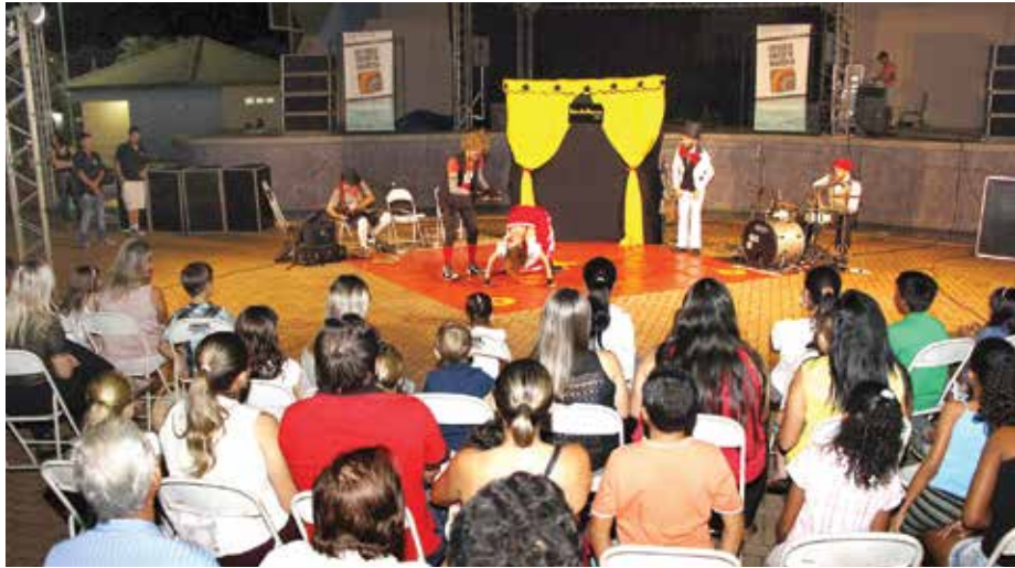
Evento é organizado pela Associação Paulista dos Amigos da Arte (APPA)

Nesta primeira atração de 2015 centenas de pessoas lotaram a Praça de Eventos para prestigiar o espetáculo “Bandalhaços Show”