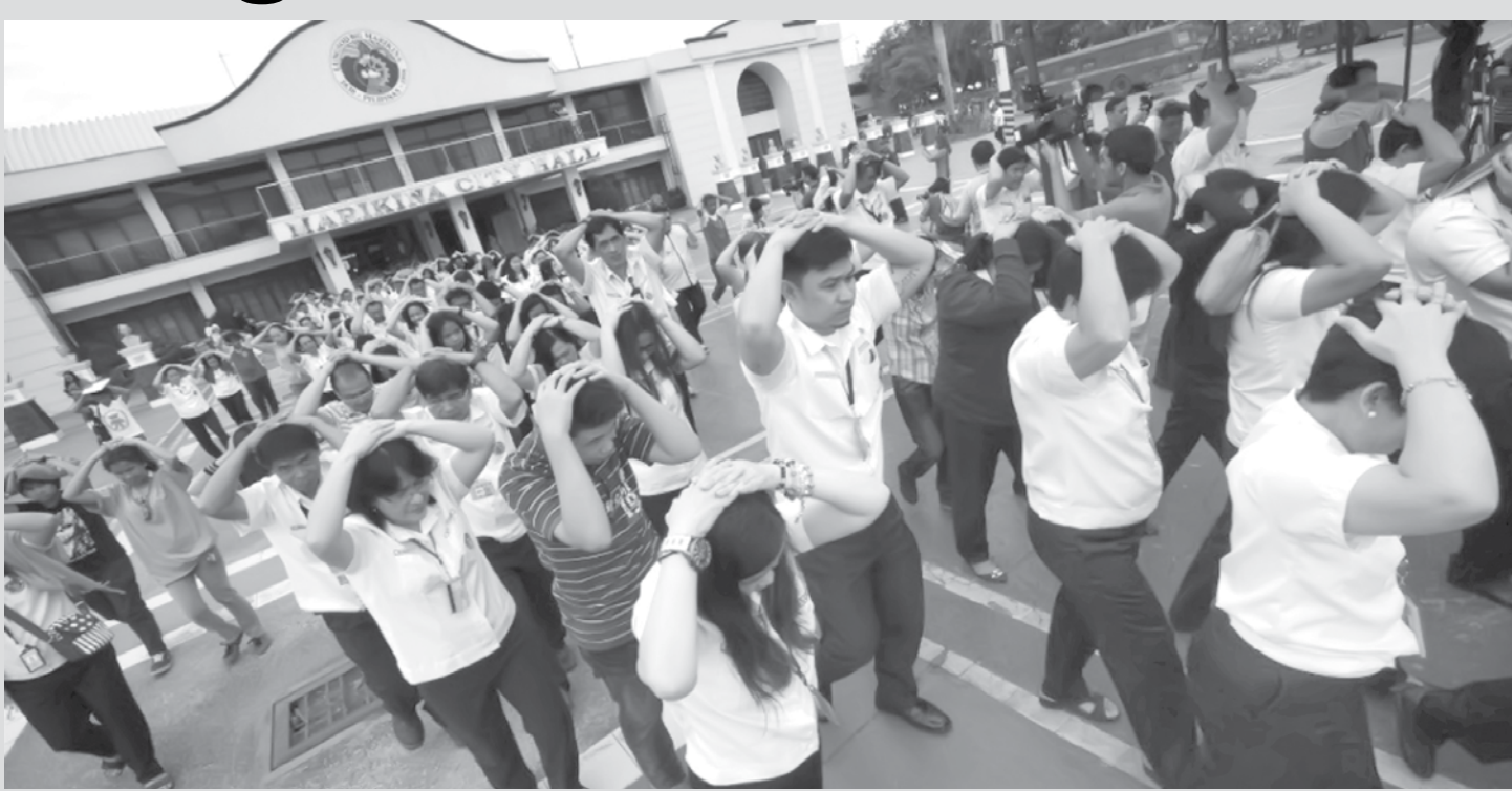
Trabalhadores protegem suas cabeças durante simulação de terremoto na cidade de Marikina, nas Filipinas, nesta sexta-feira (27)