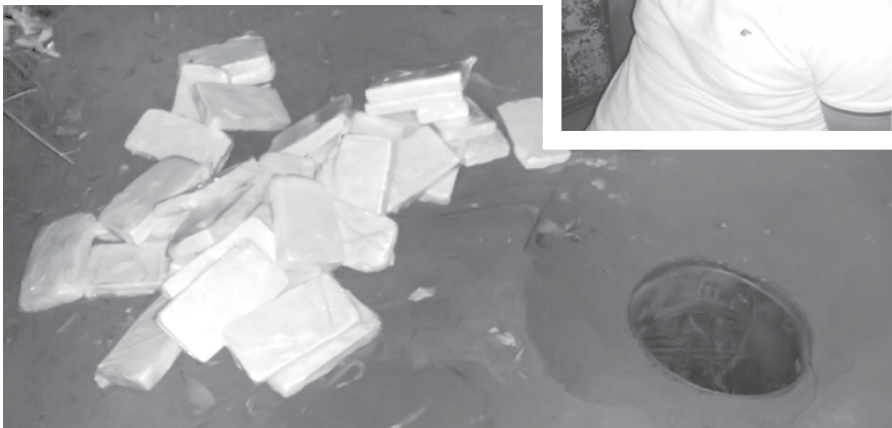
A droga estava armazenada no interior de latões e enterrada em uma fazenda em Campina Verde/MG