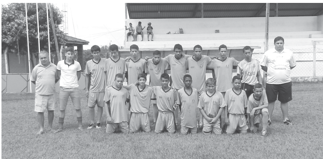
A equipe sub-13 comemorou o novo uniforme e a estreia com vitória no campeonato