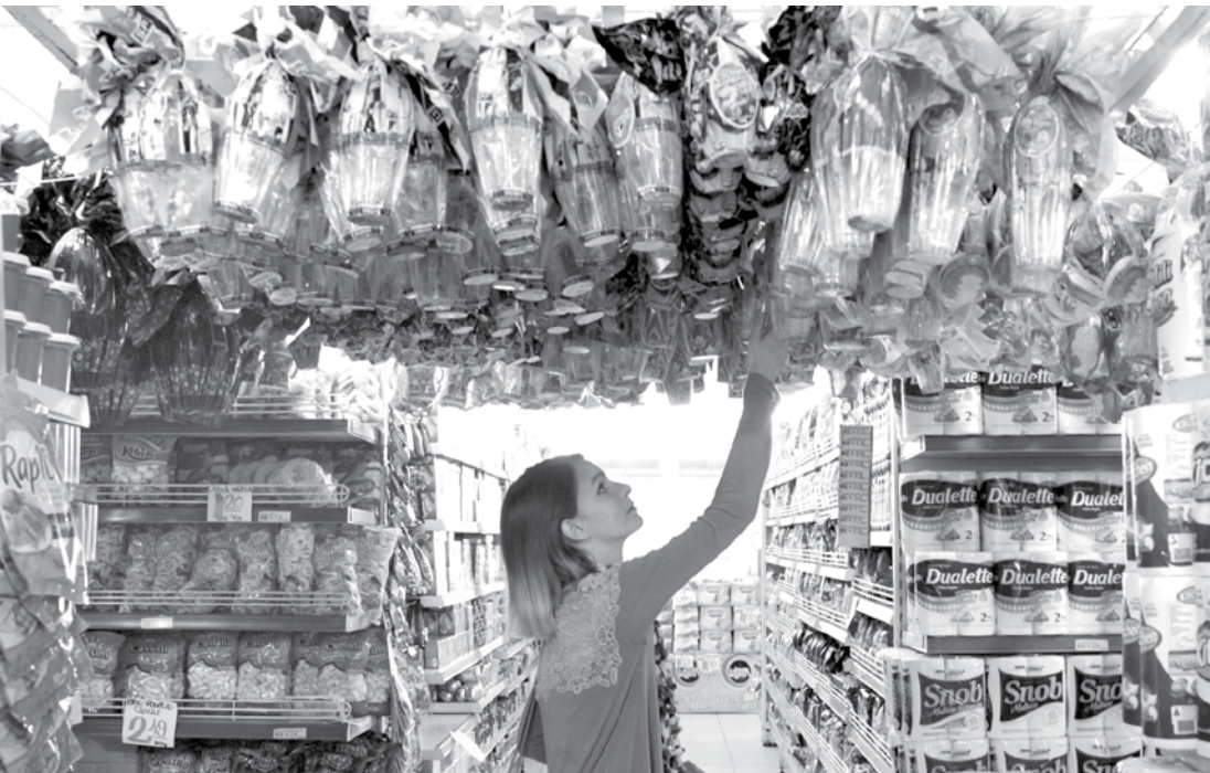
A poucos dias da Páscoa, procura por ovos de chocolate faz os consumidores saírem às compras: estima-se aumento de 5% nas vendas em relação ao ano passado