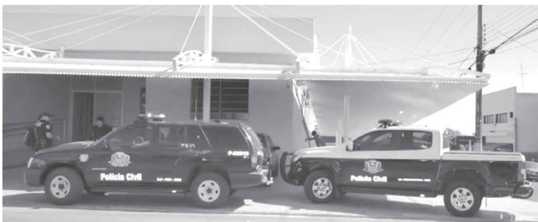
Operação focou no combate ao tráfico de drogas

Na quinta-feira (26), a Polícia Civil de Fernandópolis realizou uma operação, objetivando o combate à criminalidade, especialmente o tráfico de drogas na sua área territorial, a qual abrange 12 municípios da região. Em contato com a Delegacia Seccional de Polícia, a Reportagem de “O Extra.net” foi informada de que a referida operação culminou na apreensão de um adolescente, além do cumprimento de três mandados de busca e apreensão.