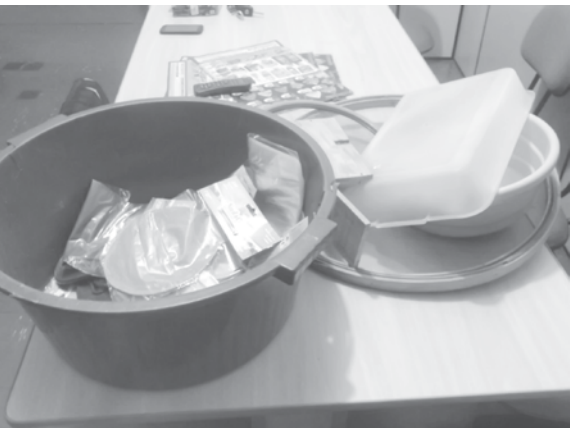
Foram apreendidos 51 kg de cocaína pela PF de Jales