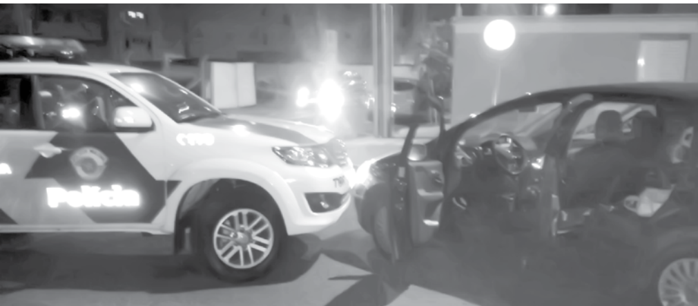
O líder do bando foi preso em Rio Preto