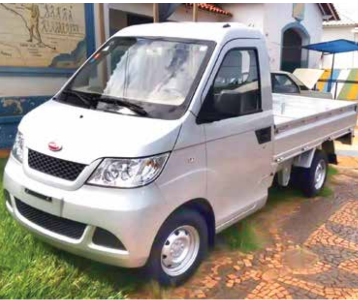
Veículo ficou exposto na praça, para que a população pudesse ver de perto a nova conquista do município