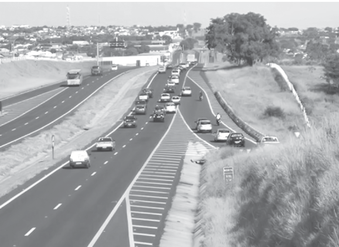
Trecho da Rodovia Euclides da Cunha (SP-320), utilizado por muitos moradores da região para o deslocamento até Fernandópolis

Pesquisa mostra integração entre municípios e movimentos de migração; em razão de sua economia, Fernandópolis é considerada uma cidade-polo da região