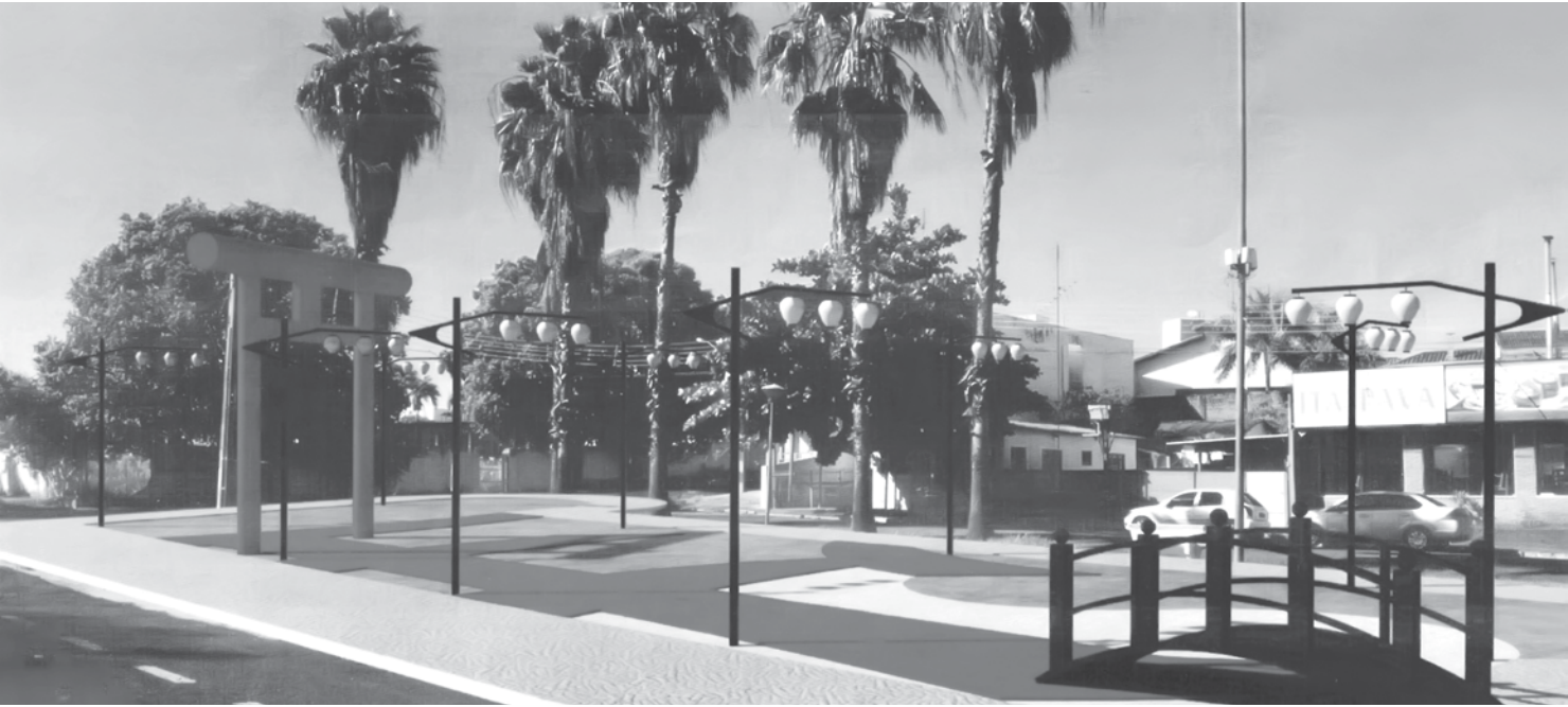
“Praça do Sol Nascente” será inaugurada hoje

Cônsul geral do Japão é convidado especial da solenidade