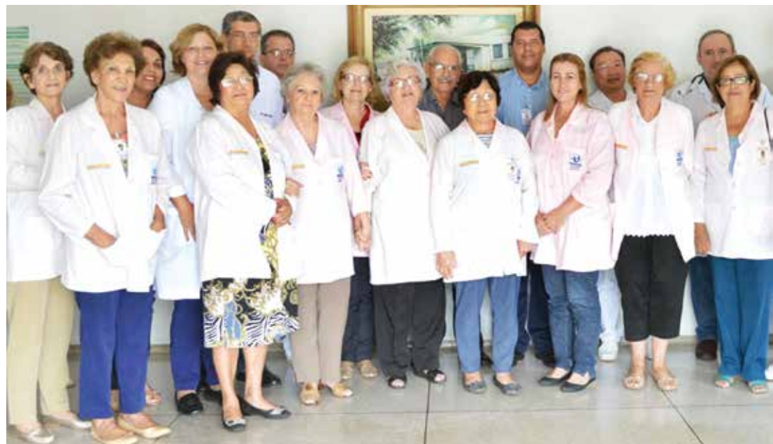
Provedor, diretores e médicos ao lado das integrantes da Volfer