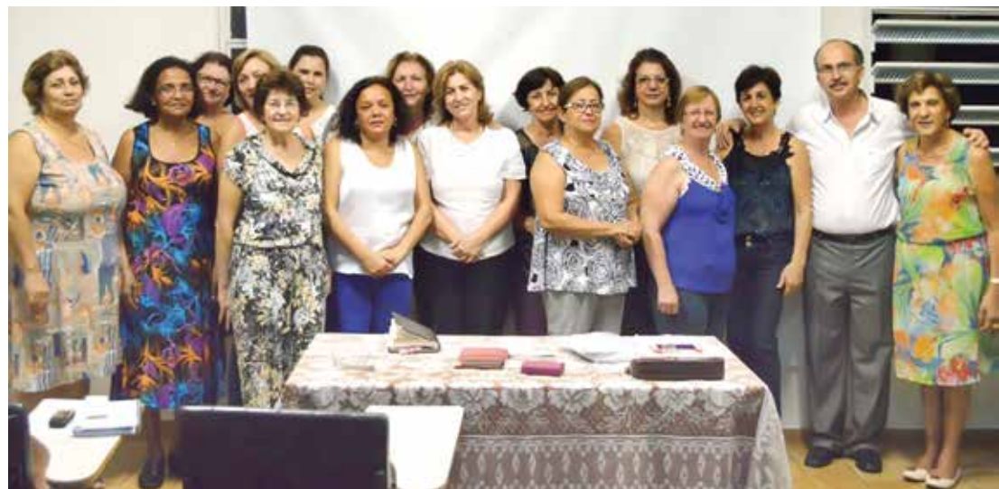
Registro de voluntárias e colaboradores das ações em prol da Santa Casa de Fernandópolis