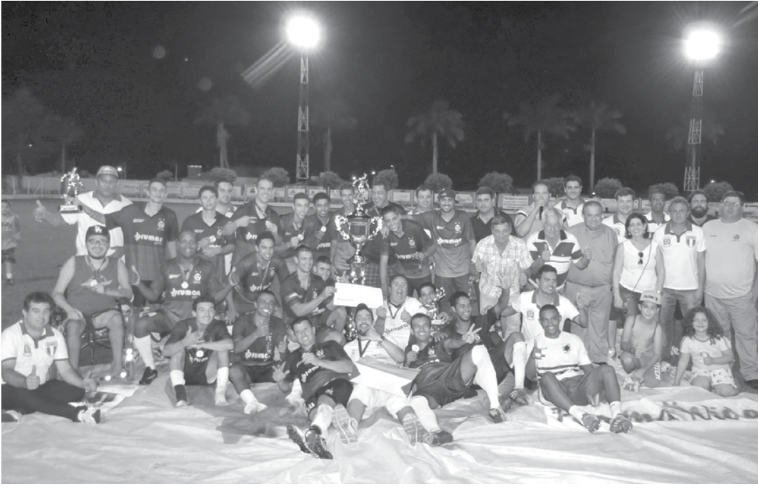
Equipe Atecubanos/Bruman Gráfica levou a taça de campeão e o prêmio de R$ 2 mil