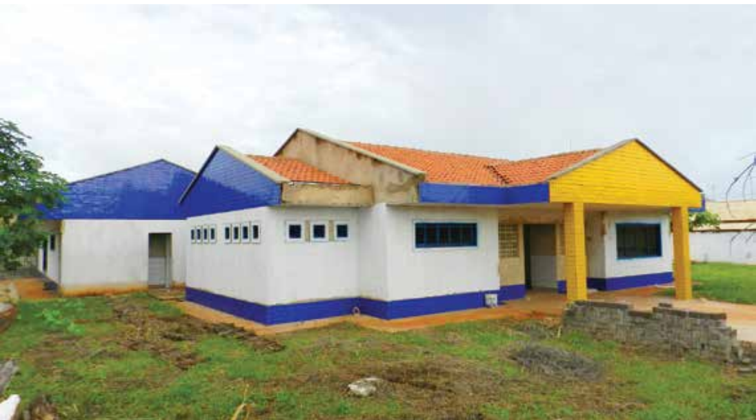
Construção da Unidade Escolar de Educação Infantil cuja previsão inicial de conclusão era para março de 2013

512 mil. De acordo com o prefeito Tião Geraldo, as obras são de fundamental importância para os moradores dos bairros, que cresceram muito, melhorando assim o atendimento à população. O caso mais crítico é em relação a obra de construção da Escola de Educação Infantil, iniciada em julho de 2012. O prefeito garante que mais uma vez vai até Brasília para pedir que o restante dos recursos seja repassado com a maior urgência para a conclusão das construções.