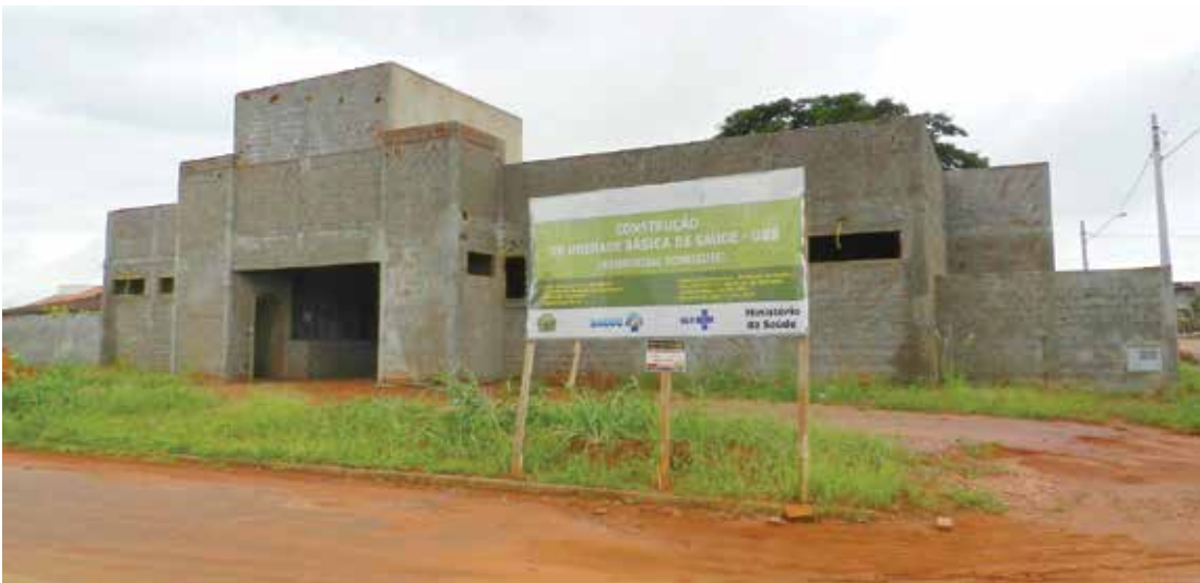
Construção da Unidade Básica de Saúde no Residencial Rodrigues paralisada devido ao não envio de recursos federais