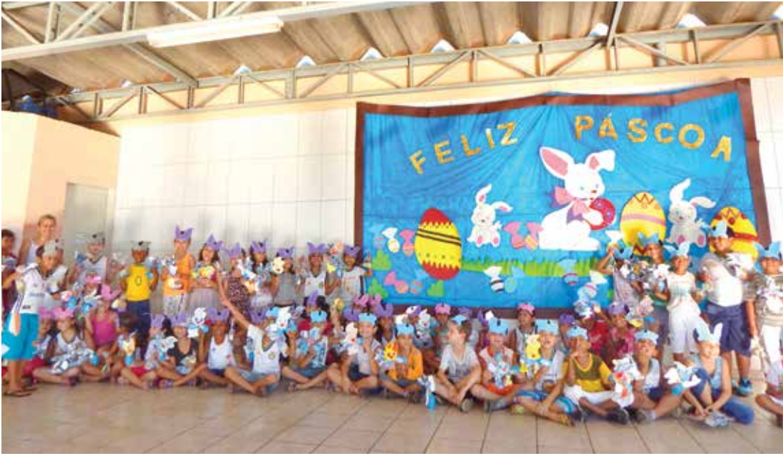
Alunos receberam os kits com muita festa e animação

Nas escolas municipais, os estudantes também participaram de atividades co-