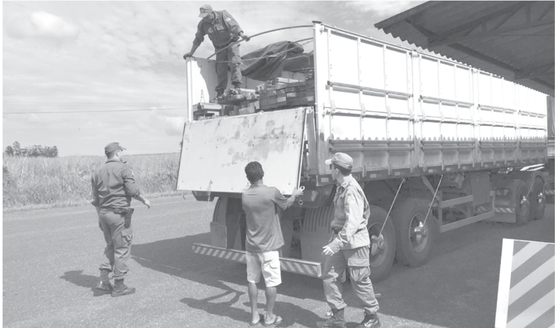
A operação da Polícia Ambiental intensificou a fiscalização em eixos rodoviários no Noroeste Paulista

A operação contou com o efetivo de 250 policiais militares ambientais, distribuídos