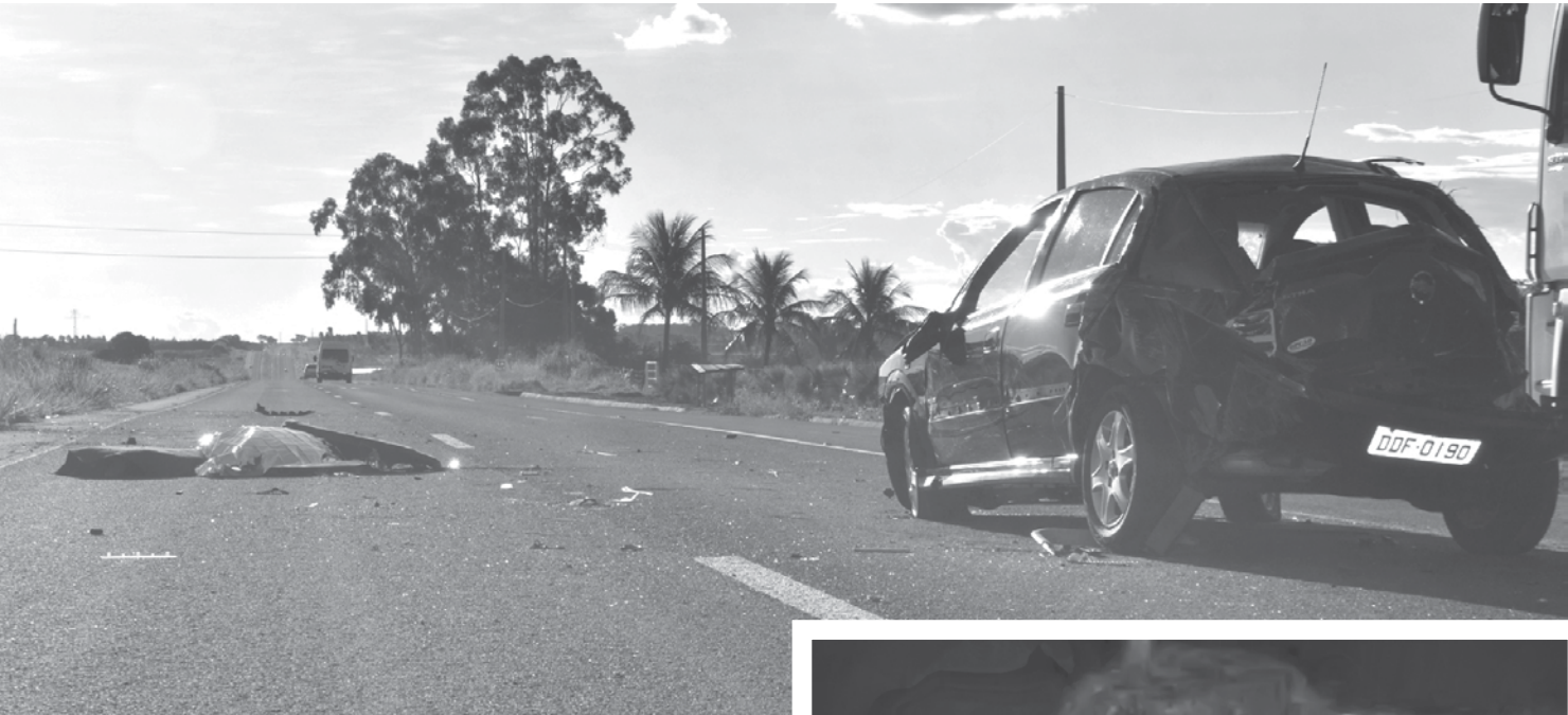
Carro havia sido comprado pela vítima na manhã de quarta-feira

→ JOSANIE BRANCO jo@oextra.net Um jovem fernandopolense foi vítima fatal de um acidente de trânsito registrado na tarde da última quarta-feira, dia 01, na Rodovia Euclides da Cunha (SP-320).