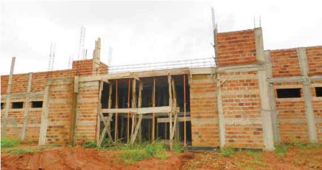
Construção da Unidade Básica de Saúde no Conjunto Habitacional Celestino Carnielo também paralisada