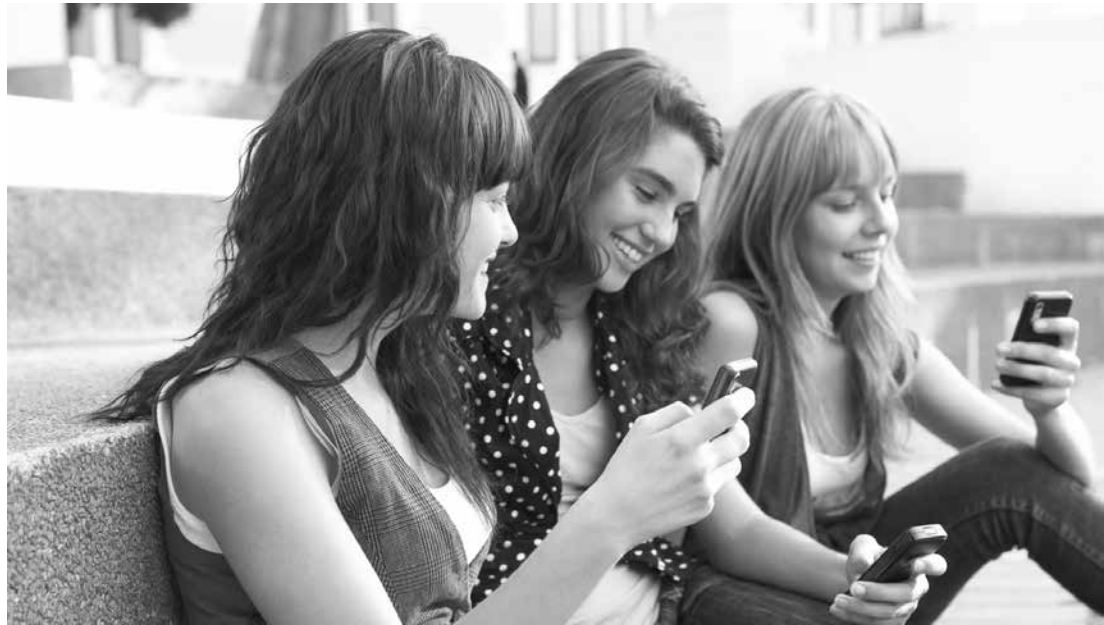
A iniciativa pretende estimular ideias e soluções tecnológicas e criativas para questões ligadas à adolescência através do incentivo