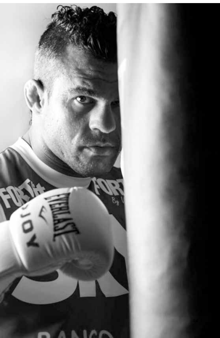
Vitor Belfort luta no próximo dia 23 de maio defendendo o cinturão de peso médio do UFC