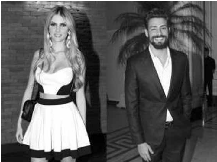
Cauã Reymond e Bárbara um novo casal no ‘mundo das celebridades’

Galvão: “O baladeiro da casa continua sendo meu pai. Para seguir o velho tem que ter pique, viu”.