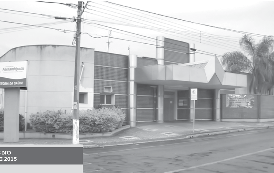
Sede da Central da Saúde, que abriga a Secretaria da Saúde e diversos setores da Saúde Pública Municipal de Fernandópolis