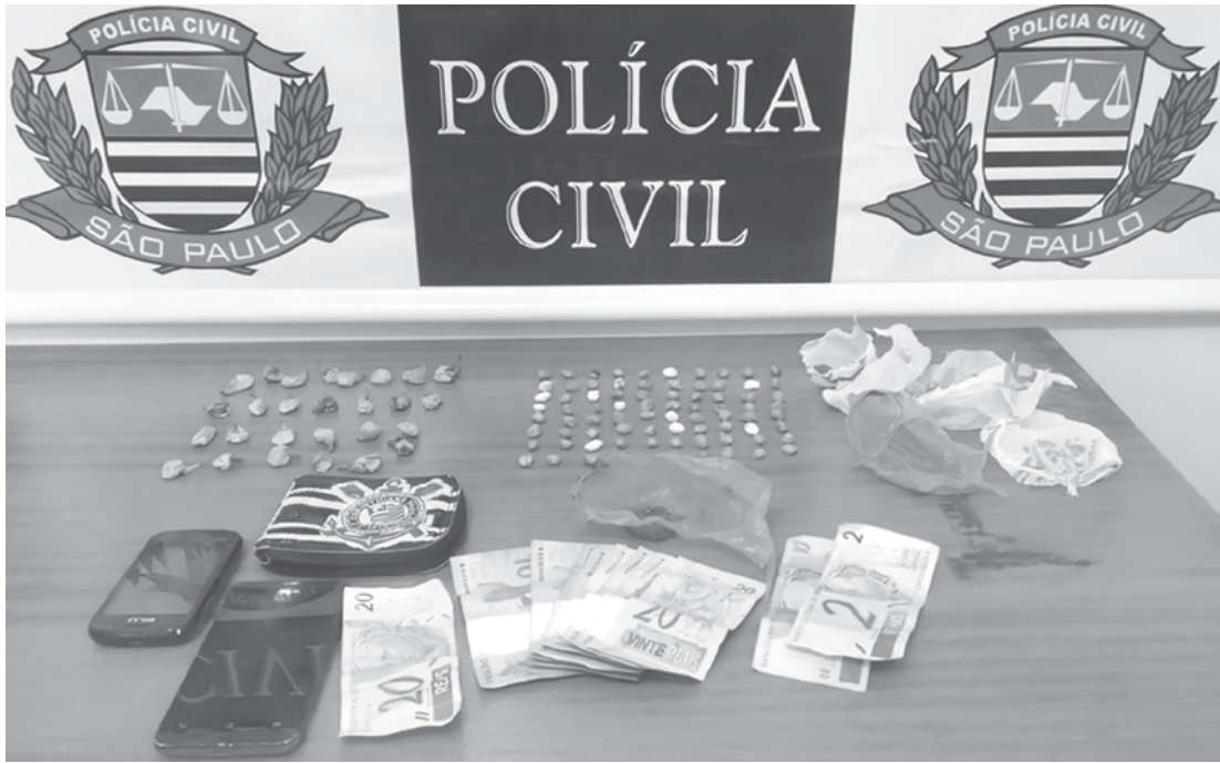
Drogas, dinheiro e aparelhos celulares apreendidos pelos policiais civis

Na ocasião, os jovens foram flagrados com 80 pedras de crack, 27 porções de cocaína e uma porção de maconha, prontas para a venda/consumo. Cerca de R$ 200,00, além de dois aparelhos celulares, também foram apreendidos. O flagrante aconteceu por meio de denúncias anônimas, tendo em vista que os adolescentes já vinham