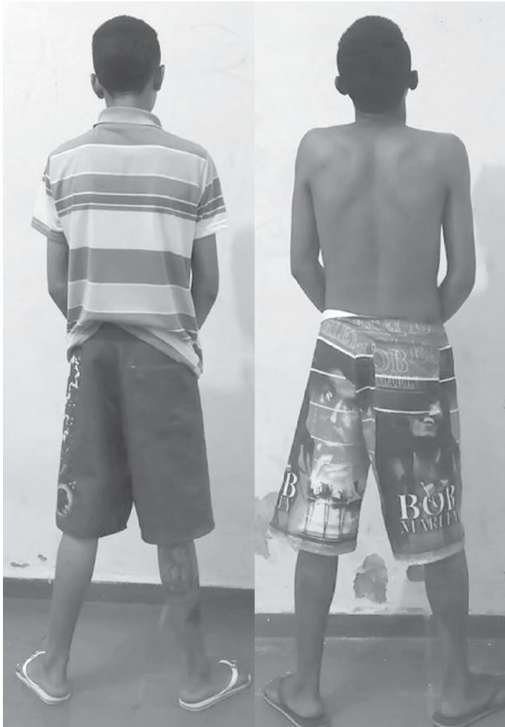
Adolescentes detidos na sede da DISE após serem flagrados com entorpecentes

por volta das 15h, agentes da DISE já haviam apreendido em flagrante um adolescente de 16 anos suspeito de tráfico de drogas no bairro Corin-