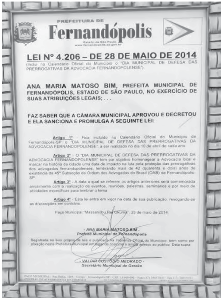
OAB Fernandópolis celebra neste 10 de abril, o Dia Municipal da Defesa das Prerrogativas da Advocacia Fernandopolense