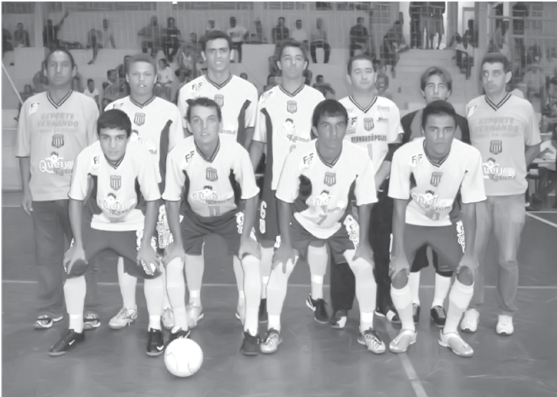
Equipe local jogará as duas partidas da segunda fase fora de casa

A participação do time, composto somente por jogadores “pratas da casa”, na competição tem o apoio da Prefeitura de Fernandópolis, através de parceria entre a SMEL (Secretaria Municipal de Esporte e Lazer) e a AFUFER (Associação de Futsal de Fernan-