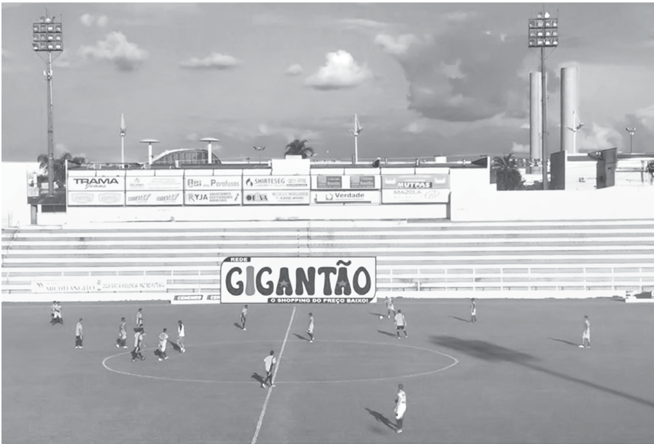
Amistoso aconteceu no estádio Anísio Haddad, casa do Rio Preto