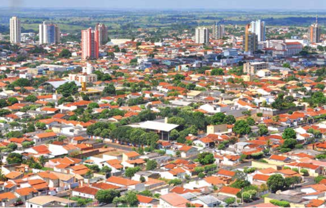
Respeito à Lei, atualização de banco de dados e isenção do IPTU: cidade vive novo “duelo de opiniões”