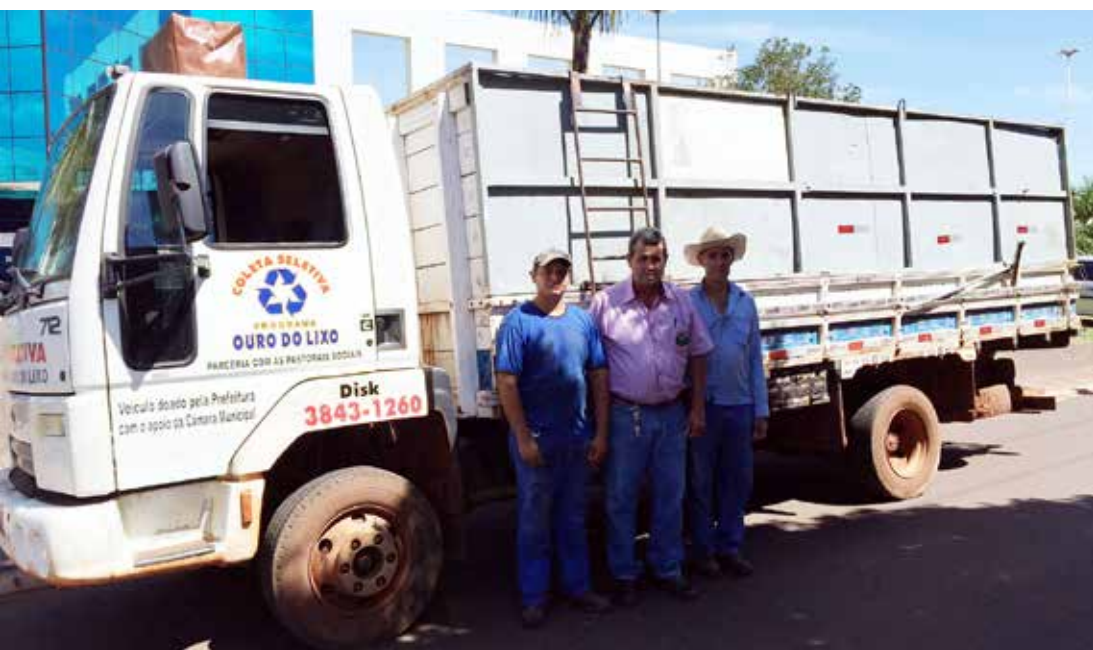
Caminhão do “Ouro do Lixo” percorre as ruas e avenidas da cidade para a coleta dos materiais recicláveis

Quem puder colaborar, ligue para o Disk Coleta: 99646-8694, 99756-1121 ou 99716-7744.