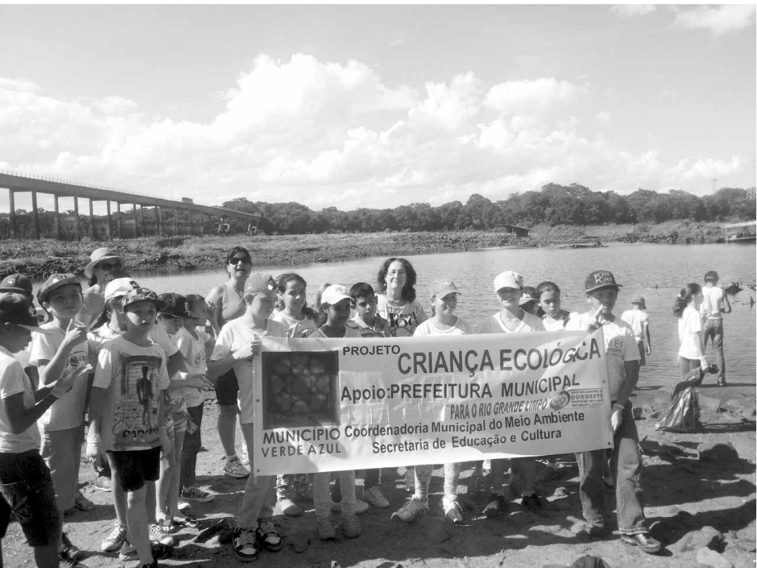
A iniciativa visa ajudar professores e alunos no trabalho de conscientização em relação à cultura de preservação da água

tivas á água no meio ambiente e assumir de forma independente e autônoma atitudes e valores voltados á sua proteção e conservação.