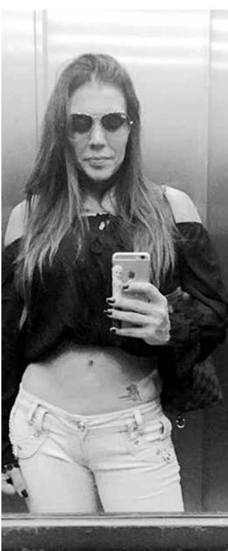
Boa forma em evidência

“Linda e inspiradora pela força que sempre teve, seja pra criar os filhos, encarar os obstáculos ou simplesmente construir lindamente um