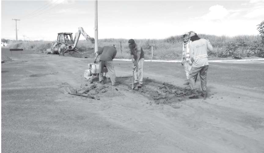
Serviços de tapa-buraco são executados no Parque Universitário