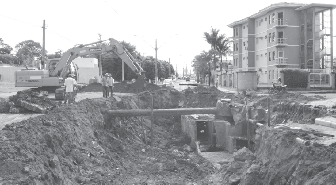
Obra requer cuidados especiais na execução dos serviços