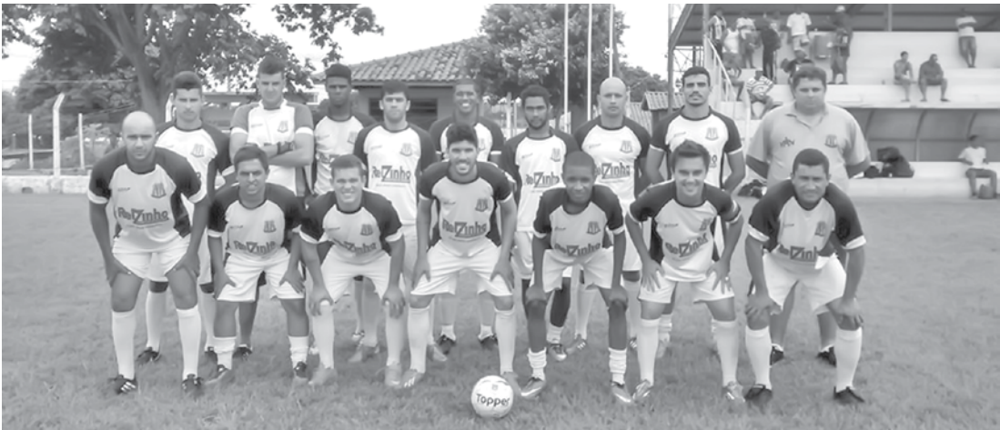
Jogadores e equipe técnica que integram o Clube Esportivo de Ouroeste

mais uma partida pelo Campeonato de Futebol Amador na cidade de Pontalinda, onde enfrenta a equipe da casa. As competições da equipe de Ouroeste têm o apoio e incentivo da Prefeitura Municipal, através da Secretaria de Esporte, Lazer e Turismo.