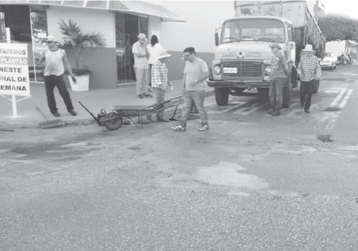
Equipe da Secretaria de Infraestrutura trabalha no Bairro Ana Luiza

racos maiores, e na segunda, na próxima semana, a equipe da Secretaria de Infraestrutura irá trabalhar na correção de buracos de menor dimensão. Diversos bairros também receberão os serviços de tapa-buraco.