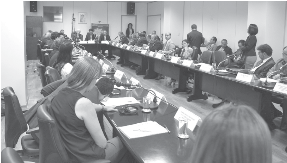
Encontro reuniu 14 administradores de ZPEs de todo o Brasil