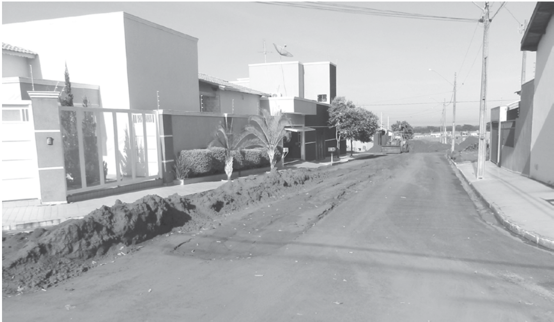
As obras de infraestrutura vão melhorar as condições de vida da população do bairro

→ Da REDAÇÃO contato@oextra.net A administração municipal de Ouroeste iniciou uma nova etapa de obras de infraestrutura