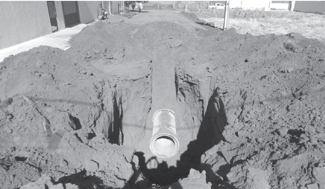
Os serviços de implantação de galerias de águas pluviais vão beneficiar as Ruas Francisco J. de Oliveira e João Carmona