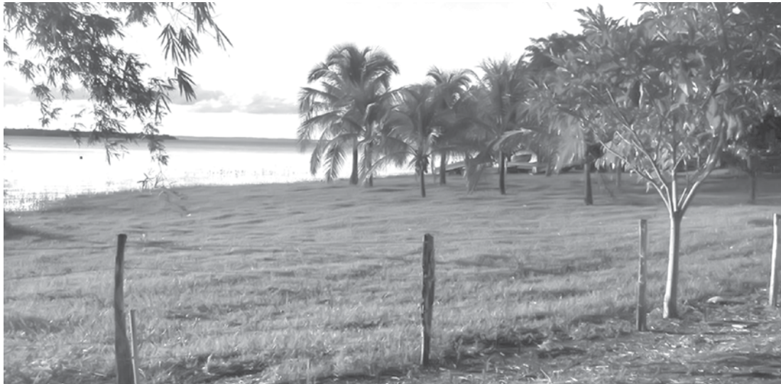
Os afogamentos foram registrados na Prainha de Mira Estrela

A perícia técnica da Polícia Civil compareceu ao local e todos os procedimentos de praxe foram tomados. O caso é investigado.