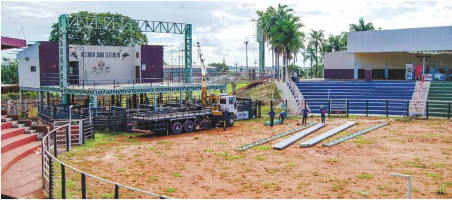
Preparativos estão a todo vapor no recinto João Scatolin, em Indiaporã, para a Festa do Peão, que será realizada entre os dias 6 e 9 de maio

ser o maior evento de todos os tempos, superando até mesmo a festa de 2013, quando a dupla Jads & Jadsen levou mais de 10 mil pessoas para o recinto de festas.