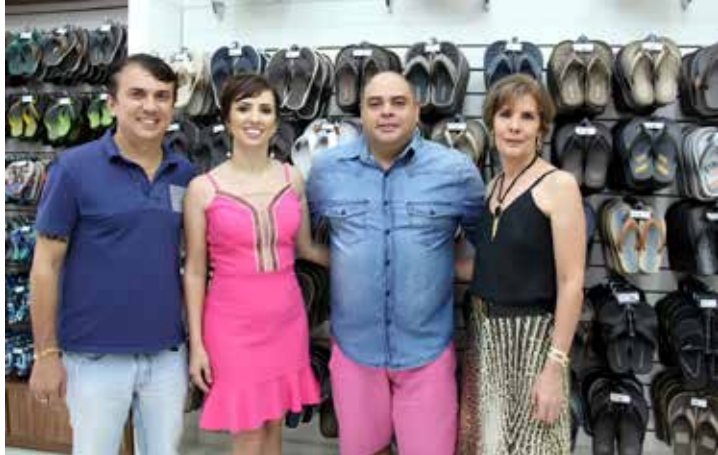
Inaugurada em Fernandópolis esta semana, a Chinelaria traz tudo que há de mais bonito e moderno em chinelo masculino, feminino e infantil, para todos os gostos. Uma bonita festa, com a presença de convidados especiais, foi realizada no início dos trabalhos da mais nova empresa, na área central da cidade. Confira os momentos especiais!