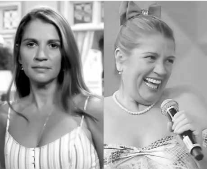
Longe das telinhas, Tássia Camargo reapareceu no programa 'Tudo Pela Audiência'