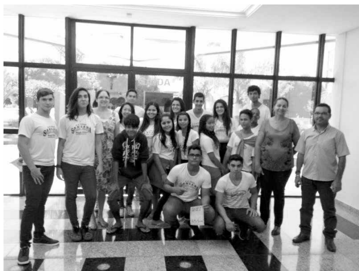
Visita dos alunos e entrega do material educativo na Prefeitura Municipal