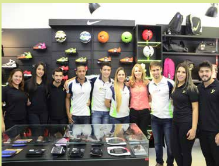
Equipe de funcionários, posando para a foto, durante início dos trabalhos na Sport You .