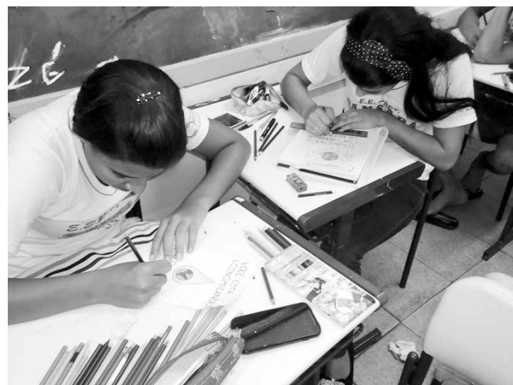
Alunos em sala de aula, durante a confecção do material

por meio do Circuito Cultural Paulista, um programa que visa promover a difusão cultural descentralizada por meio da realização de espetáculos em diversas linguagens artísticas, levando a diversidade artística por onde passam. Com a curadoria dos mais importantes profissionais do Teatro, Dança, Circo, Música e Infantil, a ação impulsiona a agenda cultural dos municípios, ampliando o acesso do público a