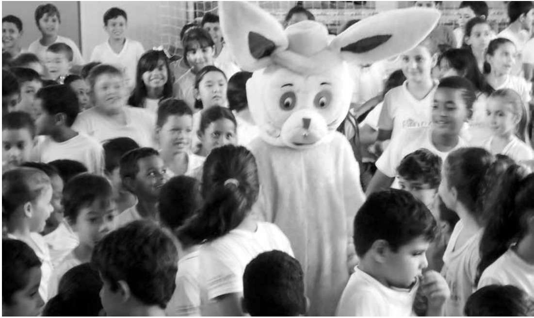
Em Ouroeste, a entrega dos “Ovos de Páscoa” fez a alegria das crianças da EMEF