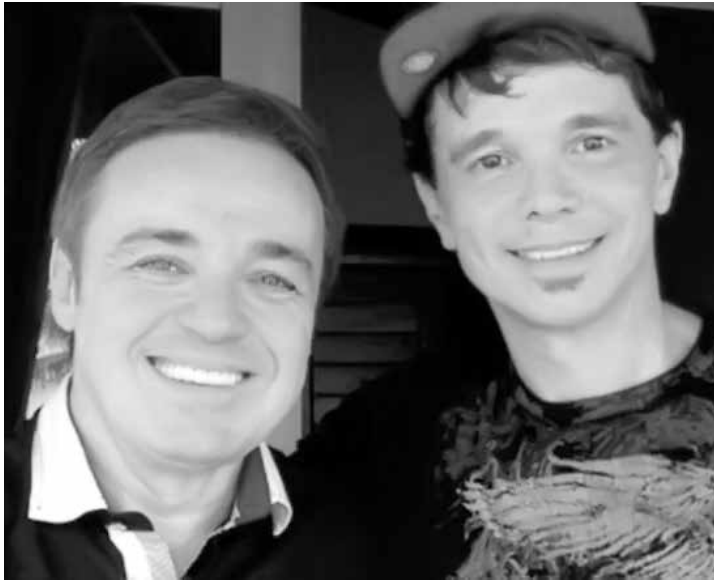
Netinho conta suas experiências e aprendizados

Além dos integrantes da "Escolinha do Professor Raimundo", o programa contou com a presença de Rafinha Bastos no quadro "Kama Surtta". Ele abaixou as calças e mostrou o bumbum para toda a plateia enquanto respondia algumas perguntas indiscretas.