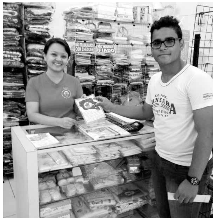
Distribuição dos panfletos no comércio local

os folders e panfletos confeccionados. O projeto é uma das etapas desenvolvidas no PROEMI (Programa Ensino Médio Inovador) e contou com a participação da equipe gestora, professores e alunos.