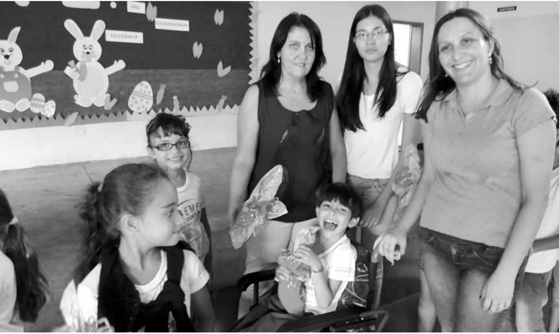
A escola estava decorada com símbolos da Páscoa

A Prefeitura de Ouroeste, em mais um ano, promoveu a distribuição de Ovos de Chocolate em comemoração à Páscoa. Centenas de “Ovos de Páscoa” foram entregues a todas as crianças das escolas da rede municipal de ensino de Ouroeste e Arabá. Em Ouroeste, a entrega dos ovos fez a alegria das crianças da EMEF, a escola estava toda decorada com símbolos que festejaram a data, destacando os valores, significados e importância da data. Segundo o prefeito Tião Geraldo, a iniciativa teve a intenção de manter a distribuição dos ovos de chocolate e oferecer a oportunidade de todas as crianças comemorem a data.