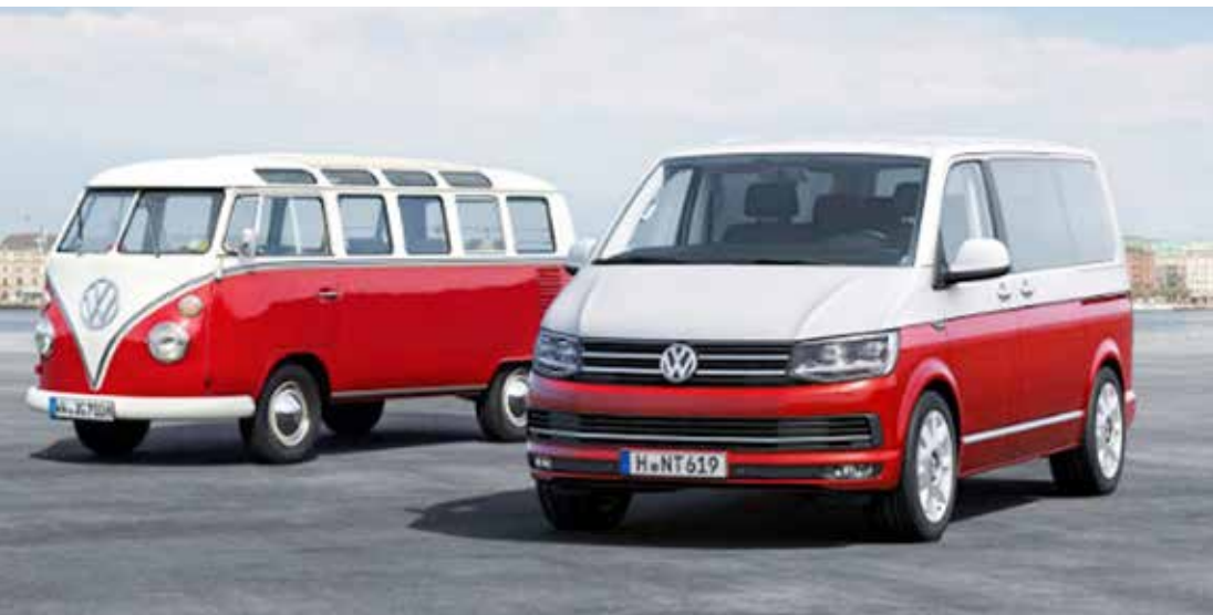
Para não restar dúvidas de que modelo T6 é o sucessor da Kombi, a própria VW lançou a novidade ao lado da primeira Kombi, com linhas vermelhas. LED, rodas 18 polegadas e motor turbo empolgam

O T6 é, na realidade, a Kombi moderna que o Brasil nunca teve. Por aqui o modelo parou na segunda geração e saiu de linha em 2013