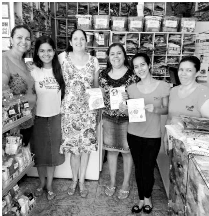
Alunas e professores fazendo o trabalho de conscientização

conscientizados sobre a importância deste bem tão precioso e vital, tendo em vista o Dia Mundial da Água (22 de março). Os alunos confeccionaram folders e panfletos que foram distribuídos à popula-