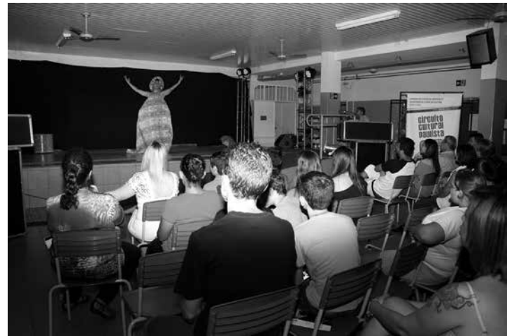
A atração do Circuito Cultural Paulista reuniu cerca de 180 pessoas

shows e espetáculos de artistas consagrados e novos nomes do cenário brasileiro. A atração foi uma das mais aplaudidas na cidade, pelo brilho e profissionalismo do artista. O evento é uma realização da Secretaria de Estado da Cultura em parceria com a Prefeitura de Ouroeste, através da Secretaria de Cultura e coprodução da Associação Paulista dos Amigos da Arte (APAA).