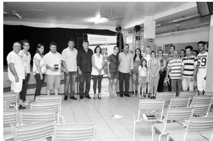
Autoridades municipais junto à equipe gestora da escola Sansara, o artista e técnicos