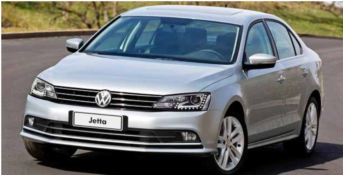
Novo Jetta ainda é importado do México. O nacional, feito em São Bernardo, chega no segundo semestre

Um sedã de peso oferecido em três versões com preço inicial na casa dos R$ 69 mil (Trendline) é a nova aposta da VW para 2015. Dentre os itens