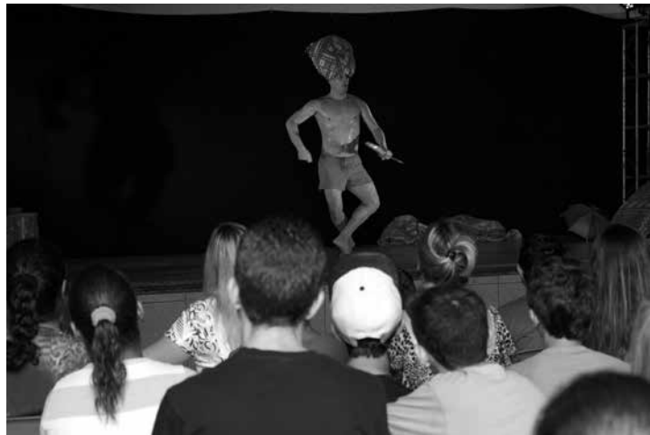
“Delírio” aconteceu gratuitamente na escola Sansara e arrancou aplausos do publico