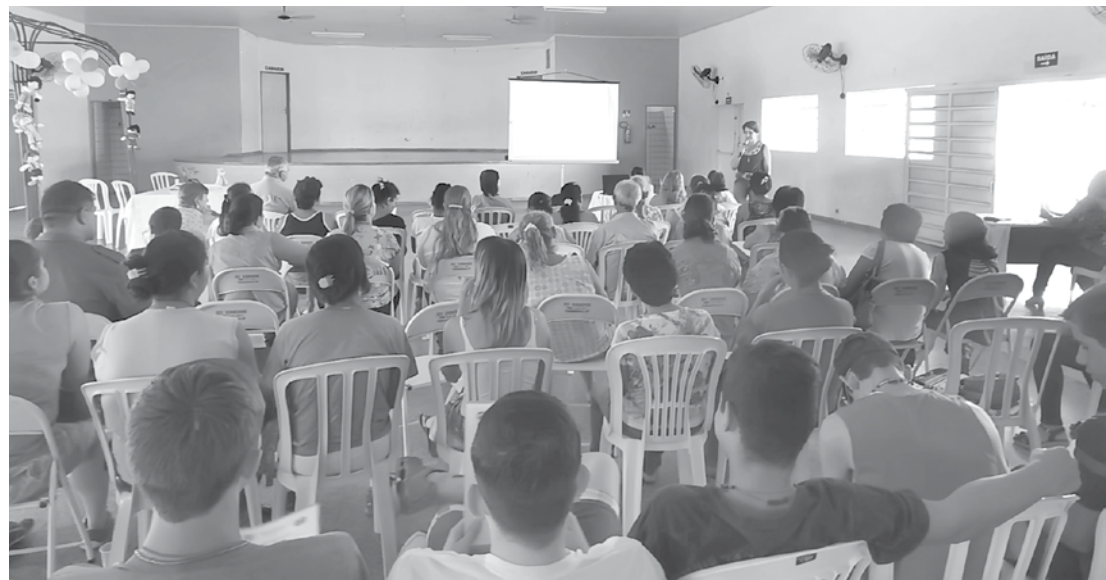
Foi registrado um grande público durante a conferência; próximo encontro será realizado pelo CONANDA

conforme orientação do Conselho Nacional dos Direitos da Criança e do Adolescente (CONANDA), visando avaliar e compartilhar as ações e experiências do poder público municipal nas ações efetivas para as crianças e adolescentes de Pedranópolis.