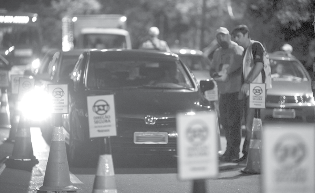
Blitz de fiscalização da Lei Seca foi realizada entre a noite de sábado (18) e a madrugada de domingo (19): ao todo, 129 condutores foram submetidos ao teste do etilômetro

também foi apreendido com o grupo. O trio foi ouvido e conduzido a cadeias públicas da região, onde permaneceu à disposição da Justiça.