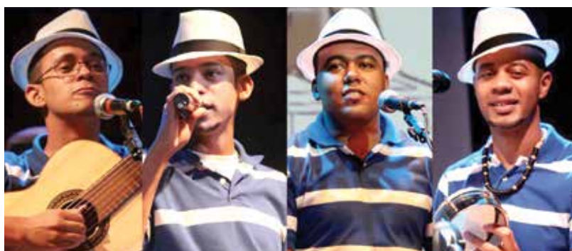
*Confira a programação em http://www.sescsp.org.br/circuitosescdeartes