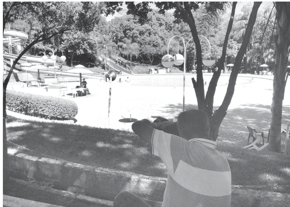
Registros fotográficos em Fernandópolis que entrarão oficialmente para o Banco de Imagens do Estado de São Paulo