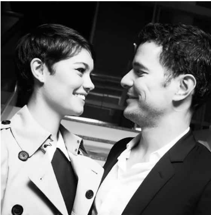
Sophie e Daniel sem a aliança de noivado

Juntos há um ano, Sophie Charlotte e Daniel de Oliveira estão em crise. O ator não está nada satisfeito com as cenas quentes que a amada tem feito com Bruno Gagliasso em "Babilônia". Pois bem. A situação agora se agravou, e eles acabaram tendo um desentendimento nesta semana. Para acalmar os ânimos, Daniel foi passar uns dias com a sua família em Minas Gerais.