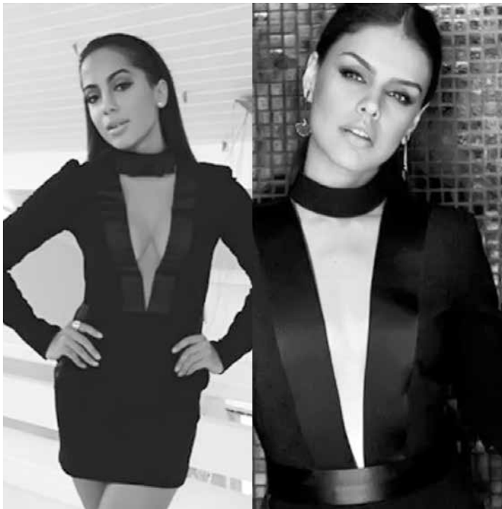
Anitta e Paloma: quem ficou melhor?

Dizem as más línguas que Anitta e Paloma Bernardi não se bicam desde que participaram do quadro "Dança dos Famosos", do "Domingão do Faustão", no ano passado. Mas essa rivalidade ultrapassou a competição e elas continuam se estranhando. Intencionalmente ou não, Anitta foi à festa de 50 anos da TV Globo, na quinta-feira passada, com o mesmo modelo de vestido que Paloma usou há uma semana. Ao saber que ambas estavam sendo comparadas, a namorada de Thiago Martins não hesitou em alfinetar a funkeira, afirmando que ela "gosta de competir" e que es-