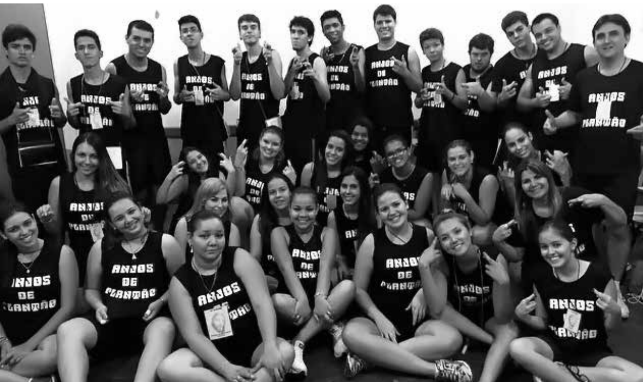
Destaque para a galera responsável pela animação do EJCRI , encontro realizado no último final de semana em Fernandópolis.