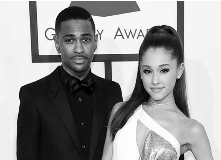
Big Sean e Ariana Grande

Porém, fontes afirmaram que o tweet não passou de uma brincadeira e que o rapper em momento algum ficou realmente bravo com Bieber.