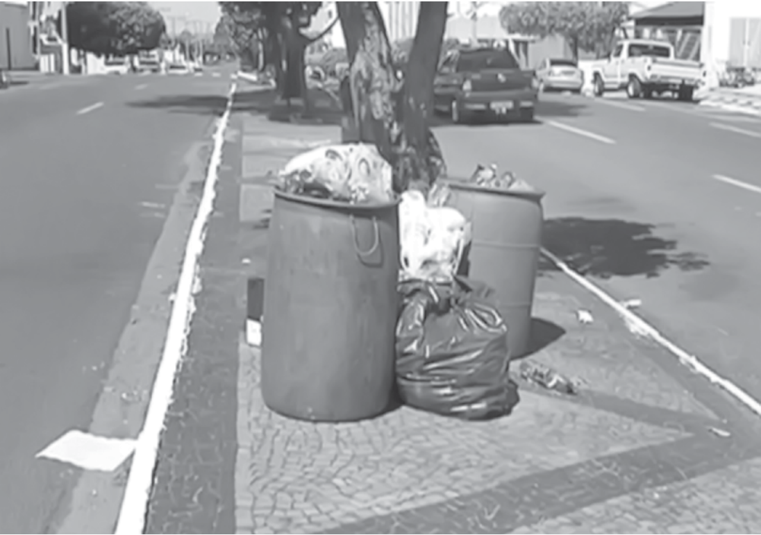
Lixo ficou acumulado em avenidas da cidade nesta segunda-feira

Empresa informou que pagamento parcial de novembro foi feito; assessor da prefeitura disse que não há prazo para pagamento total