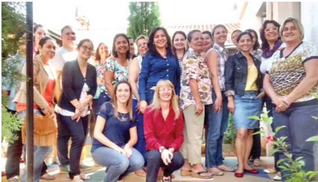
Professores da Rede Municipal participando do treinamento realizado pela Elektro

trica, os tipos e as fontes de energia e como usar bem a eletricidade por meio de mudança de hábitos de consu-