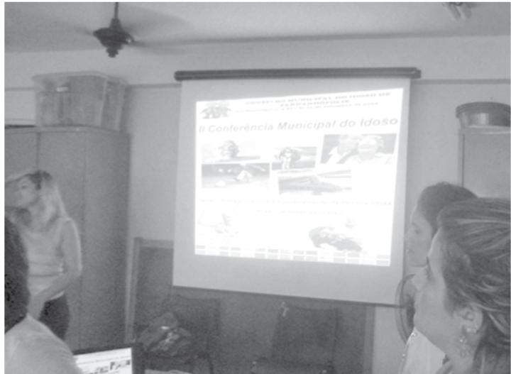
Diversos temas relacionados ao idoso foram abordados no evento