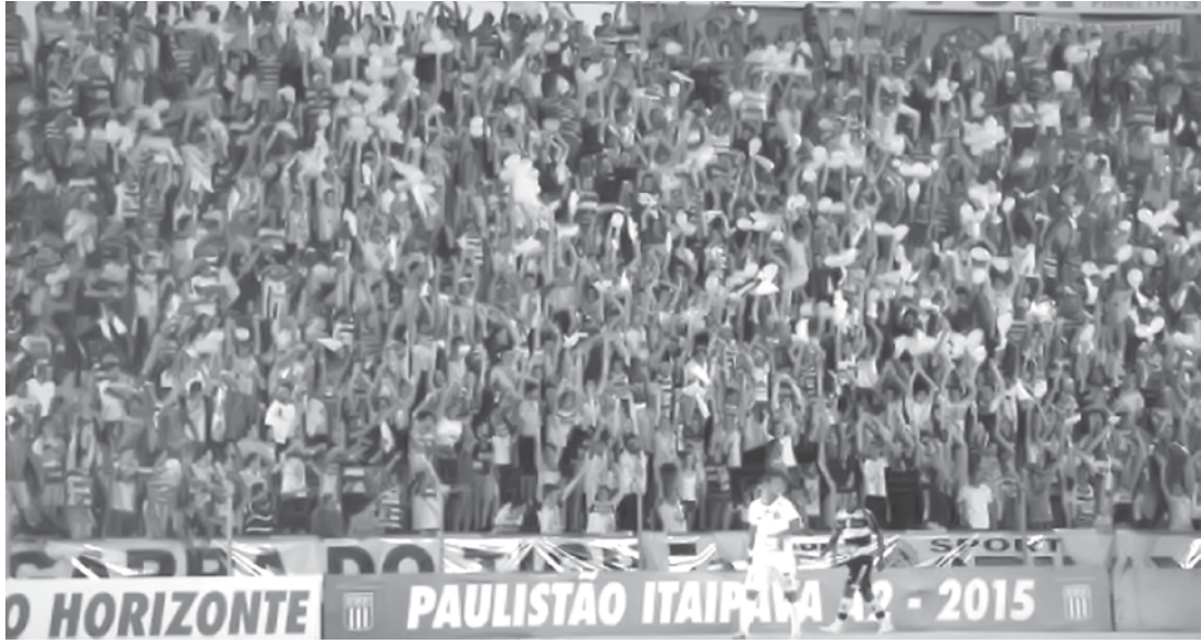
Mídia de 4 mil torcedores por jogo do Novorizontino em sua casa

“Nosso planejamento para 2015 era realmente esse. Sabíamos que teríamos dez clubes brigando pelas quatro vagas do acesso. Mas todos os jogadores, comissão técnica, diretoria, funcionários e torcedores estão de parabéns”, finalizou.