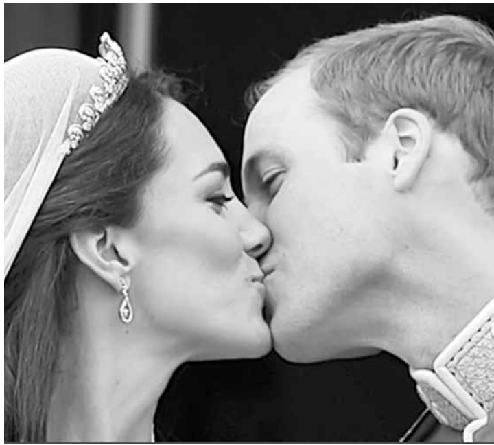
Kate e William em juras de amor eterno

Kate Middleton e o Príncipe William comemoram quatro anos de casamento nesta quarta-feira (29). A celebração aconteceu em meio à expectativa para o nascimento do segundo filho do casal, que deve vir ao mundo a qualquer momento.