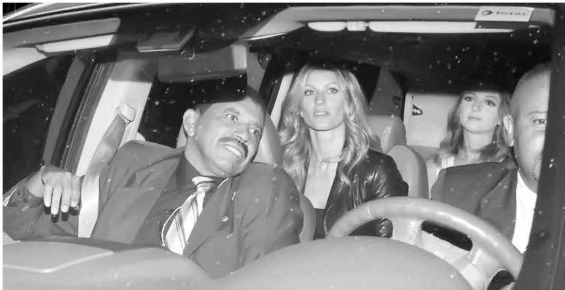
Gisele chegando a sua festa

Laura Neiva, Sabrina Sato, Ana Claudia Michels e Fernanda Motta foram algumas das celebridades que marcaram presença no evento, que também contou com uma equipe de cabeleireiros e stylists que fizeram parte da história da