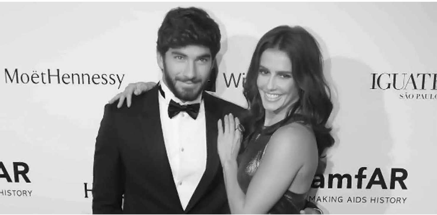
Deborah Secco posa ao lado do namorado Hugo Moura