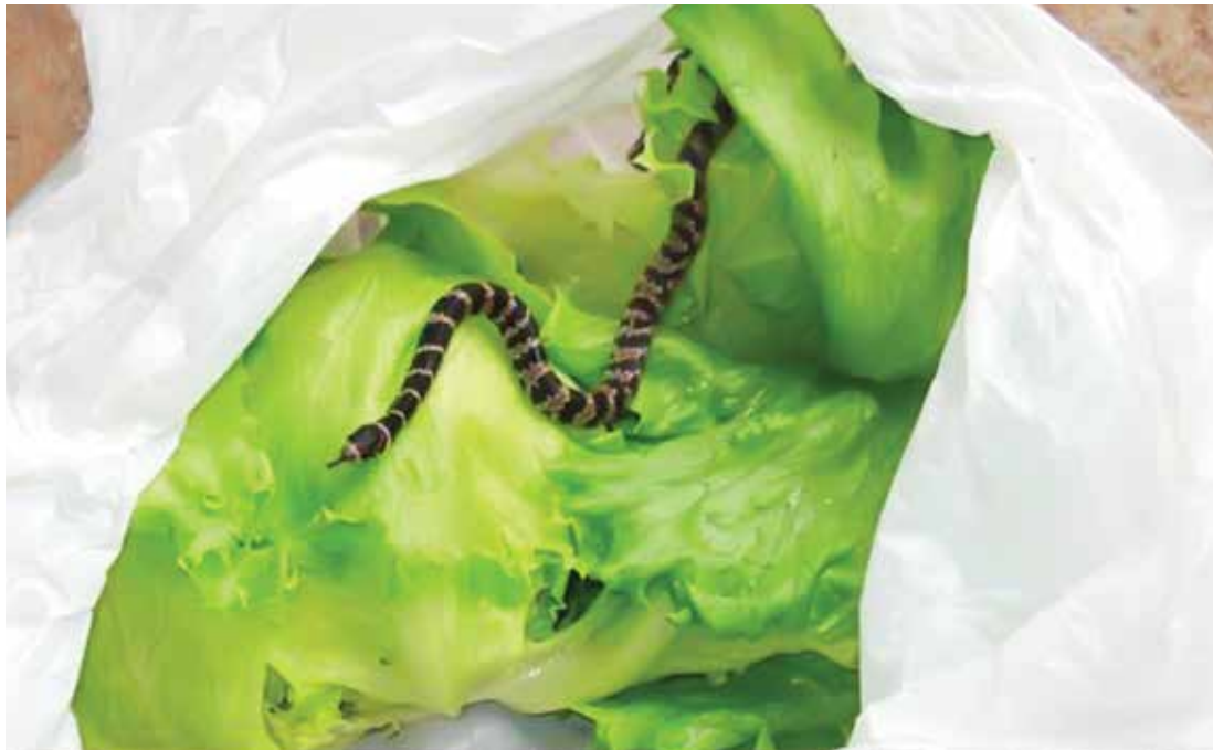
Cobra encontrada em meio a folhas de alface

Mesmo abalada com a situação, a mulher que encontrou a cobra ainda voltou à horta onde havia comprado a hortaliça e reclamou da situação e do risco a que esteve exposta.