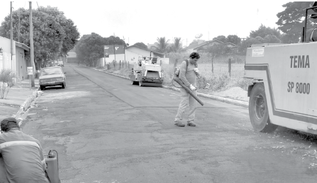
O convênio prevê a implantação de mais de 9 mil metros quadrados de recape asfáltico no Jardim das Flores

Dando continuidade às obras de recapeamento asfáltico, por toda a cidade de Ouroeste, a Prefeitura iniciou os serviços de melhoria da infraestrutura