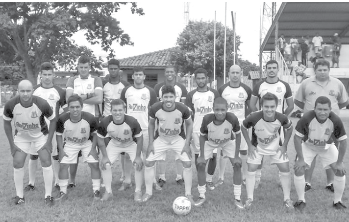
Jogadores e equipe técnica que integram o Clube Esportivo de Ouroeste

O Clube Esportivo de Ouroeste estreia, neste domingo (10), no Campeonato Intermunicipal de Turmalina. A partida será realizada às 16h, no estádio municipal.