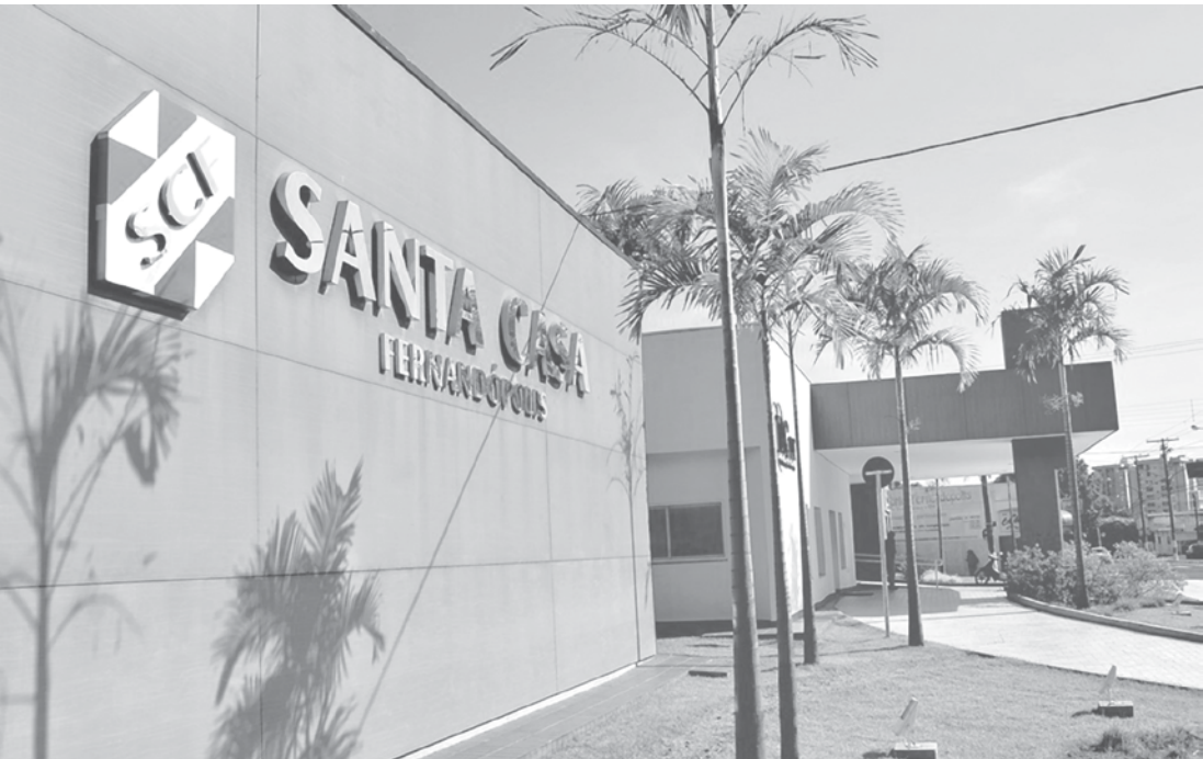
Com ferimentos no tórax e nos braços, adolescente permanece internada na UTI da Santa Casa