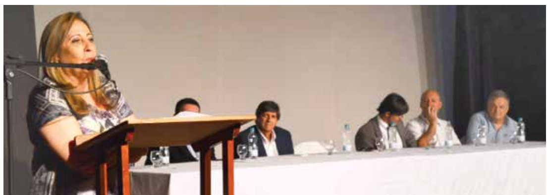
Prefeita Ana Bim marcou presença no evento realizado no Teatro Municipal de Fernandópolis

cárias em crianças. A prefeita aproveitou a oportunidade para falar da importância da parceria entre a Rede Municipal da Saúde e a Universidade, e sobre os investimentos da administração da área odontológica. “Nossa administração investe na aquisição de novas tecnologias que conferem mais qualidade ao atendimento oferecido à po-