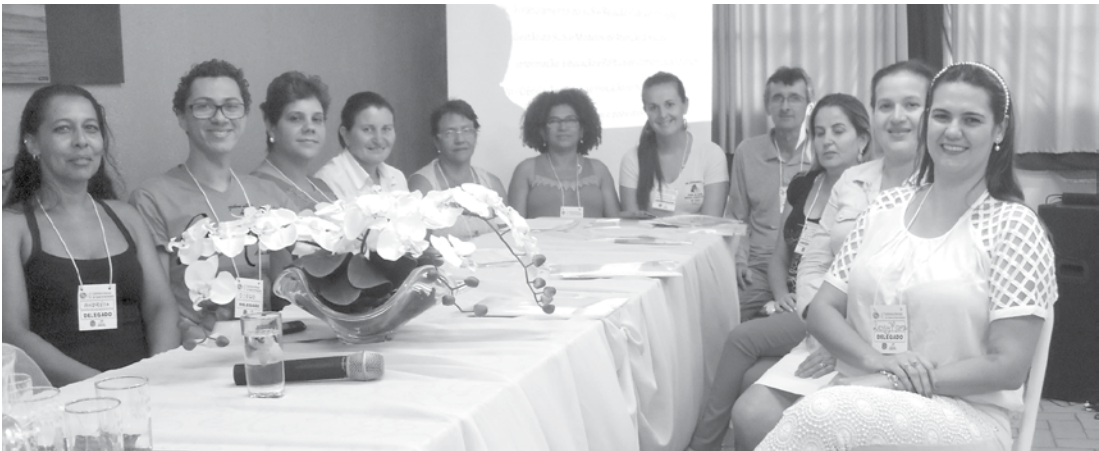
Participantes da 4ª Conferência da Saúde, em Pedranópolis