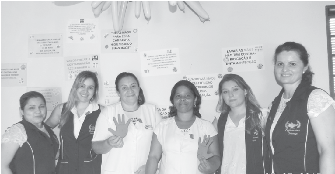
Durante a campanha de conscientização, vários cartazes foram espalhados pelo hospital orientando profissionais da Saúde e pacientes