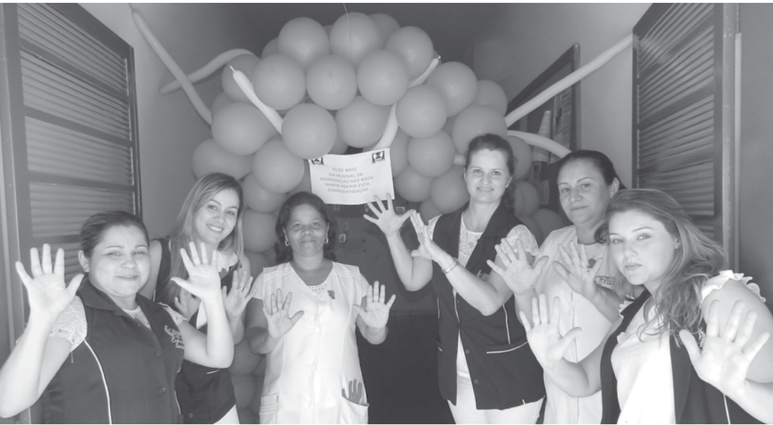
Profissionais da Saúde de Ouroeste aderiram à campanha