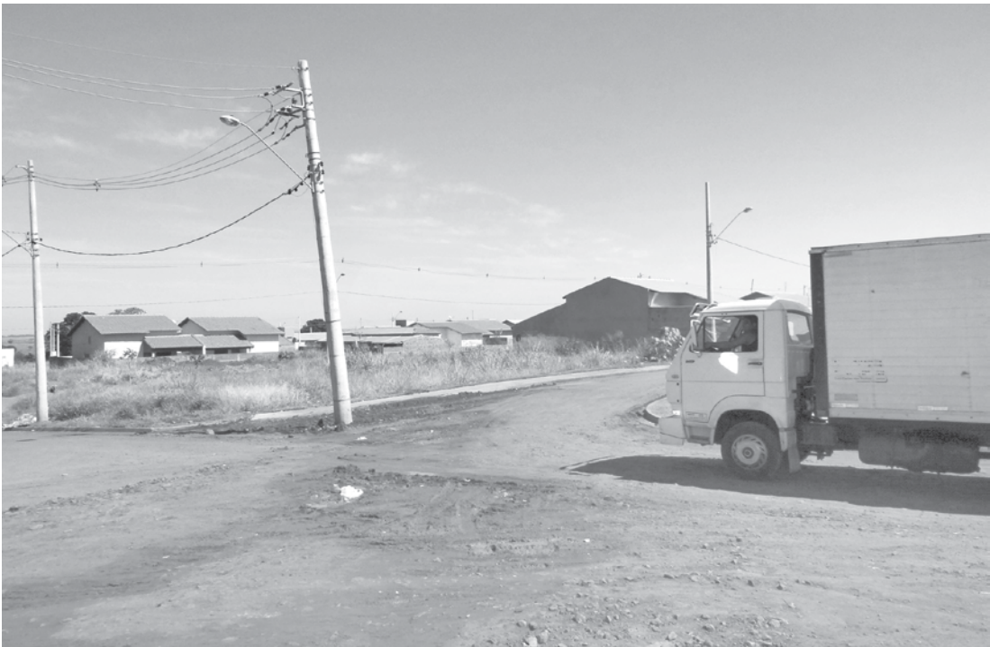
O pagamento do serviço para a retirada do poste de luz já foi efetuado, sendo aguardas as providências da companhia responsável, bem como o início das obras de pavimentação na via de acesso ao novo bairro do CDHU