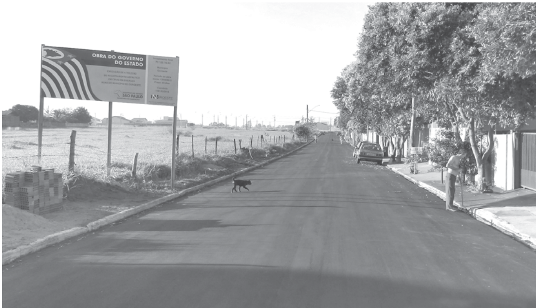
As obras vão recuperar e adequar as vias públicas do bairro para melhorar a trafegabilidade

A operação percorre todo o perímetro urbano com o objetivo de promover a ma-