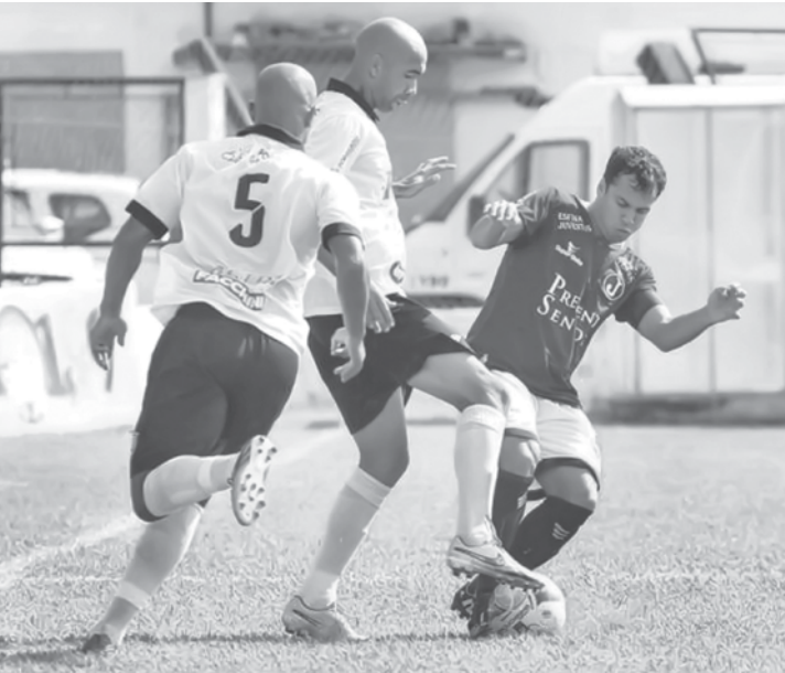
Expectativa da cidade de Votuporanga é a de que o CAV concretize o acesso neste final de semana, em São Paulo

CAV, que possui grandes chances de conquistar o acesso à segunda divisão do Paulista, é o terceiro time profissional da cidade