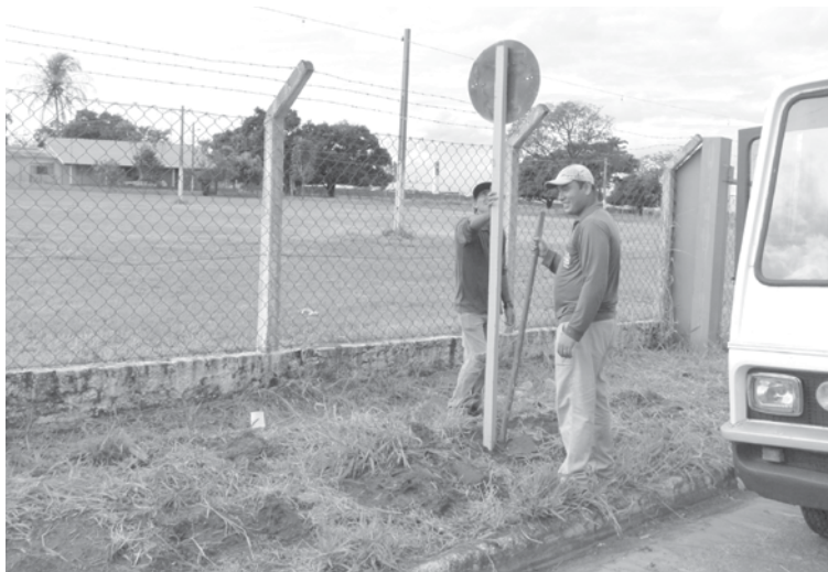
As novas placas foram instaladas no entorno e também nos principais trechos de acesso ao Recinto; novos serviços de sinalização ainda serão realizados, como pintura de solo

volvido pela administração municipal, que inclui ainda pinturas de solo, meio-fio e de lombadas.