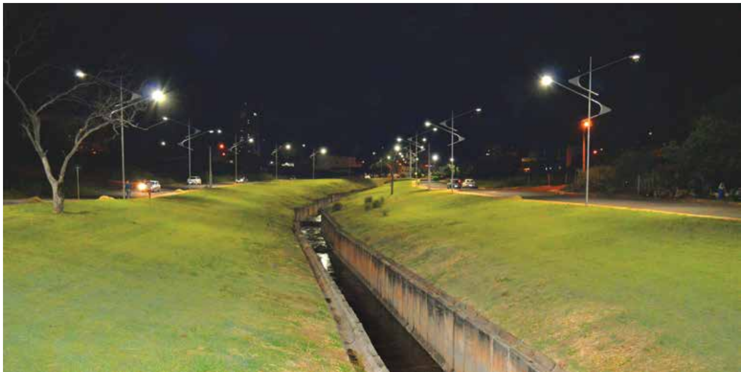
Vista da Avenida Raul Gonçalves Júnior com o novo sistema de iluminação