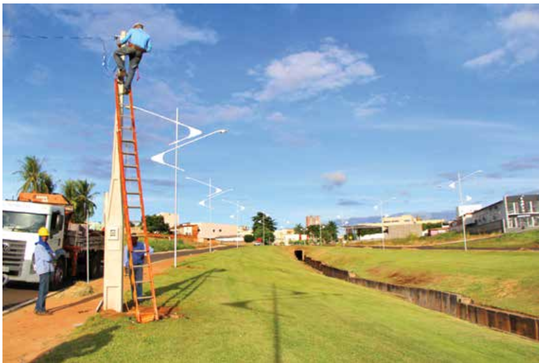
Um investimento de R$ 84 mil da taxa de Contribuição de Iluminação Pública garantiu a execução da obra