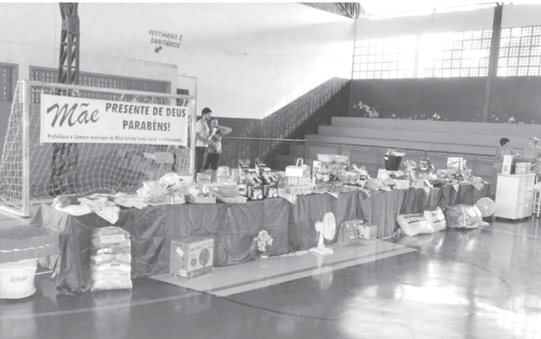
Muita animação, danças e sorteios de brindes de marcaram o evento