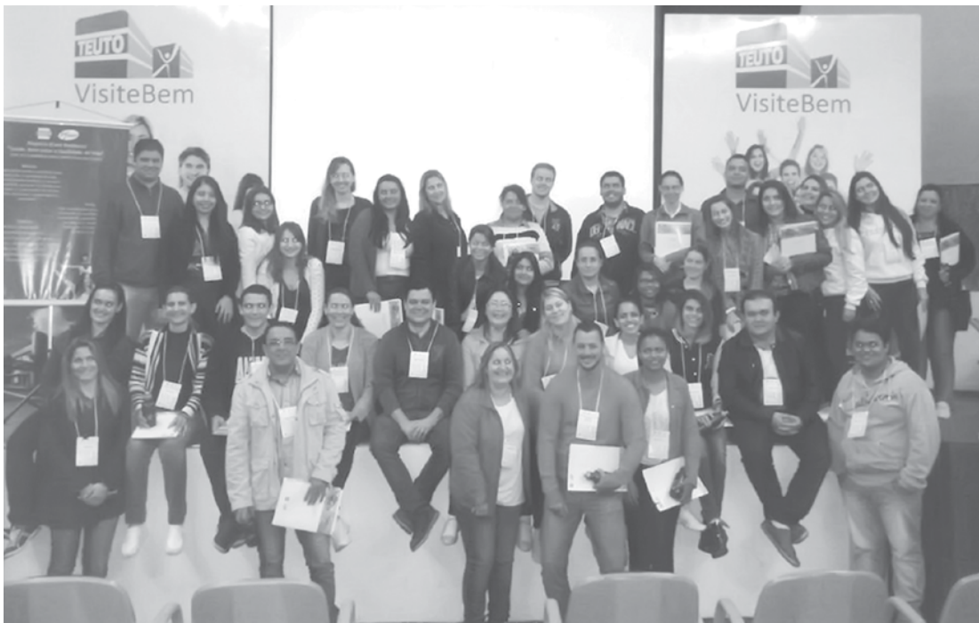
Alunos e professores do curso de Farmácia da FEF durante visita ao laboratório farmacêutico em Anápolis