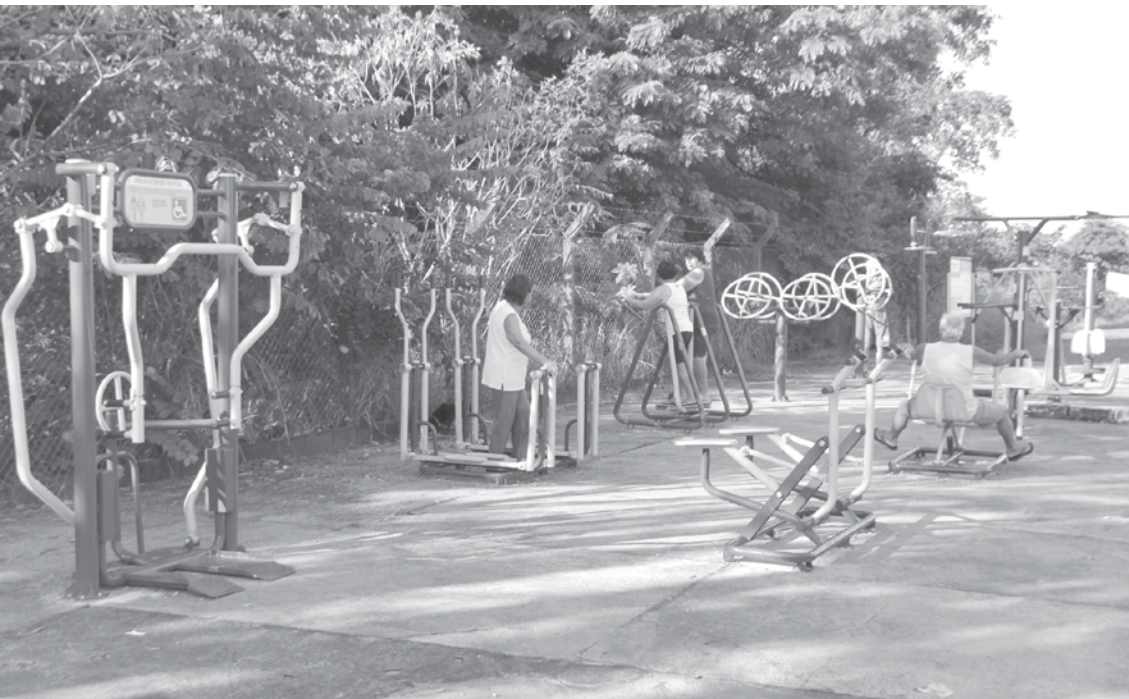
População já utiliza a Academia ao Ar Livre do Jardim Paraíso: as academias são espaços públicos disponíveis para a prática de exercícios e o lazer de toda a comunidade

→ ASSESSORIA DE IMPRENSA Prefeitura de Fernandópolis A Prefeitura de Fernandópolis instalou uma Academia