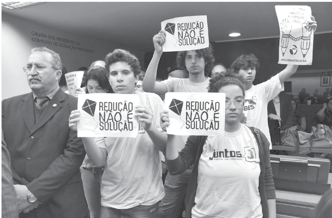
Manifestantes exibem mensagens contrárias à redução da maioridade penal

dos nas ruas de Fernandópolis, implantada em 2005, diminuiu o envolvimento de menores em furtos e lesões corporais. Para o juiz, “o sistema de proteção aos menores envolve uma postura firme do Estado, que tem também função pedagógica”. Sobre sua experiência (com o Toque de Recolher) em Fernandópolis, o juiz contou que os jovens eram recolhidos e encaminhados para o conselho tutelar e depois para suas famílias. Para o magistrado, o trabalho durante sete anos com esses jovens mostrou que eles têm conhecimento pleno do que é certo ou errado. “Muitos adolescentes, especificamente nessa faixa dos 16 anos, têm pleno conhecimento das coisas erradas, principalmente do crime. Muitos desses também atuam corrompendo os mais jovens, trazendo os mais jovens para o mundo das drogas. Eu tive uma experiência pessoal que me levou a robustecer o meu entendimento a respeito da redução da maioridade penal.” Mais de 100 cidades em todo o país adotaram medidas semelhantes. O Toque de Recolher recebeu mais de 80% de aprovação. “Combater o crime não é missão do Judiciário. Porém, com o passar dos anos, notamos que, além da redução de situação de riscos, houve uma queda significativa no nú-