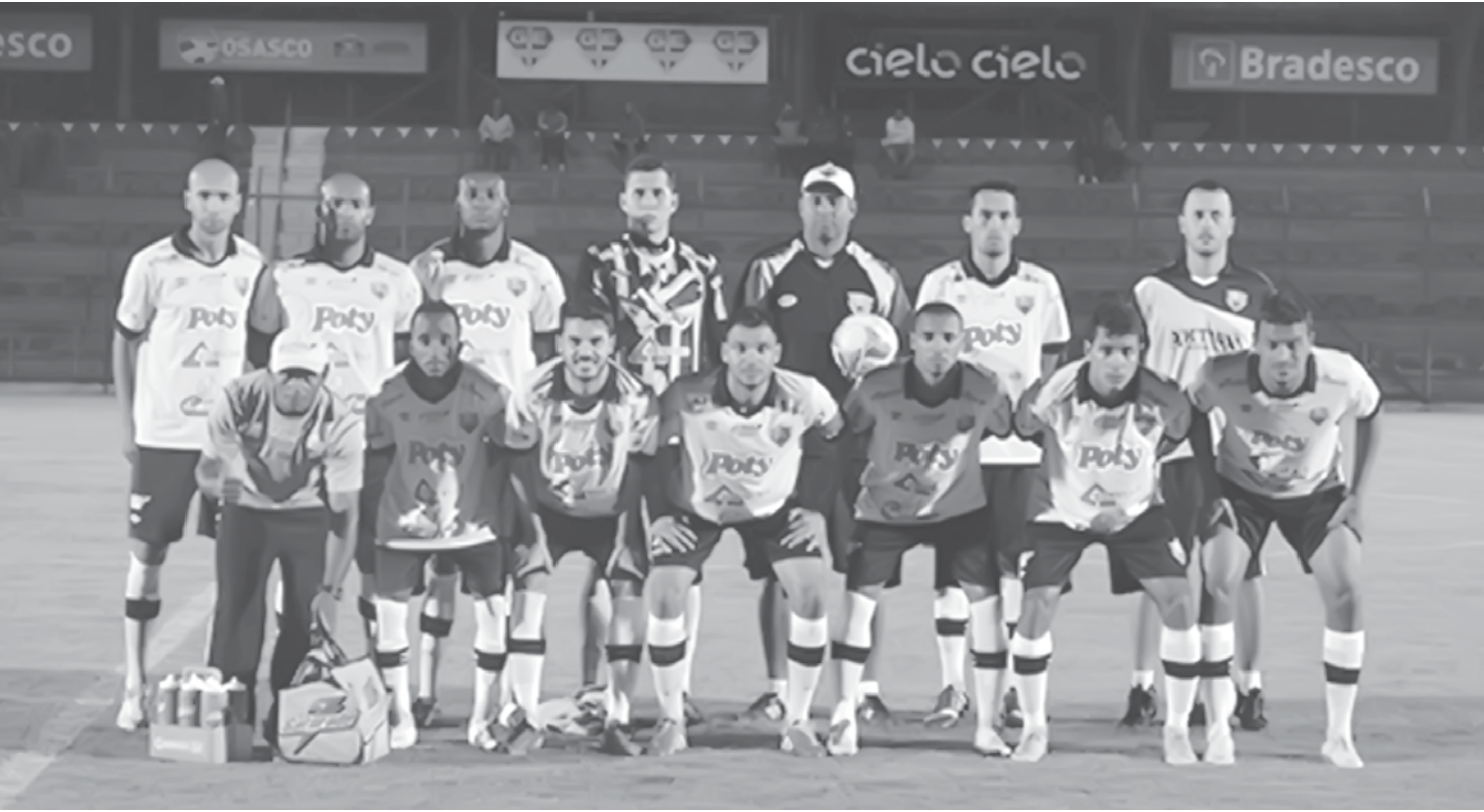
Fundado em dezembro de 2009, o CAV é o terceiro time profissional de Votuporanga

Arquirrival do Fefecê conquista segundo acesso em quatro temporadas