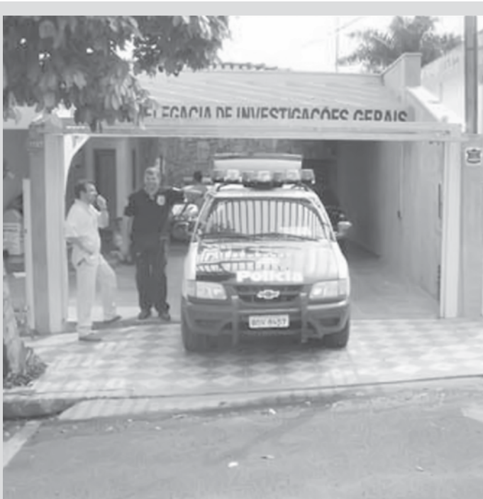
Após registro no Plantão Policial, ocorrência é investigada pela DIG

havam sido furtados um microcomputador e sua carteira contendo documentos pessoais e bancários. A vítima estima prejuízo de R$ 2.500,00. O caso foi registrado no Plantão Policial e posteriormente repassado à DIG (Delegacia de Investigações Gerais), responsável em apurar os fatos. A perícia técnica compareceu em todas as ocorrências e os procedimentos de praxe foram tomados. Até o fechamento desta edição, nenhum suspeito foi preso.