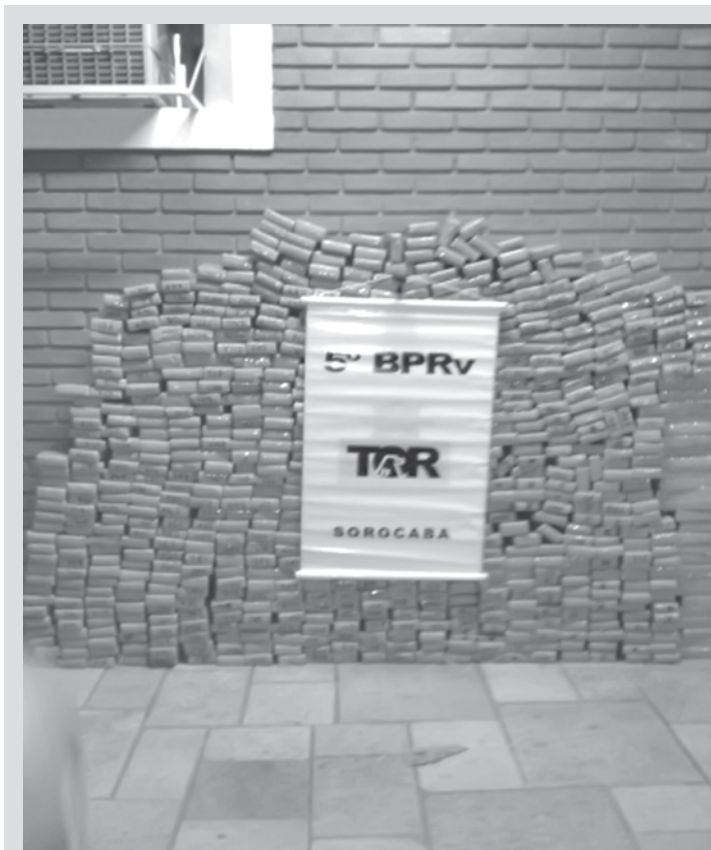
O entorpecente pesou 595,900 Kg e foi encaminhado para perícia