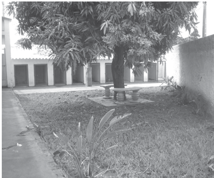
Hotelzinho proporciona maior conforto aos animais atendidos

Empresa oferece um atendimento personalizado e especializado com respeito aos animais