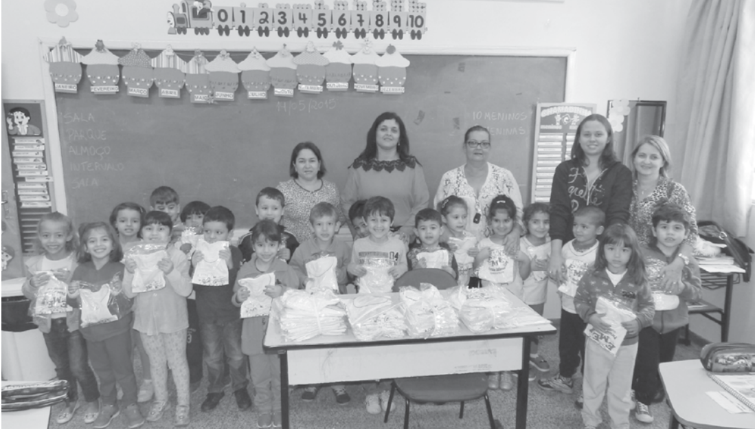
Cerca de 440 alunos da EMEI “Paraíso Infantil” de Ouroeste receberam os uniformes

A entrega foi feita pela Presidente do Fundo Social de