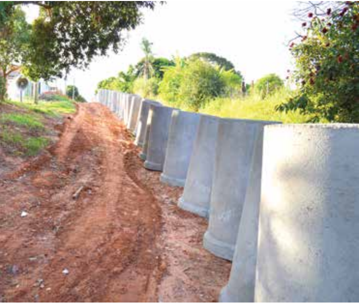
Tudo pronto para a instalação das galerias

Uma pendência de aproximadamente 20 anos entre o Loteador do Bairro Terra das Paineiras e a Prefeitura de Fernandópolis foi resolvida. No acordo firmado entre as partes ficou definido que o loteador fará as galerias de águas pluviais, guias e sarjetas necessárias no bairro. De acordo com o representante da empreiteira responsável pelas obras, se não houver nenhum imprevisto, todo o serviço deve ser concluído no prazo de