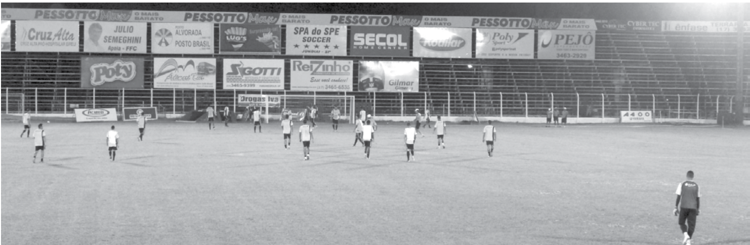
Equipe do Fefecê durante a preparação para o confronto diante do Assisense