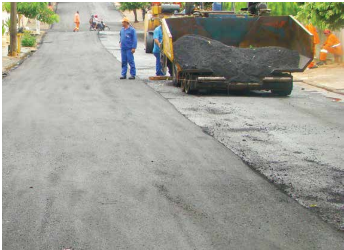
Mais de R$ 289 mil serão investidos no recapeamento de 14 mil m 2 de vias públicas em Fernandópolis

- Trecho 07: Avenida dos Eucaliptos, trecho entre a