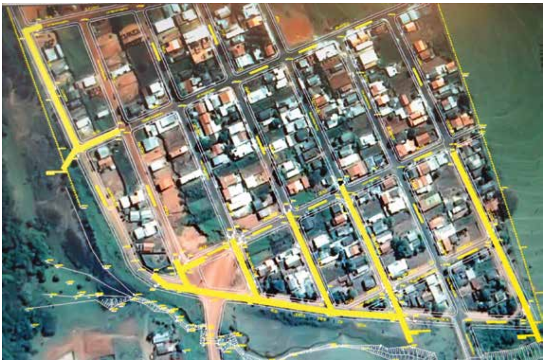
Serviços seguirão cronograma de trabalho já estabelecido

Uma pendência de aproximadamente 20 anos entre o Loteador do Bairro Terra das Paineiras e a Prefeitura de Fernandópolis foi resolvida. No acordo firmado entre as partes ficou definido que o loteador fará as galerias de águas pluviais, guias e sarjetas necessárias no bairro. De acordo com o representante da empreiteira responsável pelas obras, se não houver nenhum imprevisto, todo o serviço deve ser concluído no prazo de