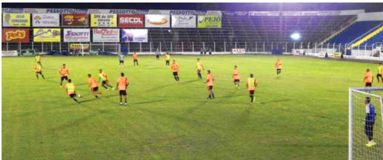
Equipe do Fefecê durante a preparação para o confronto diante do Assisense

Fefecê e Assisense se enfrentam neste domingo (17), às 10h, no estádio municipal Claudio Rodante, em Fernandópolis, em partida válida pela quinta rodada do Campeonato Paulista da Quarta Divisão. As duas equipes perderam na rodada anterior e medem forças buscando a reabilitação na competição. Página A9