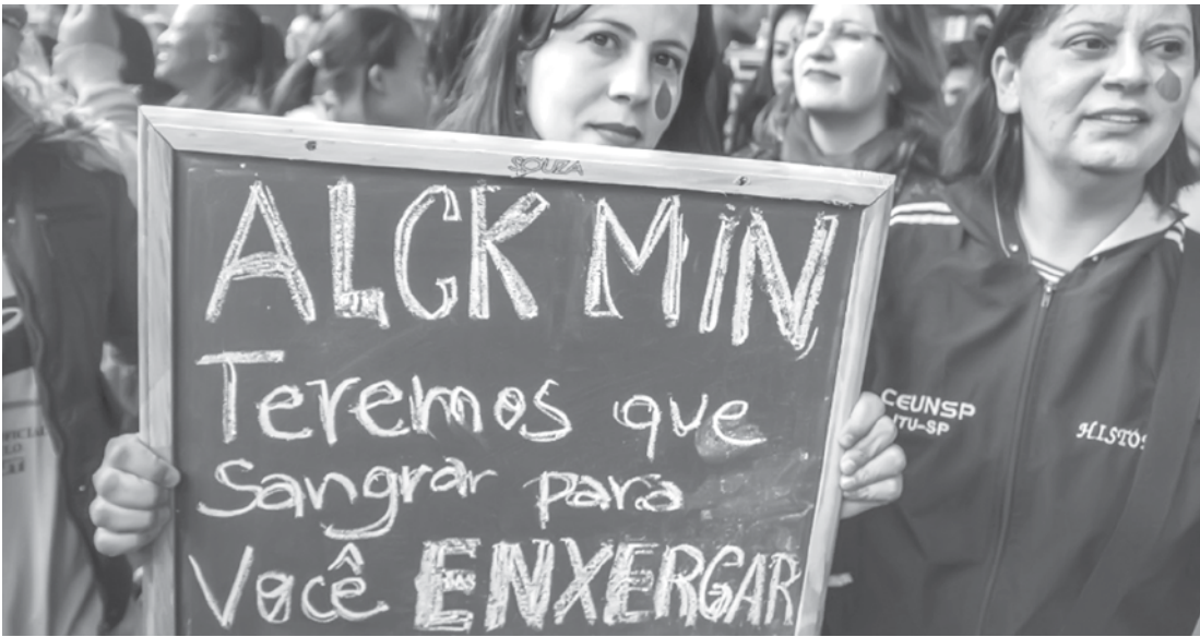
Manifestantes saíram em passeata do vão livre do Masp em direção à sede da Secretaria da Fazenda

pecial do Tribunal de Justiça, o corte de ponto foi proibido, mas cabe recurso. Os professores da rede estadual, liderados pelo Sindicato dos Professores do Ensino Oficial do Estado de São Paulo (Apeoesp), estão em greve desde o dia 16 de março. Eles pedem reajuste salarial de 75,33% para que, segundo cálculo do sindicato, haja equiparação da categoria a outras profissões com ensino superior. A meta é