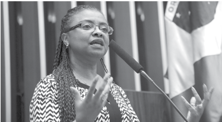
Ministra Nilma discursa durante a comissão geral em Brasília

junto com essa Casa, com os movimentos sociais e os demais ministérios”, disse Nilma Lino Gomes. O deputado Orlando Silva (PCdoB-SP) ressaltou a importância de a Seppir acompanhar os trabalhos da CPI. Na visão dele, o governo brasileiro tem sido omisso em relação ao problema. “No Brasil, o que se vê é uma tolerância do Estado em relação à violência contra os jovens. Esse é um tema decisivo para que o país possa garantir direitos humanos e a vida do nosso povo. O que se faz hoje no Brasil é um verdadeiro genocídio”, disse o deputado. Na comissão geral, a ministra fez um histórico da luta contra o racismo no Brasil, incluindo a criação