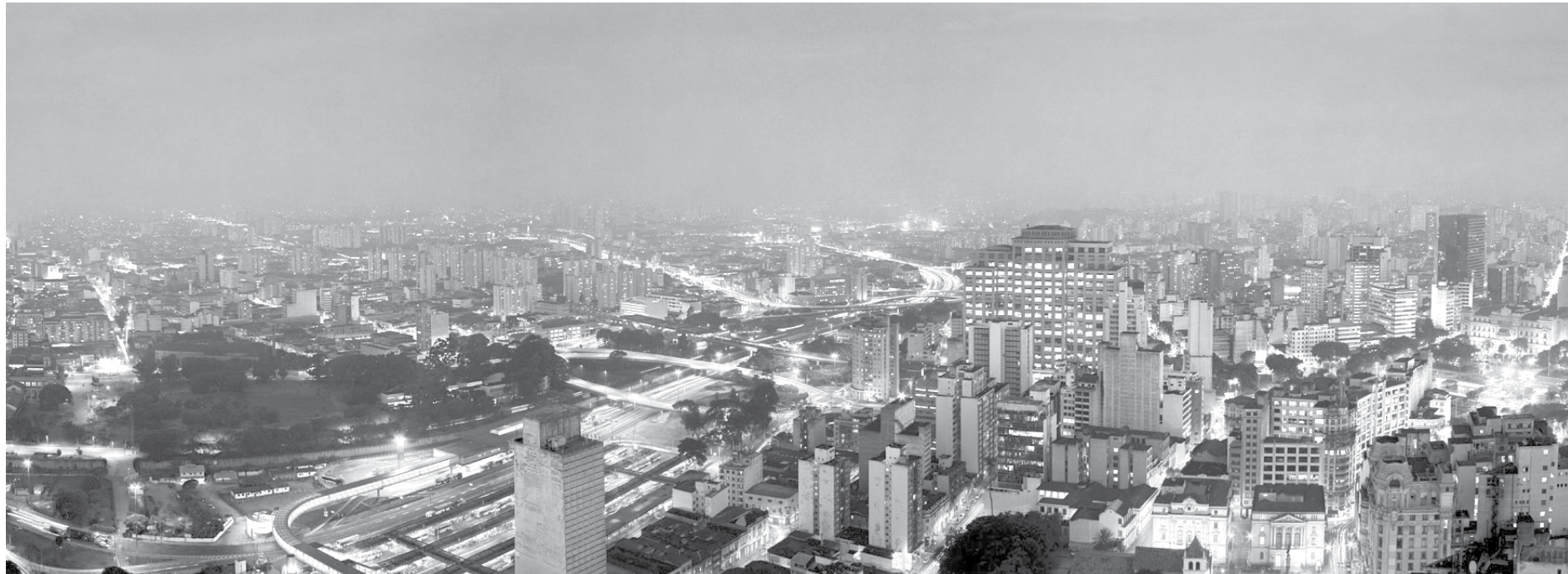
Com a acentuação da crise no início de 2015, a queda da arrecadação no Estado de São Paulo se reflete na retração econômica vivenciada atualmente

Diante da queda na arrecadação provocada por uma retração econômica mais aguda do que no país, o governo Geraldo Alckmin (PSDB) reduziu em 37,5% o ritmo dos investimentos em São Paulo no primeiro quadrimestre deste ano. Na comparação com igual período em 2014, o valor destinado por Secretarias e Estaduais a obras e ampliação de programas no Estado, entre janeiro e abril, caiu R$ 1,5 bilhão, segundo dados da Secretaria de Planejamento. Todos os valores foram corrigidos pela inflação. O governo Alckmin alega que “os cenários econômicos dos períodos comparados são bastante diferentes” e que por causa do “alto risco de frustração da meta de arrecadação” optou pela “prudência na gestão fiscal e adotou medidas preventivas”, no caso, um contingenciamento de R$ 6,6 bilhões, ou 3,2% do orçamento total, “com vistas a garantir o equilíbrio das contas públicas”. A redução de R$ 4 bilhões para R$ 2,5 bilhões no valor investido no primeiro quadrimestre tem impacto em várias ações do governo, como construção de escolas técnicas, dupli-