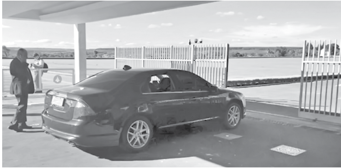
Carro com o ministro Joaquim Levy chega ao Palácio da Alvorada neste domingo

to para tentar reequilibrar as contas da União. Neste cenário, ressalta o ministro da Fazenda, recomenda-se um aprofundamento do corte de despesas. Por outro lado, ministros da área política e líderes governistas querem que, em vez de apertar ainda mais o ajuste fiscal, Levy apresente medidas para animar a economia brasileira sem depender exclusivamente de cortes no Orçamento. Os ministros políticos com assento no Palácio do Planalto têm uma preocupação adicional com