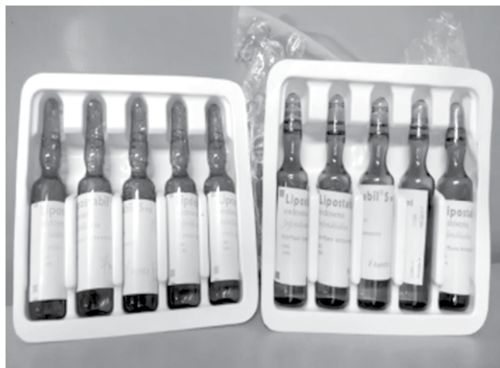
Os medicamentos de uso controlado eram vendidos irregularmente pela mulher na internet