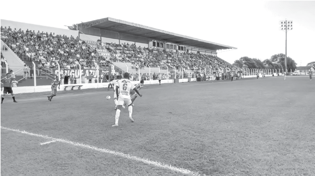
Diante de um bom público, times criam poucas chances e ficam no 1 a 1; confira a classificação abaixo

O próximo jogo do Fefecê (3º) será contra o Osvaldo Cruz (4º), também dia 31, às 10h, na casa do adversário. Ambos têm 8 pontos. Já o Tanabi receberá o Assisense, no mesmo dia e horário.