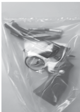
Um revólver de calibre 38 foi apreendido pela Polícia