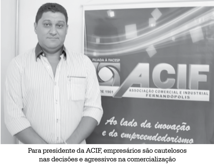
Para presidente da ACIF, empresários são cautelosos nas decisões e agressivos na comercialização

→ Da REDAÇÃO contato@oextra.net Conforme divulgado na última sexta-feira (22), pelo Ministério do Trabalho, o Cadastro-Geral de Empregados e Desempregados (Caged) registrou em abril um declínio de 0,24% no estoque de empregos formais no país, o que representa uma redução de 97.828 postos de trabalho, resultado de 1.527.681 admissões contra 1.625.509 desligamentos. Embora os dados da pesquisa sejam negativos na região, Fernandópolis vem na contramão, com resultados bastante satisfatórios em relação às cidades vizinhas. No último mês de abril, segundo a pesquisa, o município gerou 265 postos de trabalho. Ainda de acordo com os dados, a indústria é um dos setores que mais abre vagas de trabalho, empregando 227 trabalhadores. Em Votuporanga, foram 529 postos de trabalho fechados nos últimos quatro meses, já na cidade de Jales, neste mesmo período, foram fechadas 72 vagas. A pesquisa mostra ainda que São José do Rio Preto, principal cidade da nossa região, contabiliza 325 novos empregos nos primeiros quatro meses de 2015, o que representa 914% a menos que o mesmo período do ano passado, quando foram gerados 2.971 novos empregos.