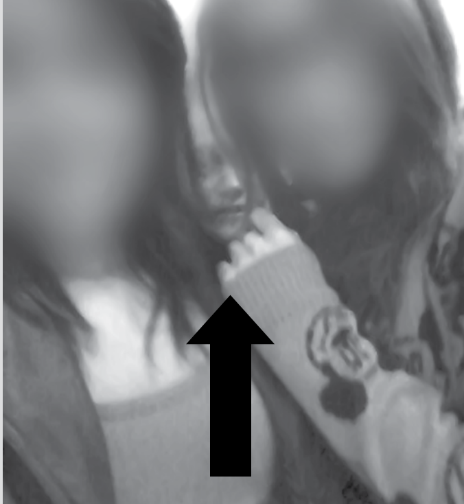
Selfie tirado no pátio da igreja evangélica: destaque para a imagem que aparece no meio das garotas

Garotas tiraram foto no pátio da igreja e assustaram ao ver o registro; assunto ganhou destaque nas redes sociais