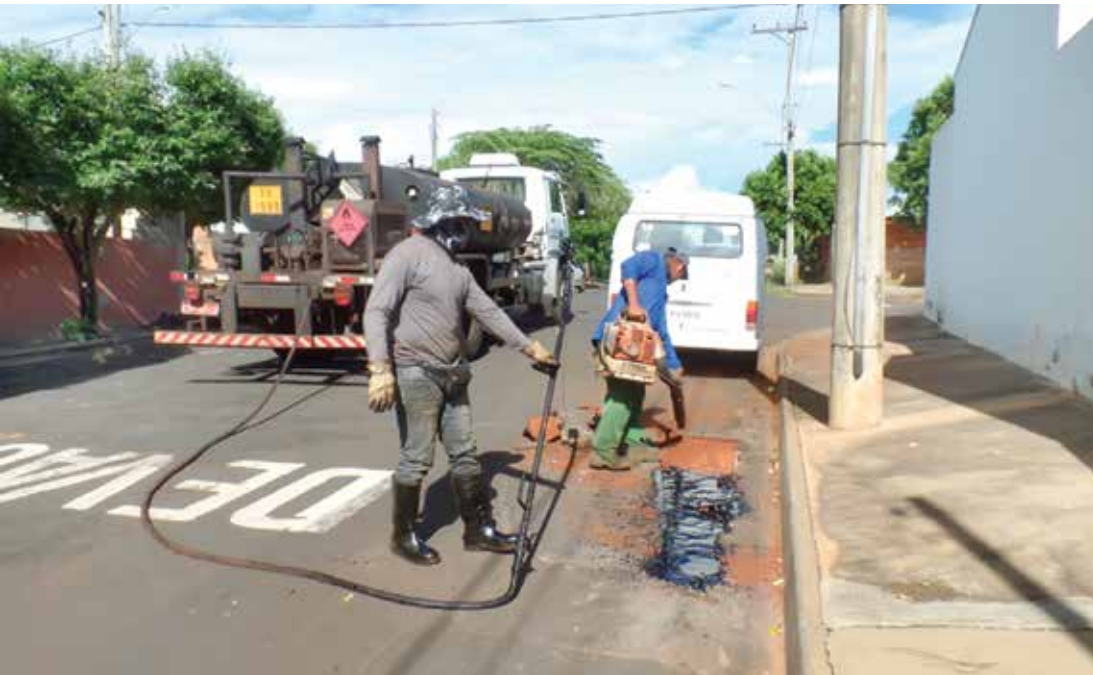
Equipe realiza serviços de tapa-buraco na Brasilândia