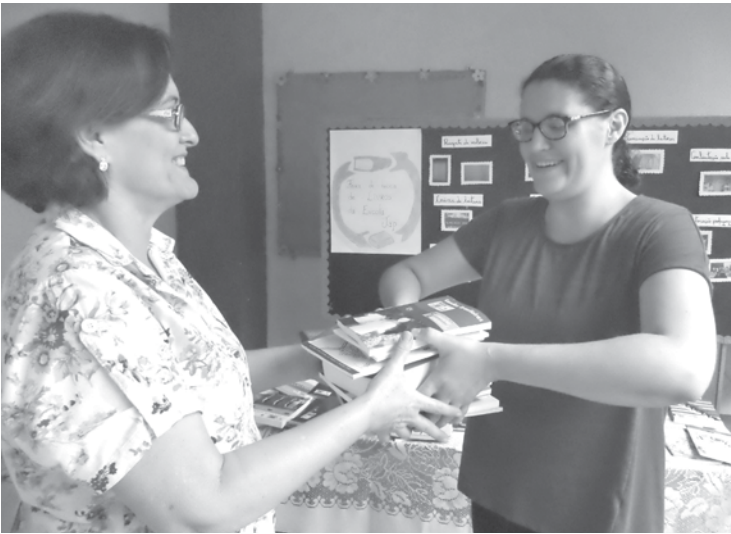
Evento foi realizado no pátio da escola