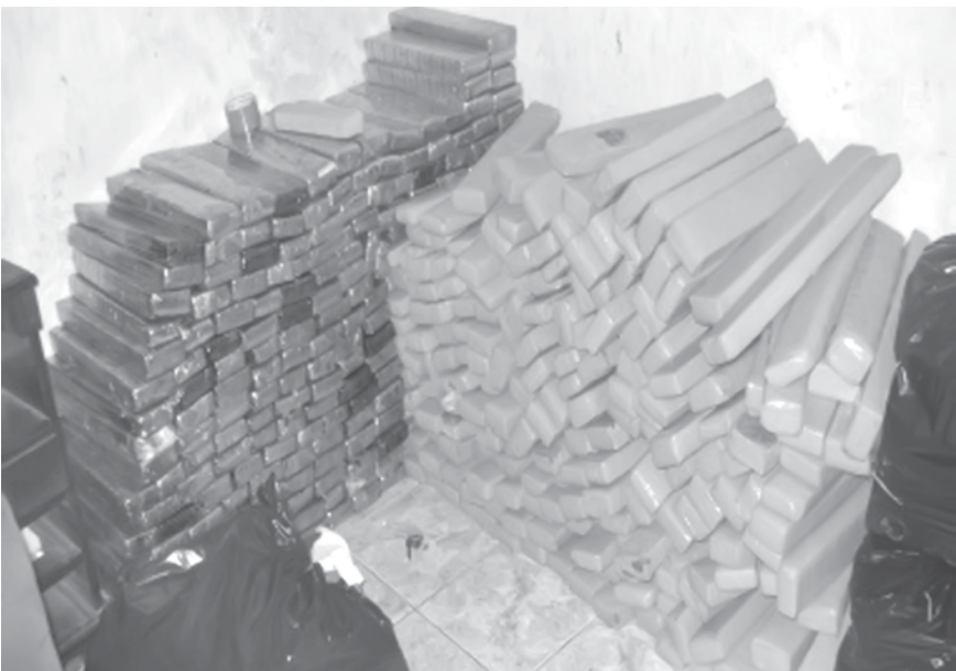
O entorpecente apreendido pesou 632,8 quilos

me apurado pelos policiais militares, moram no local dois homens responsáveis pela distribuição de drogas no bairro. Os objetos e o entorpecente foram enviados à perícia do Instituto de Criminalística (IC). O caso foi registrado no 98º Distrito Policial (Jardim Miriam) como drogas sem autorização ou em desacordo. Um homem está sendo averiguado. A Polícia Civil prossegue com as investigações.