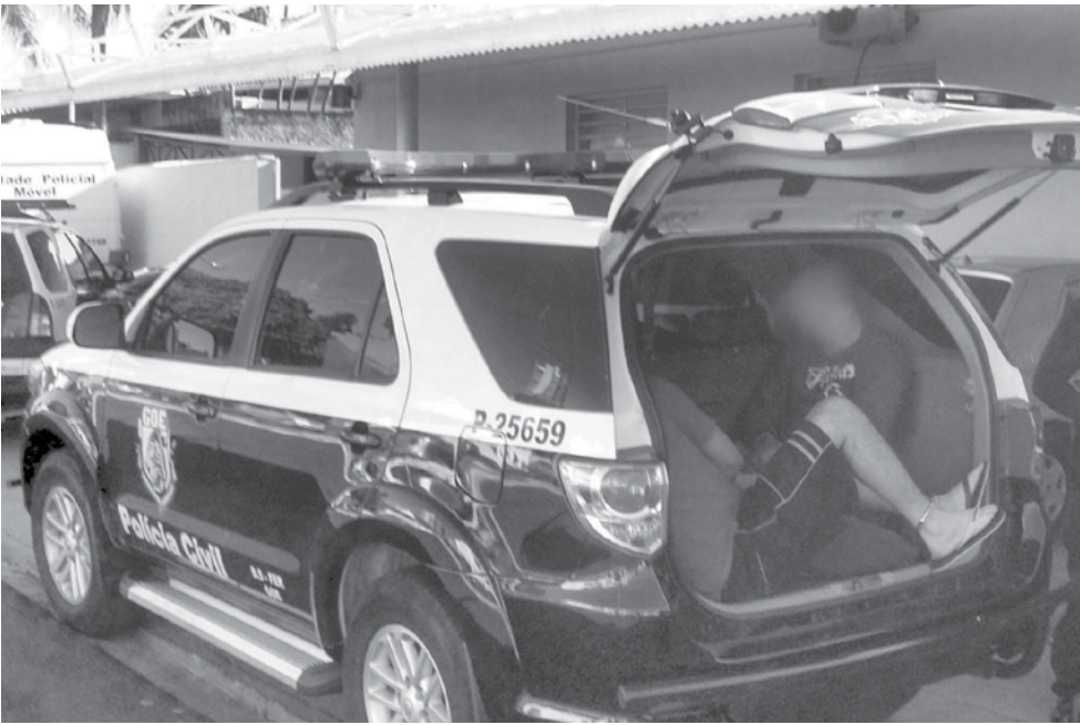
Os acusados foram apresentados na tarde de ontem na Delegacia Seccional de Fernandópolis

De acordo com a Seccional de Fernandópolis, as prisões foram um desdobramento da operação que ocorreu em 9 de abril deste ano, quando cinco integrantes da quadrilha foram presos quando se reuniam em Sumaré e se preparavam para uma nova ação criminosa. Naquela ocasião, foram apreendi-