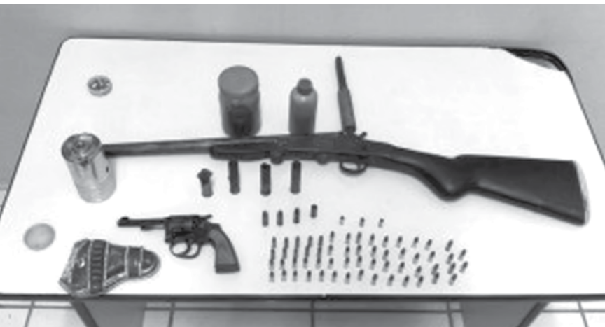
Armas e munições apreendidas com o sitiante preso em flagrante

→ Da REDAÇÃO contato@oextra.net A equipe de Rocam (Ronda Ostensiva com o Apoio de Motocicletas) apreendeu armas e munições no início da noite desta segunda-feira (25), em uma propriedade rural no município de Votuporanga. Durante a ação policial, que contou com apoio da Polícia Ambiental, um sitiante acabou detido e conduzido ao Plantão Policial. De acordo com informações da PM, em patrulhamento da Rocam, a equipe foi informada via CAD (Centro de Atendi-