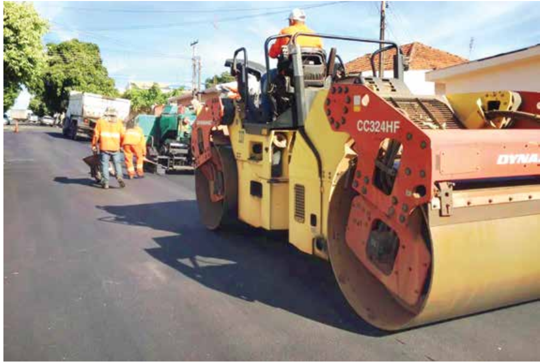
Recapeamento é realizado nesta semana no Bairro Coester

em duas etapas. Na primeira, a empresa fará os serviços nos buracos maiores, e na segunda, na próxima semana, a equipe da Secretaria Municipal de Infraestrutura atenderá os menores. Já a equipe de infraestrutura da Prefeitura está trabalhando no Residencial Ilda Helena, também realizando o serviço de tapa-buraco em diversas vias. “O objetivo é intensificar as ações para manter as ruas em boas condições, conferindo mais segurança para motoristas e pedestres”, explica o secretário de Infraestrutura, Osmar Guirelli. O cronograma elaborado pela equipe atenderá diferentes pontos da cidade.