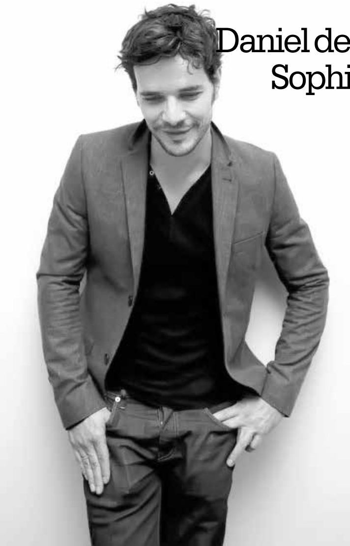
Daniel de Oliveira conta detalhes sobre o pedido de casamento a Sophie Charlotte