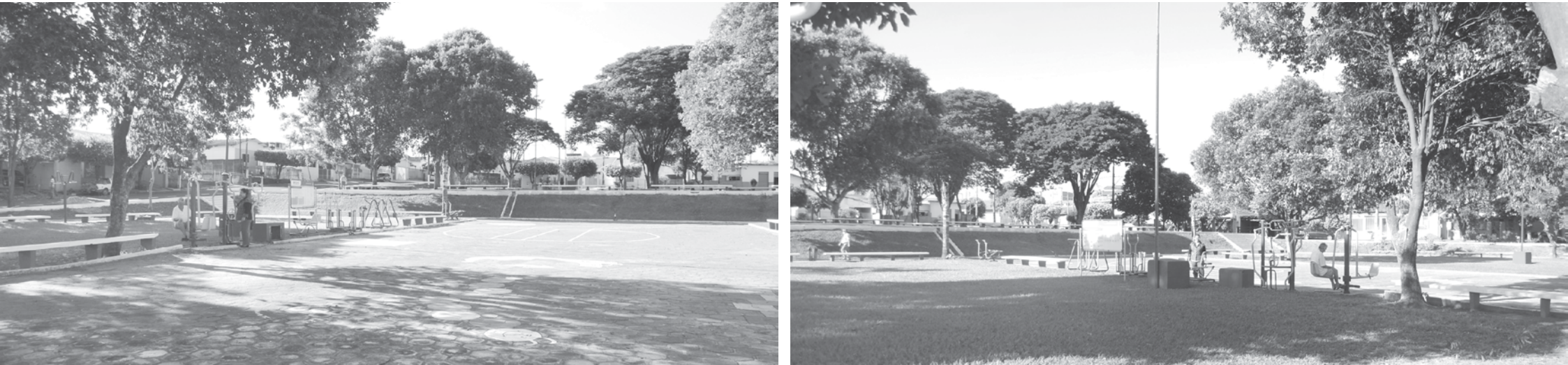
Praça está revitalizada e com Academia a Céu Aberto