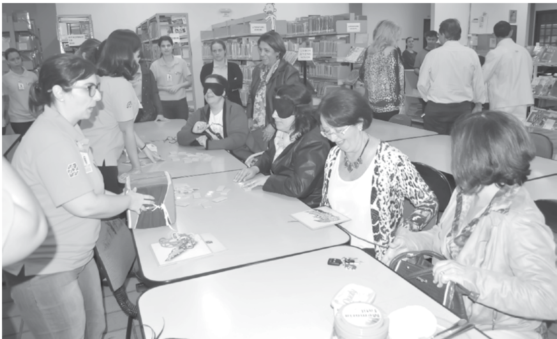
Atividades com ferramentas específicas dimensionam o mundo das pessoas com deficiência

tra, há equipamentos que demonstram os caminhos da pessoa com deficiência, bem como as perspectivas de reabilitação e, principalmente, as possibilidades de inclusão social, acessibilidade e inclusão no mercado de trabalho. O “Memorial” permanecerá exposto à visitação pública, gratuitamente, até o dia 12 de junho, no horário de funcionamento da biblioteca (das 8 às 19 horas).