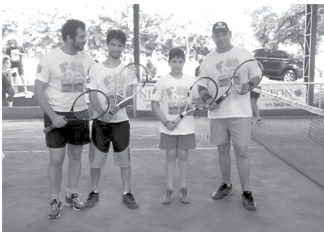
Participantes e os realizadores do torneio de tênis durante as premiações na Chácara Bim