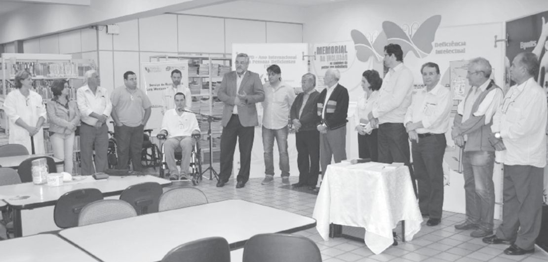
Autoridades, agentes de saúde, pacientes e familiares marcaram presença na inauguração da mostra “Memorial da Inclusão”, na Biblioteca Municipal de Fernandópolis