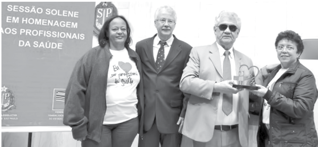
Homenagem aos profissionais da Saúde ocorreu durante solenidade na Assembleia Legislativa

Nos dias 27 e 28 de maio, a Secretaria da Saúde e o Conselho Municipal da Saúde promoveram a 5ª Conferência da Saúde, com o tema “Saúde Pública de Qualidade para Cuidar Bem das Pessoas: Direito do povo Brasileiro”. O Hospital de Ensino Santa Casa de Fernandópolis