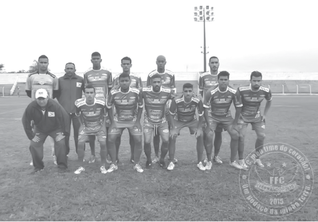
Fefecê espera surpreender o América e voltar para Fernandópolis com os 3 pontos