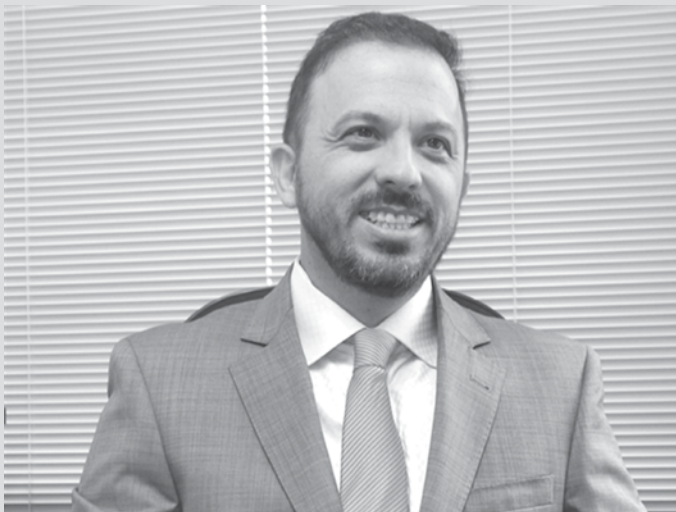
Pelarin volta a Fernandópolis para falar sobre a Redução da Maioridade Penal

O encontro terá início às 20h30, no Rotary Clube 22 de Maio, localizado na Avenida Brasília, em frente à Cozinha Piloto.