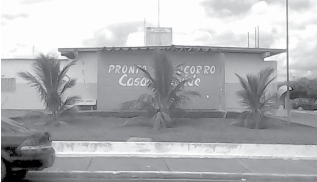
Esclarecimentos solicitados pelo presidente da Câmara devem acontecer durante a próxima semana