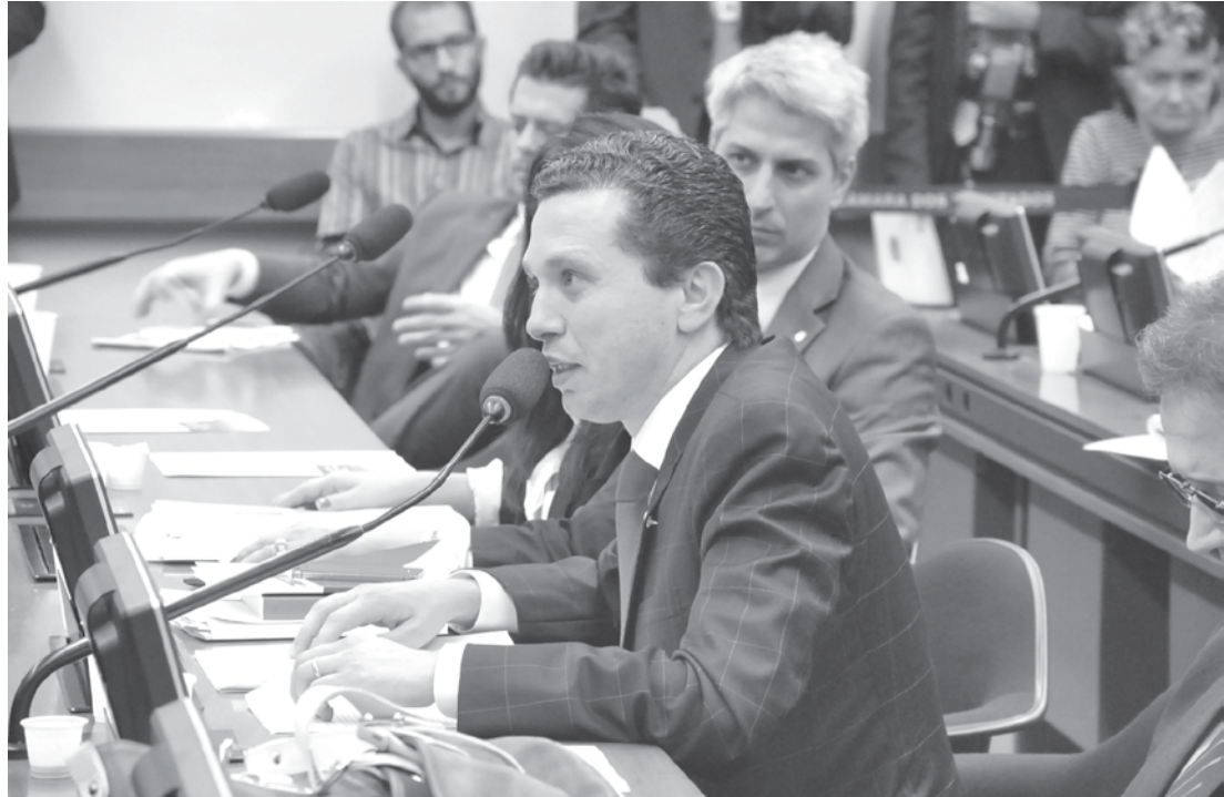
Deputado federal Fausto Pinato em atuação na Capital Federal: "união política é sempre positiva"

De acordo com o projeto, a gratificação por ofício será concedida para o defensor que acumular mais de uma área por período superior a três