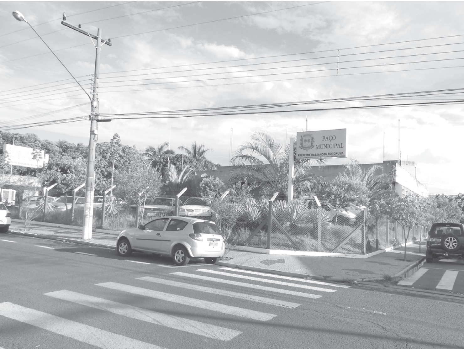
Paço Municipal, sede do Poder Executivo de Fernandópolis: Edital do Concurso Público começará em breve a ser elaborado

O total de vagas também prevê número suficiente de candidatos aptos a compor cadastro de reserva, além dos aprovados que assumirão os cargos assim que homologado o resultado final do concurso deste ano