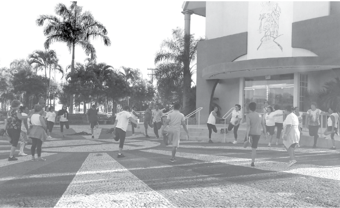
O objetivo principal do grupo de caminhadas é a promoção da saúde: “física e mental”