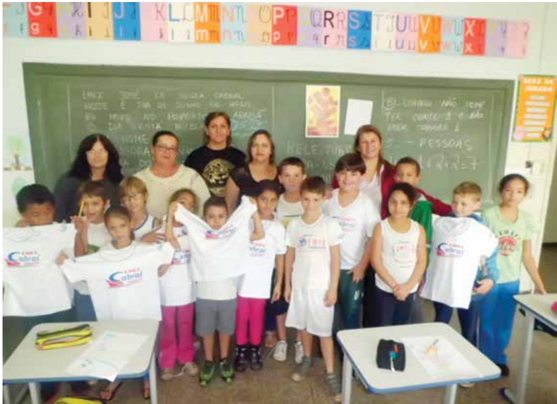
Cerca de 165 alunos da rede municipal de ensino, da Escola José de Souza Cabral e EMEI “Olga”, de Arabá, receberam os uniformes gratuitamente

cebido em Ouroeste uma atenção especial da administração municipal.