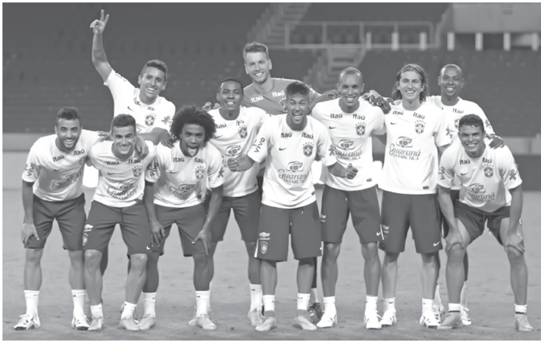
Seleção treina para a estreia na Copa América no Chile

Na Copa América, as 12 seleções estão distribuídas em três grupos. Passam direto para as quartas de final os dois primeiros colocados. Os dois melhores terceiros colocados também seguem na competição. No Grupo A estão Chile, México, Equador e Bolívia. Na chave B, se enfrentam Argentina, Uruguai, Paraguai e Jamaica; enquanto que no Grupo C, o Brasil está acompanhado por Colômbia, Peru e Venezuela. A competição é realizada a cada dois anos, e não influencia as