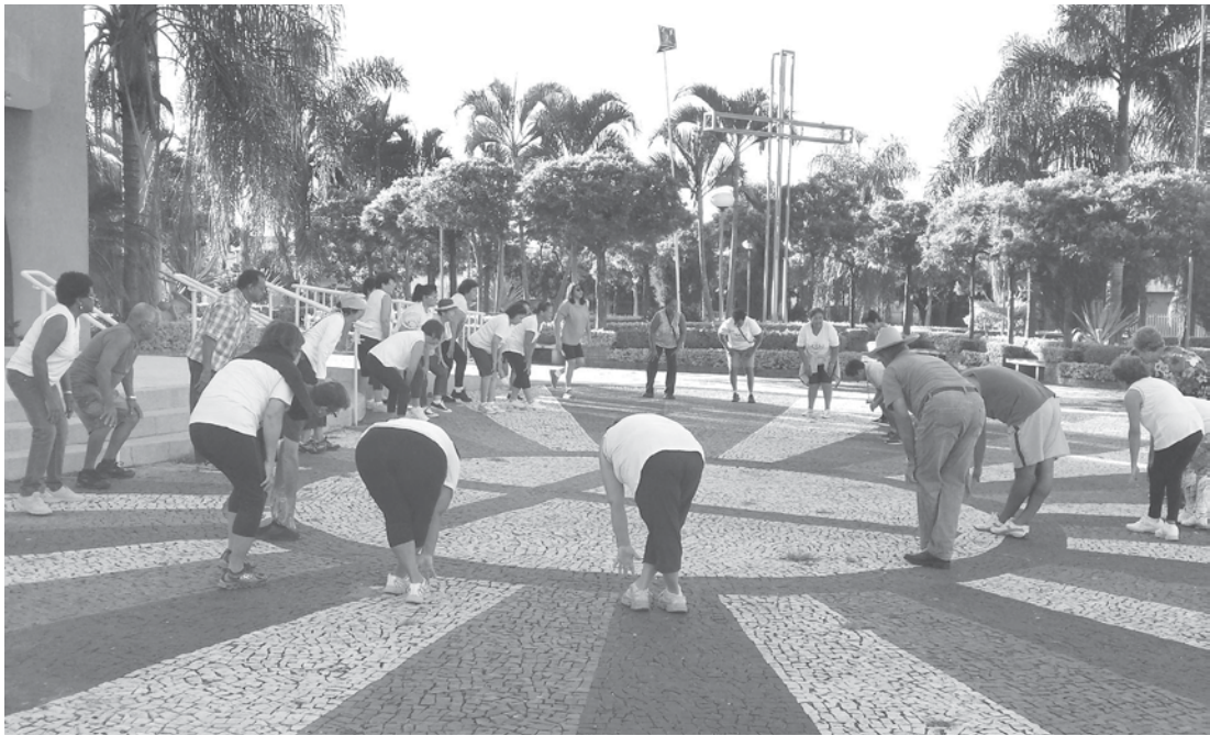
As atividades físicas são realizadas todas as segundas, quartas e sextas feiras, às 7 horas da manhã, com saída de frente a Igreja Matriz de Ouroeste