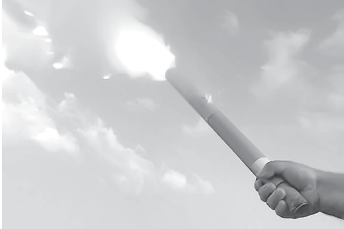
Fogos de artifício devem ser manuseados com cuidado