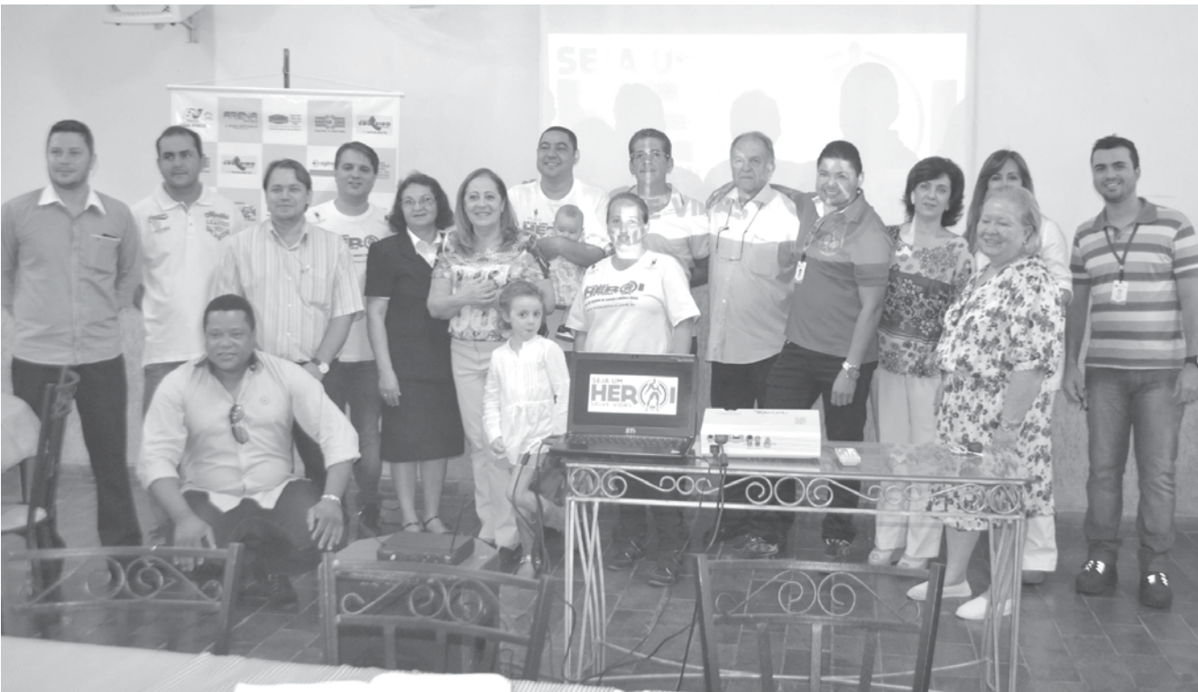
Convidados participaram de um café da manhã e conheceram com detalhes o novo site

para divulgar nossas campanhas e para sensibilizar as pessoas sobre a importância de ser um doador de sangue e medula óssea. Acompanhei de perto, durante anos, a luta de uma pessoa que necessita de doadores e mesmo hoje meu filho não estando mais ao nosso lado, quero continuar lutando nessa importante batalha para ajudar as pessoas que precisam. São gestos simples, porém muito nobres e que podem salvar vidas.” comentou. A página virtual será um informativo, contendo ainda testemunhos e relatos de pessoas que necessitam de doações, pessoas que já doaram e também aqueles que venceram doenças temíveis, esclarecendo quem pode doar e os procedimentos da doação. Todos podem acessar o novo site e se manter informados, participe, clique: www.sejaumheroi.com.br