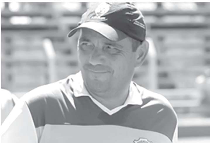
Betão espera conseguir ajustar o time antes da próxima rodada do Estadual