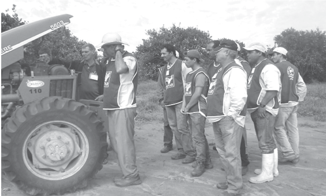
Curso de Operação e Manutenção de Maquinários Agrícolas

sobre maquinário agrícola cresce cada vez mais no município e as vagas são bastante disputadas e limitadas. Maiores informações 17 – 3442 2860. Os cursos ministrados na cidade pelo SENAR são gratuitos, contam com instrutores altamente capacitados, além de serem acompanhados de alimentação, apostilas, certificados de conclusão e a infraestrutura oferecida pelo Sindicato Rural de Fernandópolis.