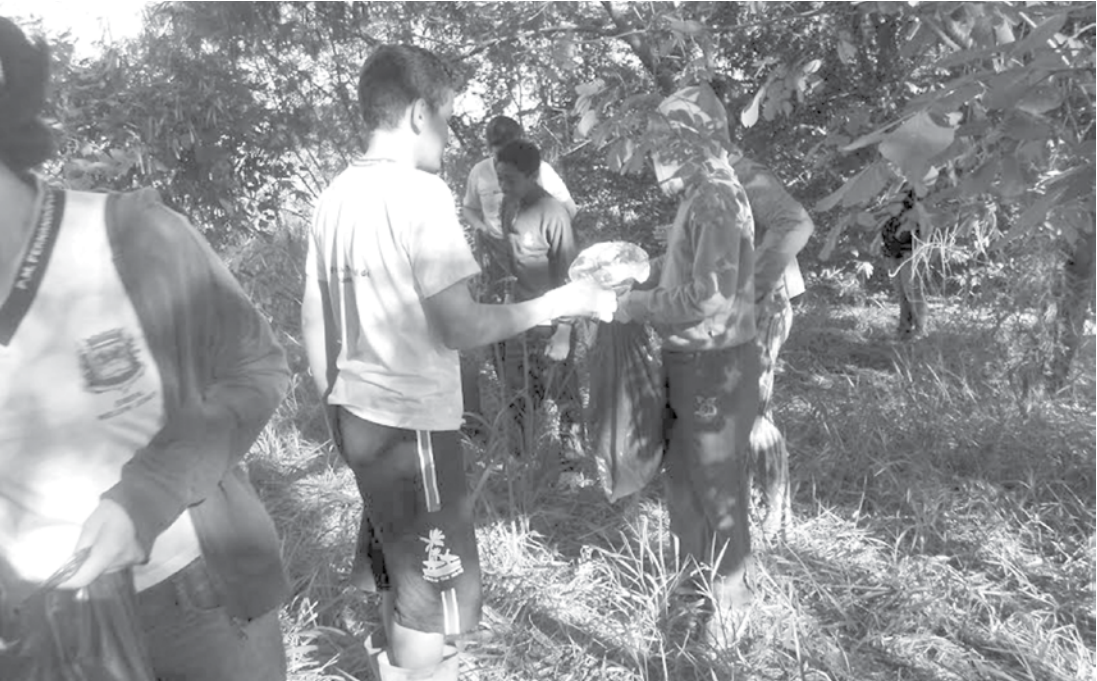
O mutirão de limpeza no Ribeirão Santa Rita também fez parte da programação da Semana do Meio Ambiente