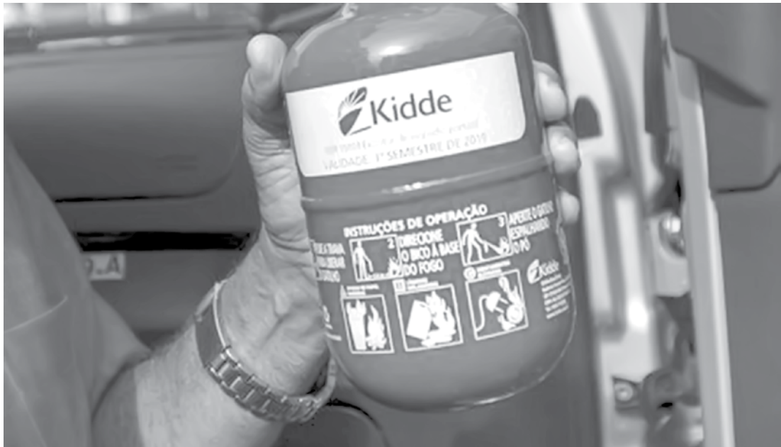
Quando a nova portaria entrar em vigor, circular sem o extintor ABC será infração grave, com multa de R$ 127,69 e cinco pontos na carteira de habilitação

Quando a nova portaria entrar em vigor, circular sem o extintor ABC será infração grave, com multa de R$ 127,69 e cinco pontos na carteira de habilitação. O equipamento deverá ser usado em automóveis de passeio, utilitários, caminhonetes, caminhão, trator, micro-ônibus, ônibus e triciclo automotor de cabine fechada. O referido extintor apaga incêndios em materiais sólidos como pneus, estofamentos, tapetes e revestimentos.