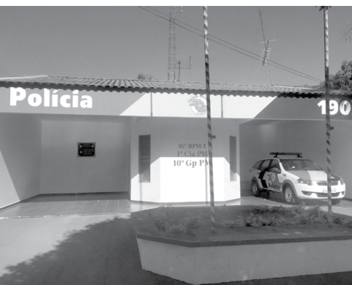
A PM de Ouroeste tem intensificado seu trabalho de patrulhamento no combate ao uso de drogas em locais públicos

nar” o local, porém, foram todos abordados. No local, os policiais encontraram 4 porções de maconha. Um dos menores assumiu ser responsável por uma das porções. Os outros negaram que a droga pertencia a eles. Diante do ocorrido todos foram encaminhados à delegacia, onde foram autuados por porte de entorpecentes. Após o registro da ocorrência foram liberados.