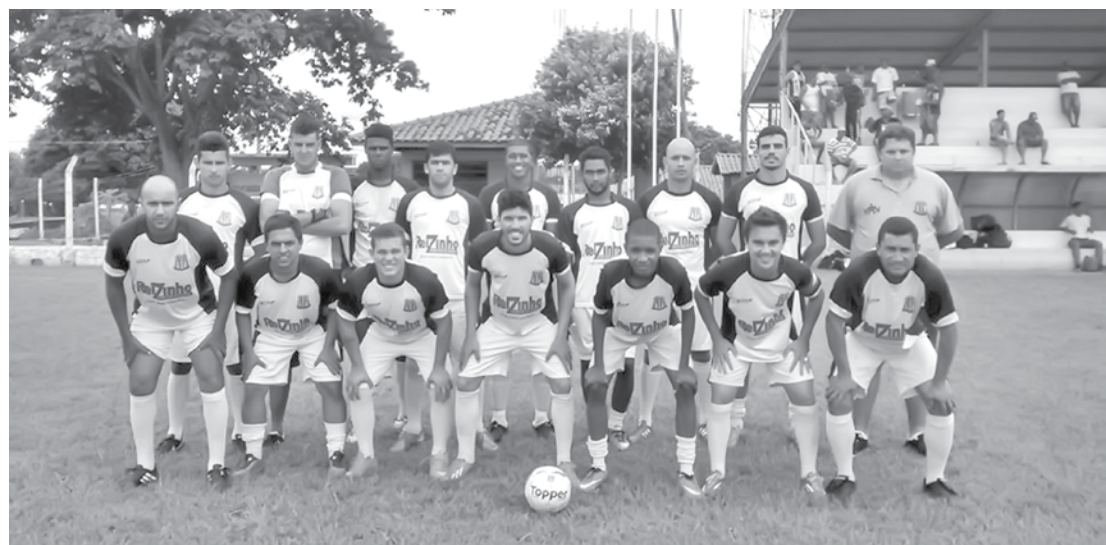
Jogadores e equipe técnica que integram o Clube Esportivo de Ouroeste

Preto. O jogo vale vaga para a próxima fase da competição. Haverá ônibus para o transporte de torcedores a partir das 13 horas, com saída da Praça da Matriz de Ouroeste.