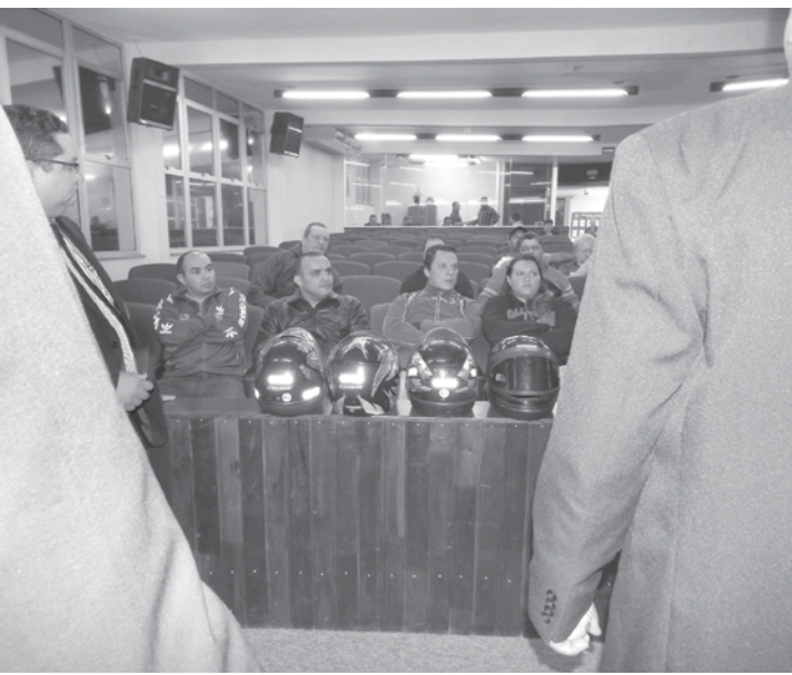
Mototaxistas compareceram em peso à Câmara Municipal