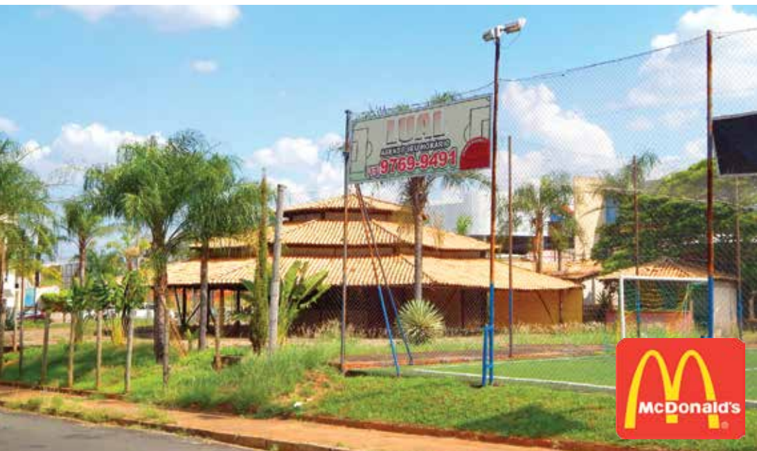
Vista do imóvel que será demolido para a construção do McDonald's; campinho ao lado será mantido

A inauguração está prevista para o segundo semestre deste ano: lanchonete entrará em funcionamento entre setembro e outubro