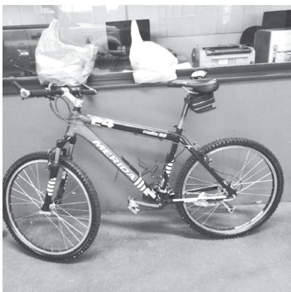
Momento em que adolescente é flagrado pela câmera de segurança; ao lado, bike recuperada