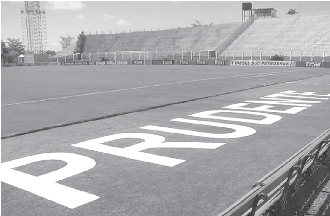
Prudentão: Grêmio e Fefecê se enfrentam em palco conhecido por receber grandes clássicos do futebol brasileiro

“Será uma partida difícil tanto para nós quanto para eles, já que confio muito no meu grupo. Pelo pouco que estou vendo, os jogadores estão focados e sabem o que