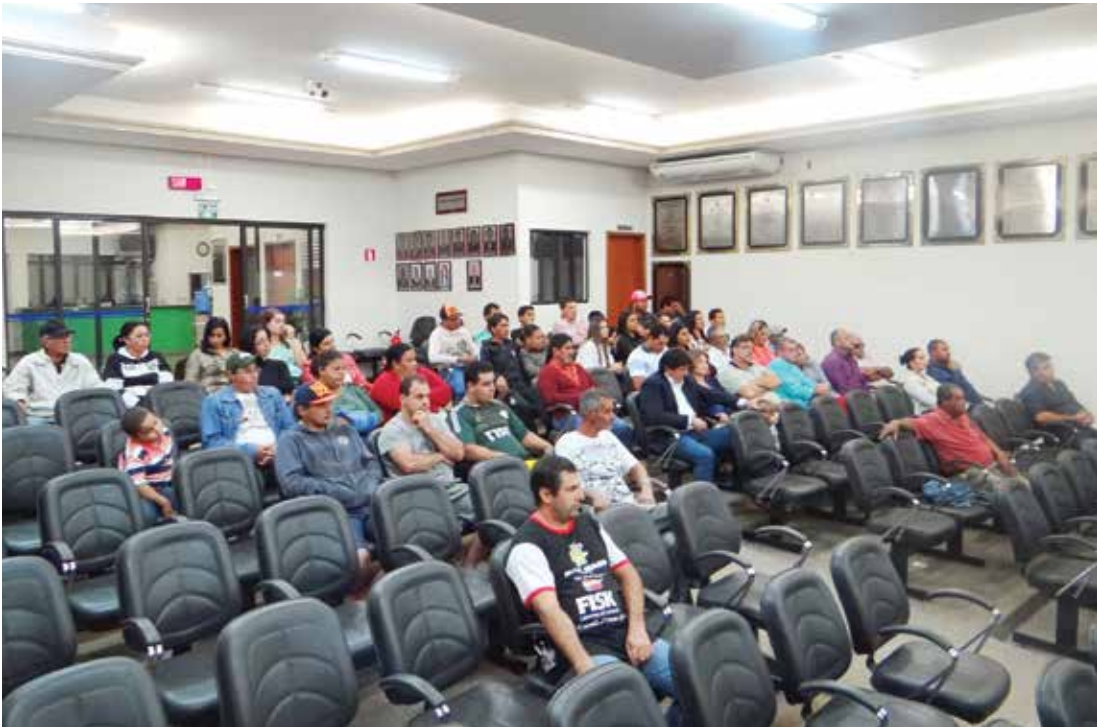
Durante a sessão, foram aprovados três Projetos de Lei de autoria do Poder Executivo

período de afastamento. Ele disse que alguns nem voltam por não ter como pagar. “Faço um apelo aos responsáveis para reformularem as Leis do Fundo e ver a possibilidade de reunir vereadores, prefeito e o presidente da Previdência, para que possamos analisar a possibilidade dos funcionários pagarem com seu próprio salário,