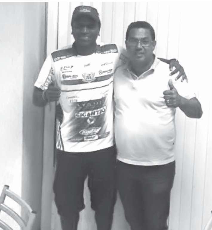
De acordo com a diretoria, Abuda será inscrito no Paulista caso o Fefecê se classifique à segunda fase

Jogador já chegou a Fernandópolis e treinou com o elenco do Fefecê na manhã de ontem no municipal Claudio Rodante; reforço ainda não tem data para estreiar