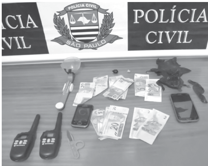
Dinheiro e material utilizado no tráfico foram apreendidos pela Polícia Civil

A perícia técnica compareceu e todos os procedimentos de praxe foram tomados. As causas do acidente são investigadas pela Polícia.