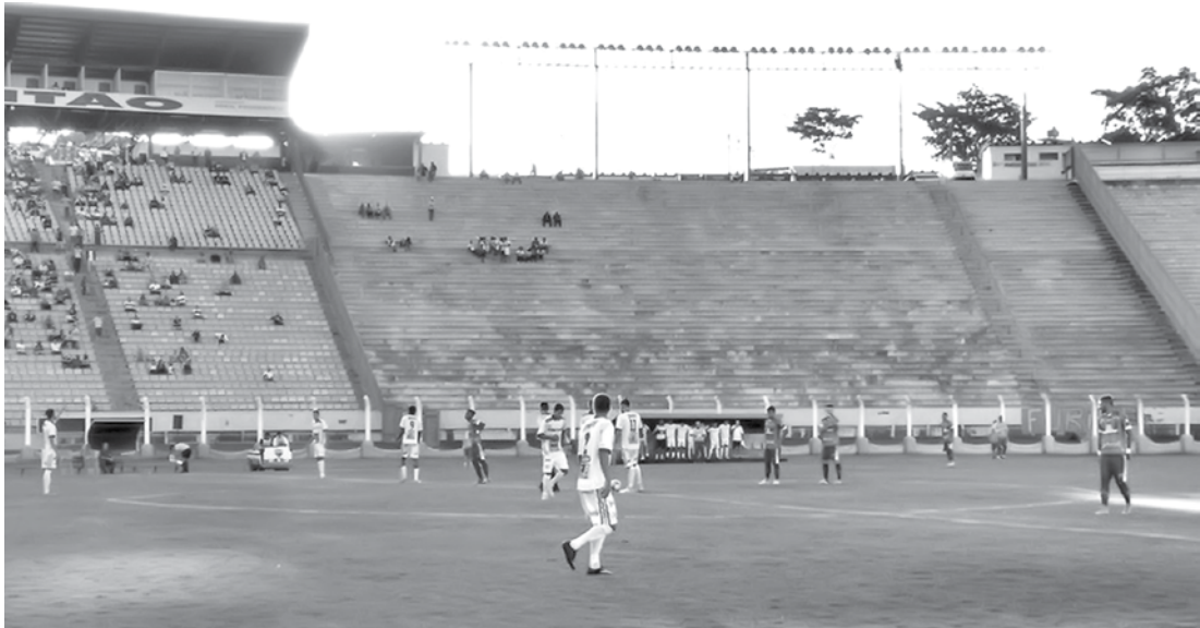
Mesmo com algumas tentativas, equipes não balançaram as redes

Na décima primeira rodada, o Fefecê recebe, no estádio Claudio Rodante, o Noroeste. A partida está marcada para sexta-feira (26), às 20h30. O Grêmio Prudente, por sua vez, viaja até Tanabi para enfrentar os donos da casa no domingo (28), às 10h, no estádio Pref. Alberto Victolo.