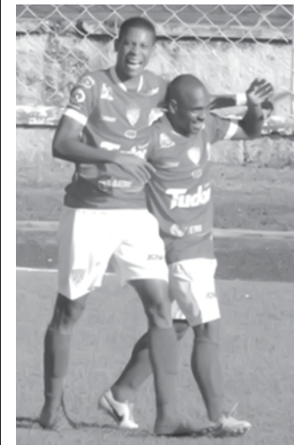
Noroeste promete dificultar a vida do Fefecê no Claudio Rodante

O Fefecê está em quinto lugar no Grupo 1 do Paulista, com 13 pontos ganhos. Para se classificar para a segunda fase, o time precisa ficar entre os quatro primeiros colocados. O quarto atualmente é o Assisense, com 16 pontos.