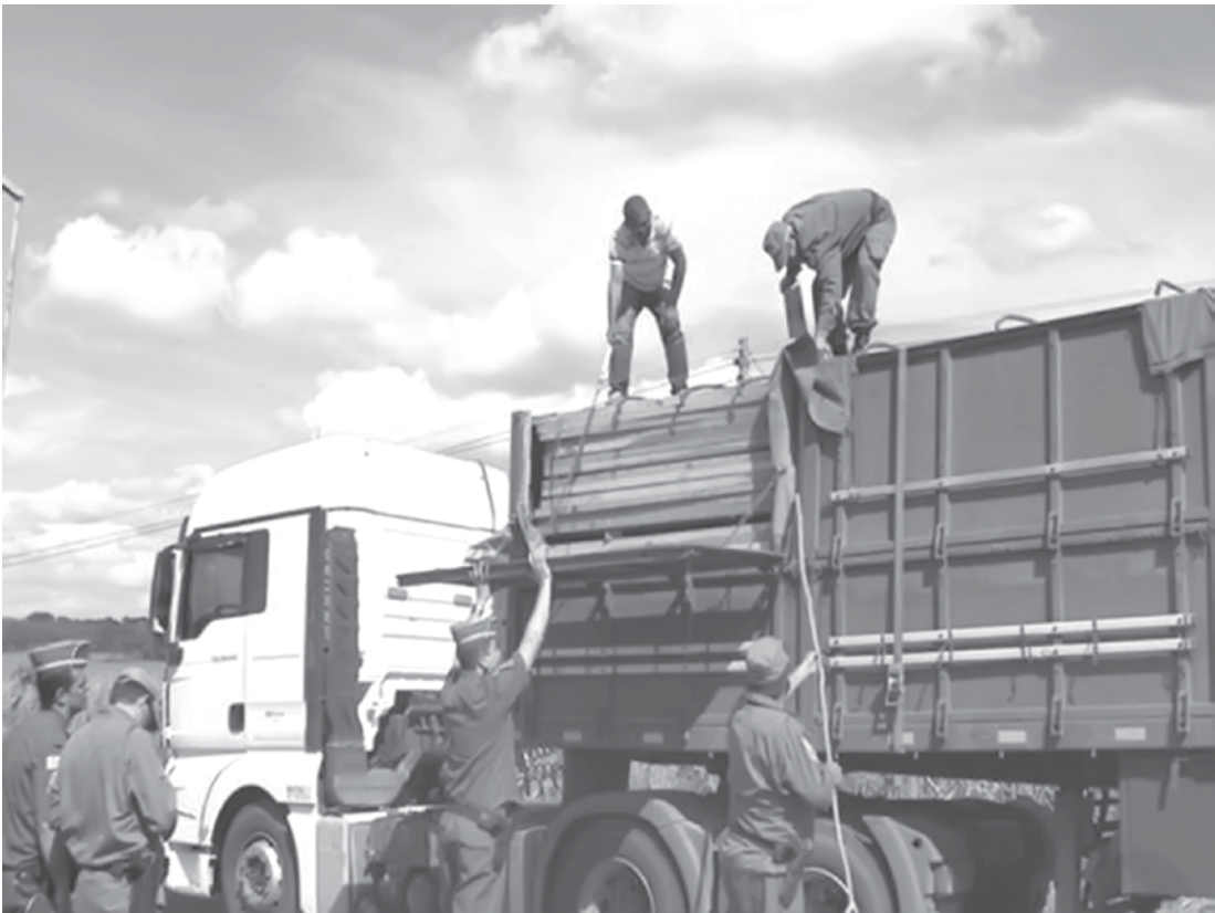
Policiais fiscalizam caminhão que transporta madeira

Segundo a polícia, a maior parte da madeira que é apreendida nas fiscalizações vem do desmatamento. O Estado de São Paulo é considerado principal consumidor desse tipo de madeira irregular que é extraída da