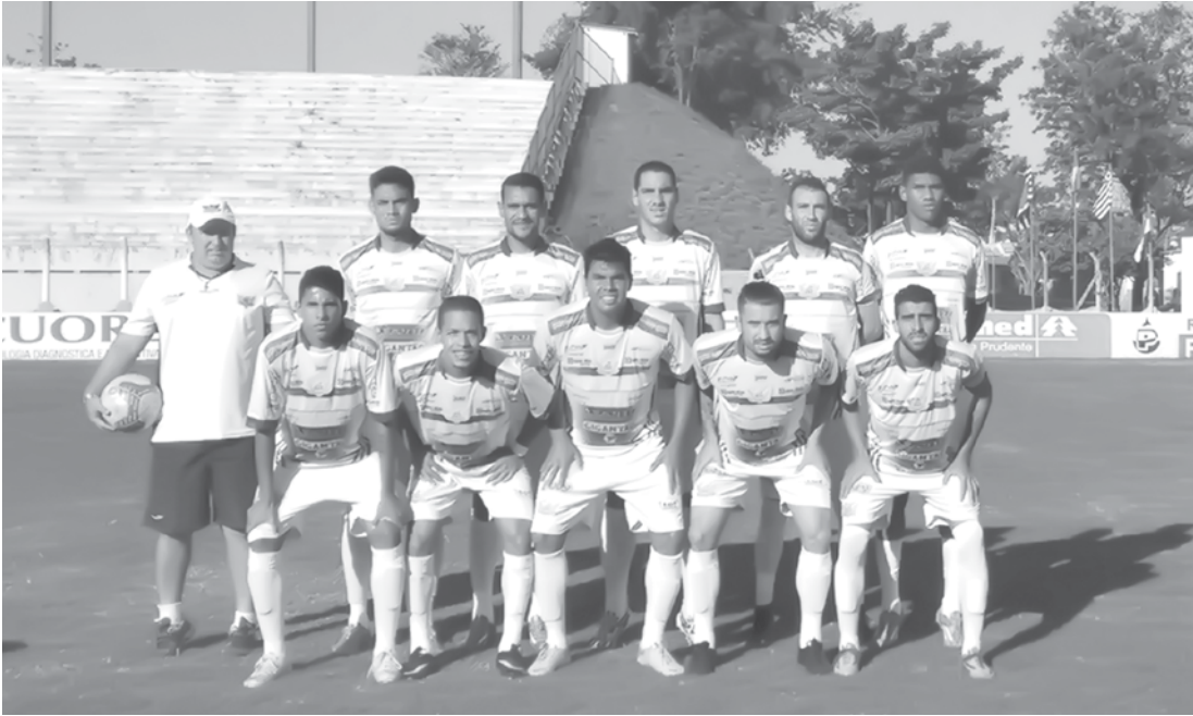
Fefecê recebe o Noroeste após conquistar um empate em Presidente Prudente, diante do Grêmio, atual líder do Grupo 1