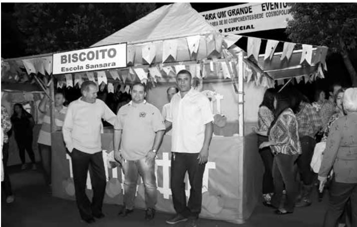
A escola Sansara também foi parceira do Arraial e ficou com a distribuição do biscoito