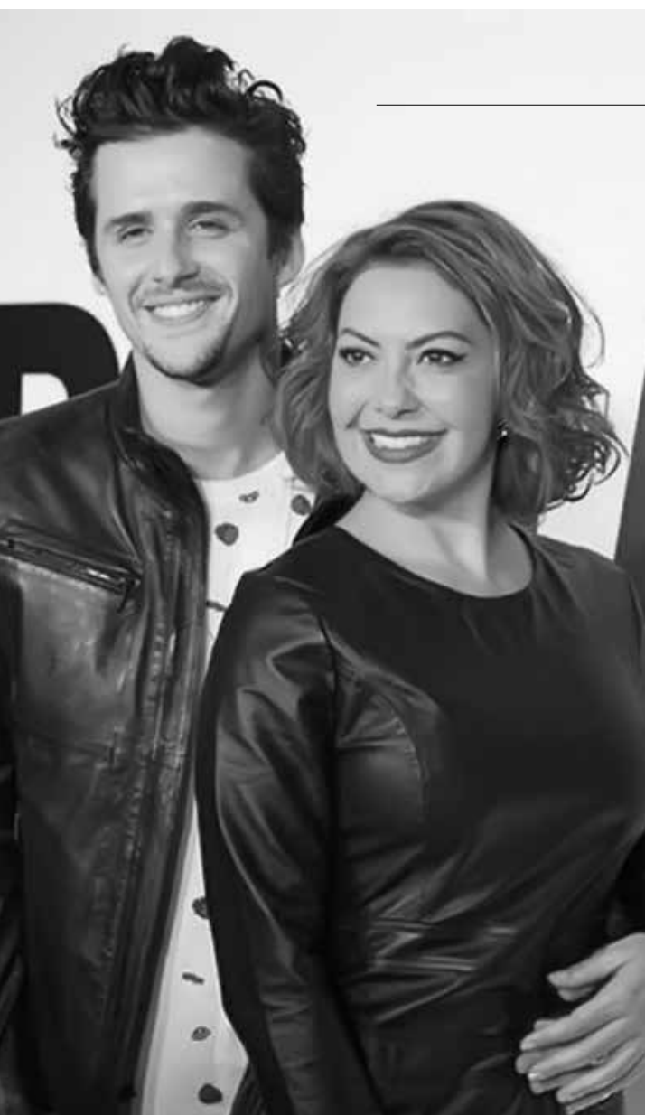
Gil Coelho e Fabíula Nascimento não estão mais juntos