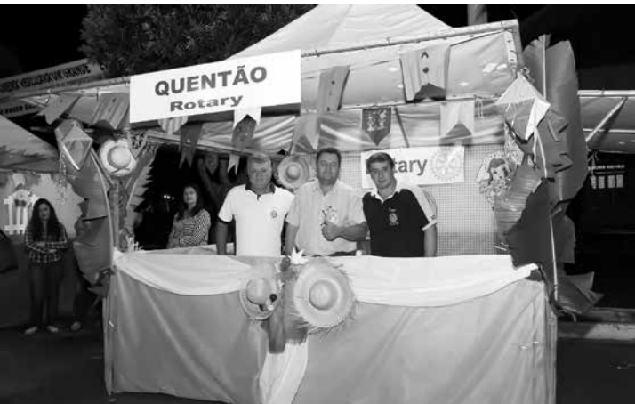
O Rotary Clube de Ouroeste mais um ano manteve a parceria na festa