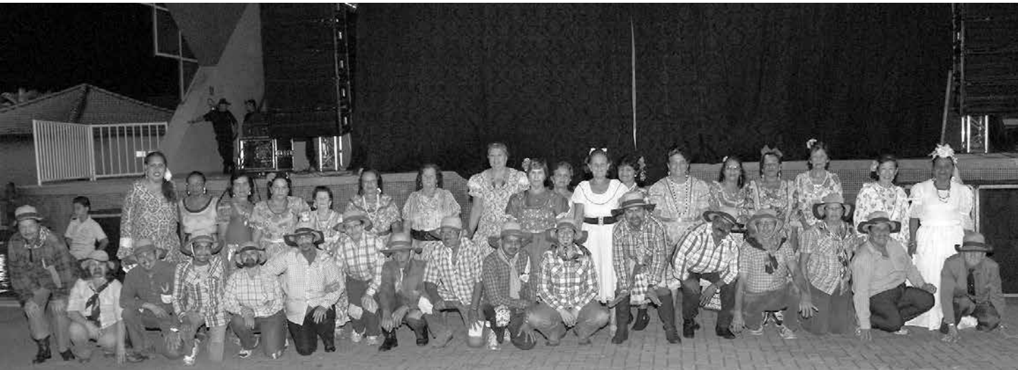
Membros do Grupo da Terceira Idade de Ouroeste que abrilhantaram a festa com a dança de quadrilha