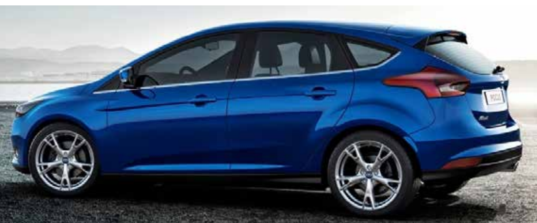
Novo Focus chega em agosto, atualizado com lançamento ocorrido na Europa no final do ano passado

Veículo traz novidades tecnológicas embarcadas desde o modelo de entrada, com destaque para o controle de estabilidade preventivo