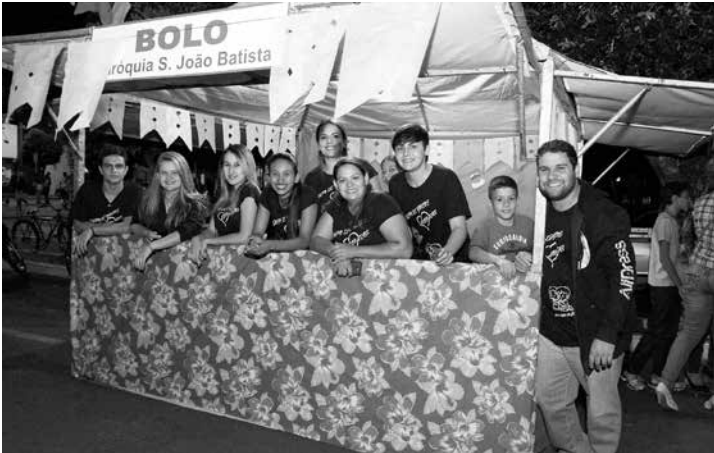
A Paróquia São João Batista gentilmente participou do arraial com a organização da barraca e distribuição de bolo