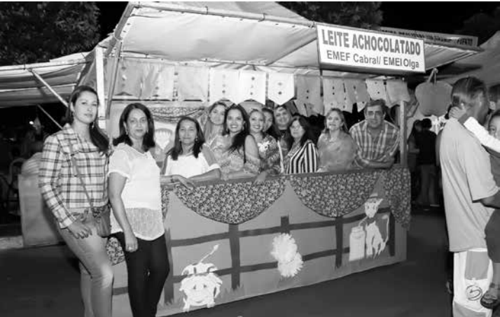
A EMEF Cabral e EMEI Olga de Arabá organizaram a barraca e distribuíram o leite achocolatado aos participantes