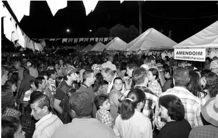
O Arraial de Ouro se consolidou como uma das melhores festas Junina da região pela organização, público e atrações