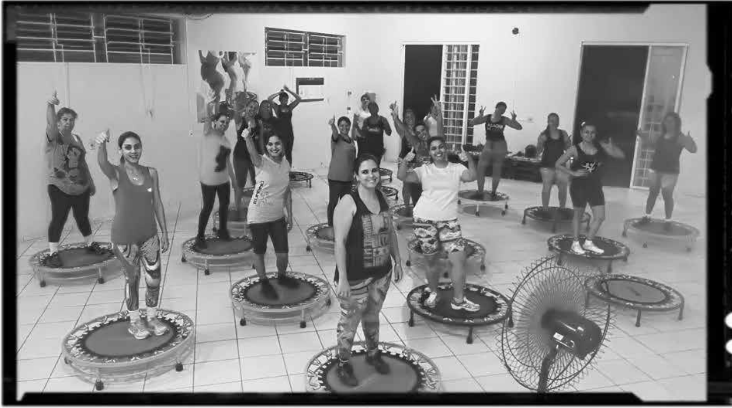
A Life Academia de Ouroeste abriu vagas para novas atividades como: yogaterapia, treinamento funcional, e mix dance

A Life Academia de Ouroeste abriu vagas para novas atividades como: Yogaterapia, treinamento funcional, mix dance, além de novos horários para as atividades de zumba e jump. Os novos horários serão: Para aulas de jump: segundas, quartas e sextas-feiras às 8h da manhã e as 16h. Início dia 06/07. Para aulas de Zumba as terça e quintas-feiras às 8h da manhã. Início dia 07/07. A academia está instalada na Avenida do Bandeirantes, nº 2045, em frente a Secretaria de Educação. A direção