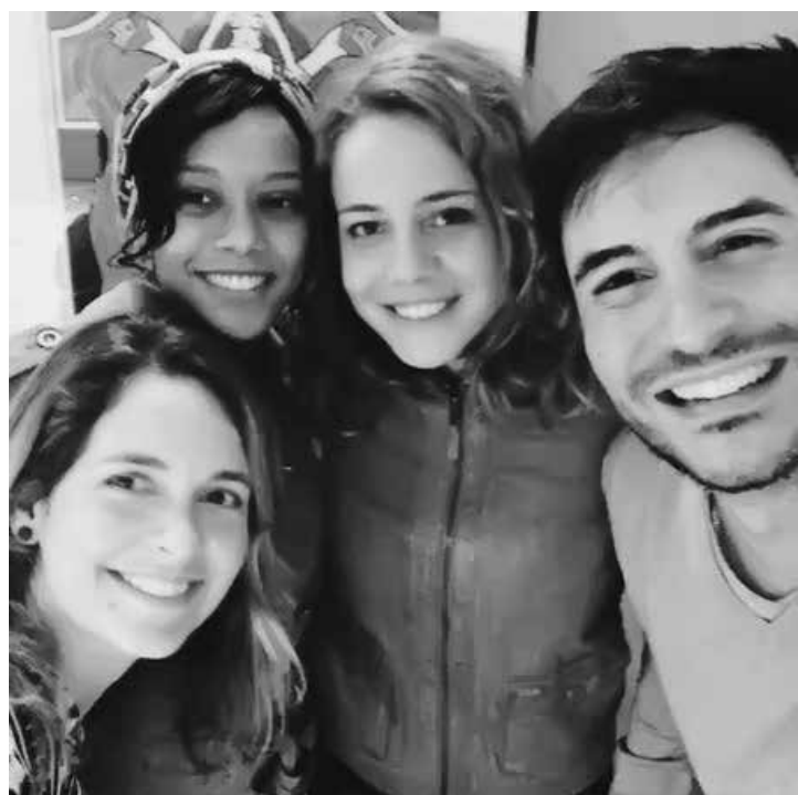
Claudia Abreu, tais Araújo, Leandra Leal e Ricardo Tozzi: empreguetes de volta

Fabíula foi casada com o ator Alexandre Nero e também namorou George Sauma. Já Gil foi namorado de Monique Afradique.