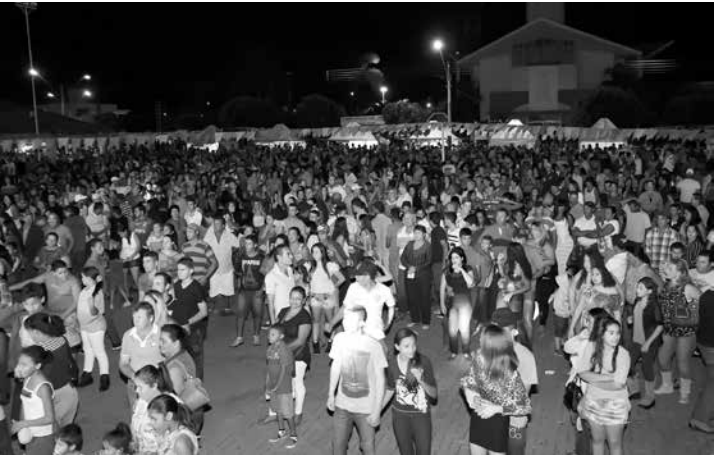
Centenas de pessoas participaram da programação do 7º Arraial de Ouro, na praça de Eventos em Ouroeste