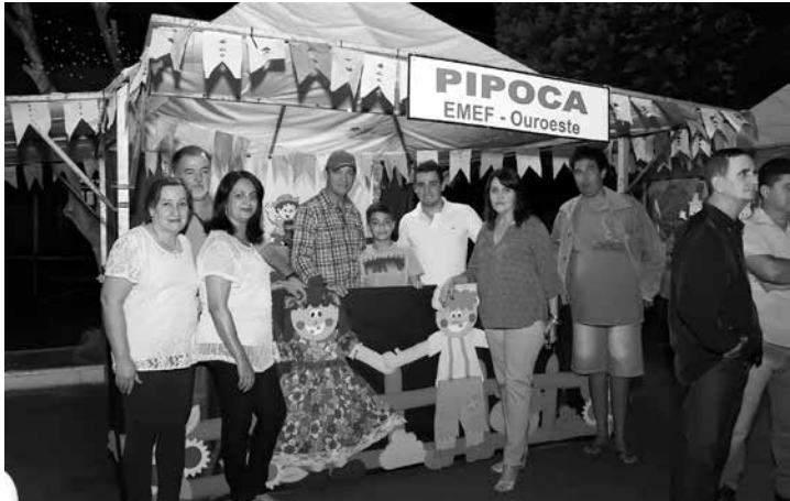
Barraca da pipoca, decorada e organizada pela EMEF de Ouroeste