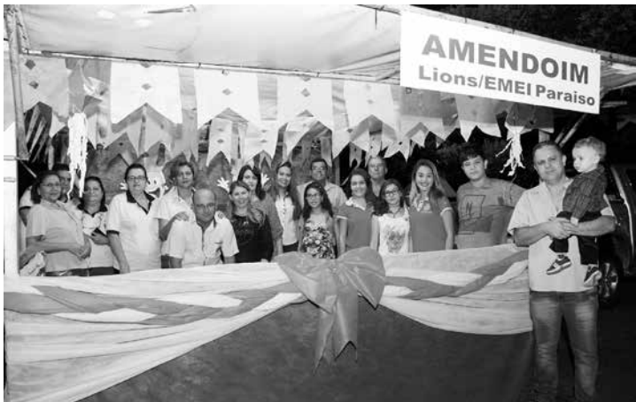
O Lions Clube de Ouroeste e a EMEI Paraíso Infantil também trabalharam para o sucesso do Arraial de Ouro e distribuíram o amendoim