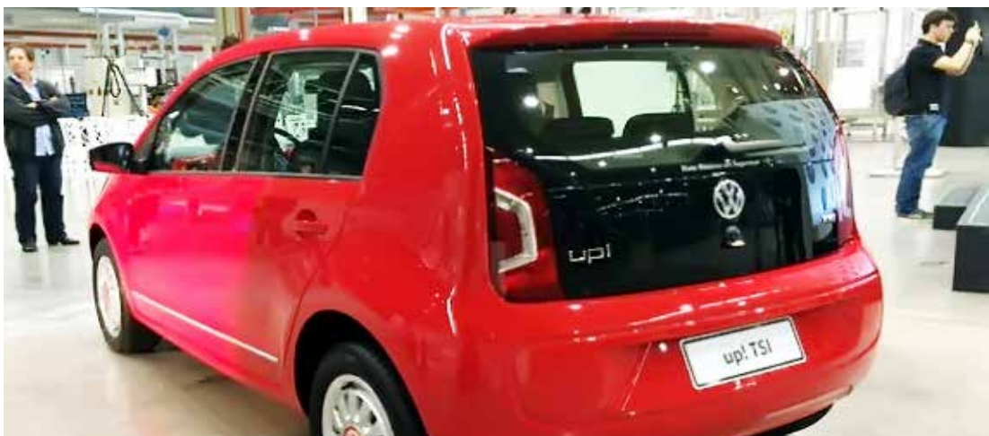
Compacto estreará a nova motorização da VW, com promessa de maior potência e economia

Primeiramente relegados, agora aceitos e, no futuro, a motorização que estará em praticamente todos os veículos. Referimo-nos à volta, com força, dos motores turbo, agora acoplados a três cilindros, geraldo, por incrível que pare-