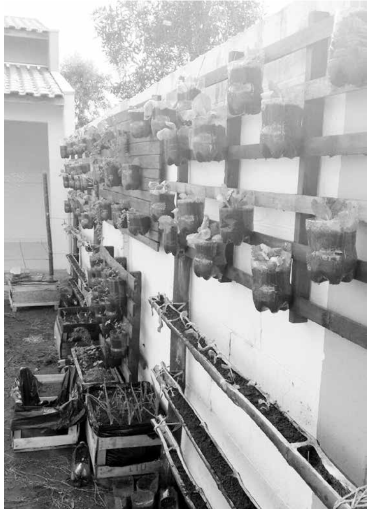
Os alunos tem a oportunidade de observar todo o processo de germinação, cultivo e os cuidados necessários para que as hortaliças se desenvolvam