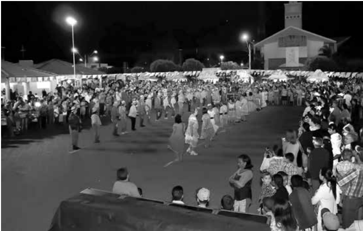
O grupo da terceira idade arrancou aplausos pela belíssima apresentação