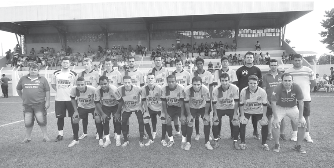
Equipe do ServBem, de Fernandópolis