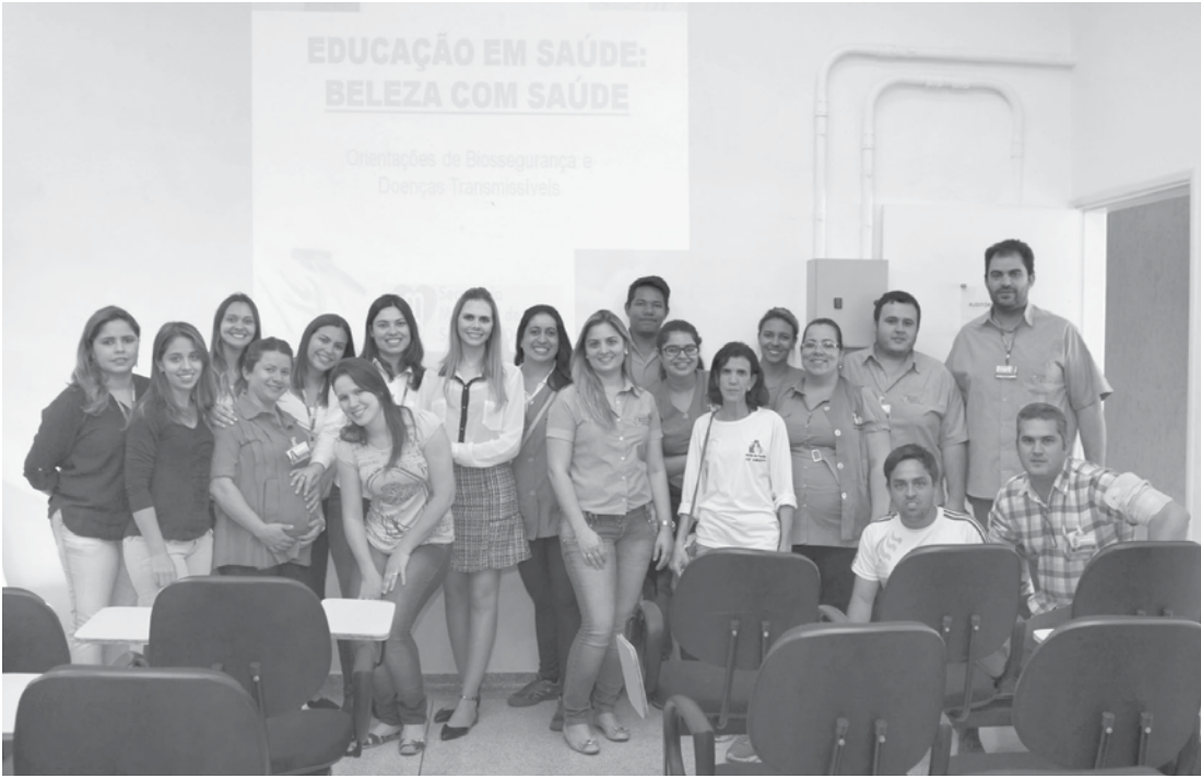
Equipe organizadora do encontro “Beleza com Saúde”