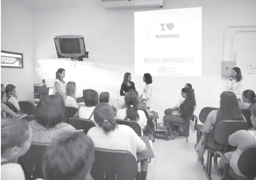
Teatro encenado aos profissionais pelos agentes comunitários de saúde