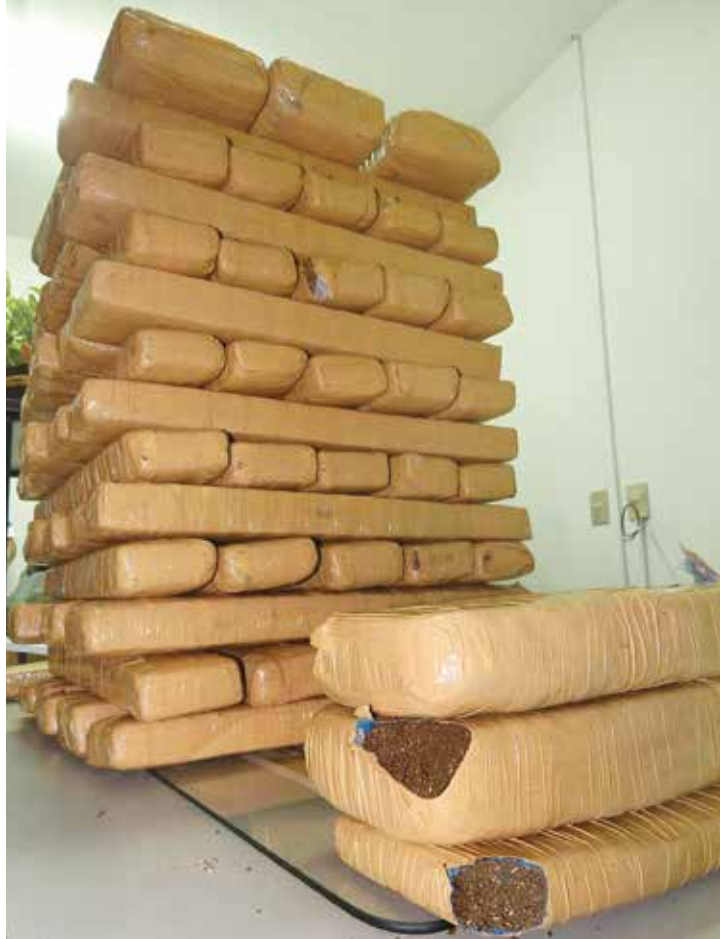
Maconha e haxixe apreendidos em agosto do ano passado