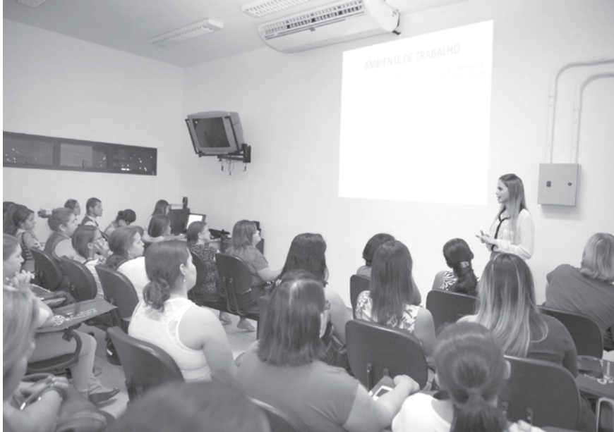
Palestras ministradas pela equipe com a participação de 50 trabalhadores do setor de beleza