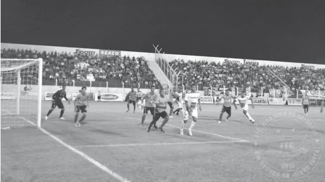
Equipes já se enfrentaram no primeiro turno da competição, quando o Fefecê venceu por 3 a 0

timento do grupo, que enxerga no adversário uma ameaça aos planos da Águia. “A gente sabe que a pressão está do outro lado. O Bandeirante está mal na tabela, mas não tem jogo fácil, não”, destacou. Vale lembrar que na terceira rodada do primeiro turno, o Fefecê venceu, em casa, o Bandeirante por 3 a 0. Na oportunidade, foi a primeira vitória conquistada pela Águia na competição.