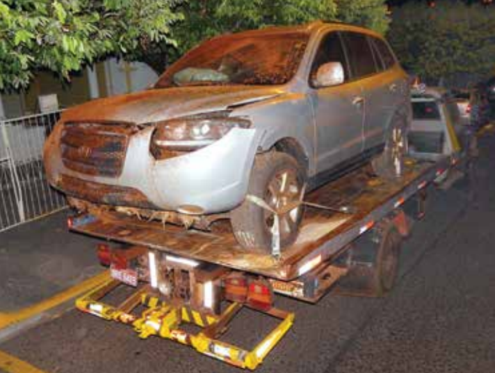
SUV Santa Fé utilizado pelos traficantes