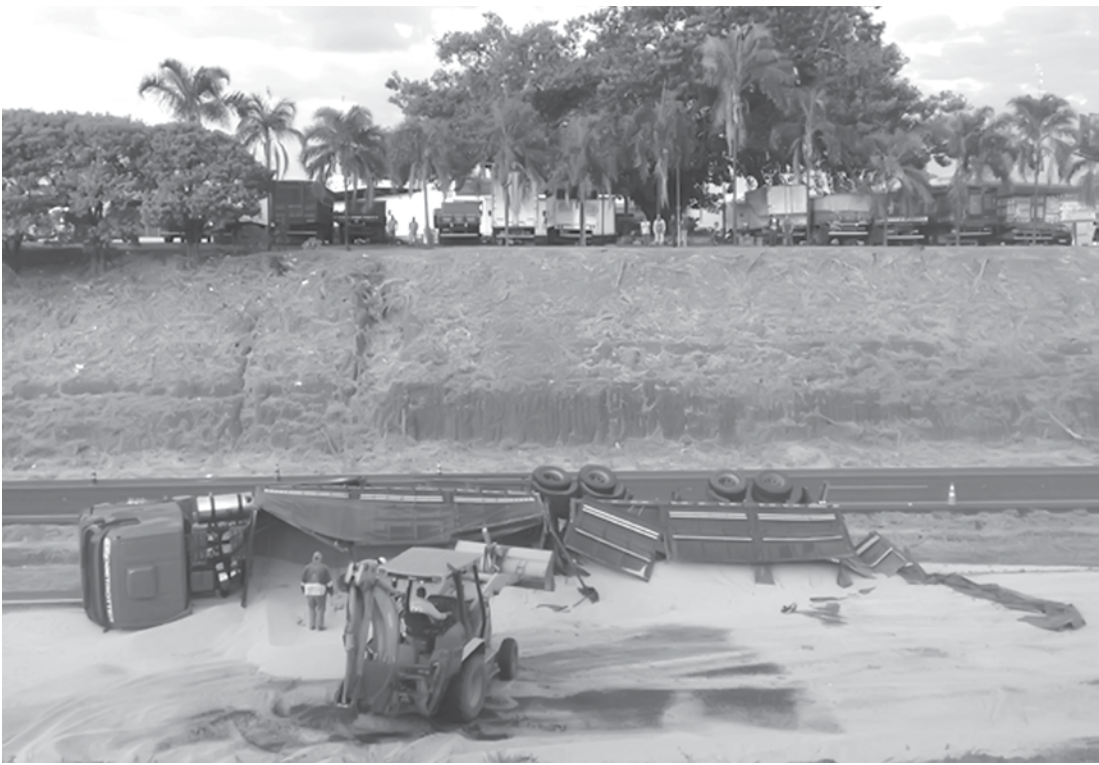
Motorista perdeu controle da direção e carreta tombou no canteiro central

culo e carga, que ficou espalhada pela rodovia. A pista foi liberada na manhã de ontem. A remoção do produto foi feita por equipes do Corpo de Bombeiros e agentes da Unidade de Atendimento Básico (UBA) do Departamento de Estrada e Rodagens (DER). Uma pá carregadeira foi utilizada no trabalho.