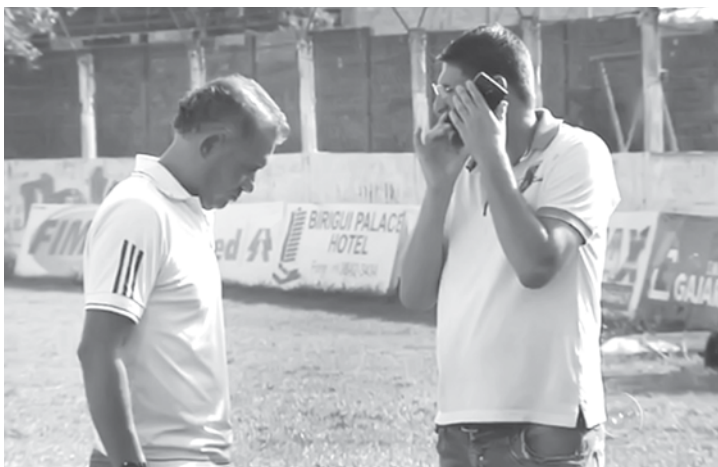
Clube corre atrás de parceiros para conseguir pagar os salários dos jogadores

A crise no Bandeirante parece não ter fim. Além da má campanha do time no Estadual, os salários do elenco estão atrasados. Os jogadores ameaçam não entrar em campo caso a dívida não seja paga. Com a crise, a possibilidade do Bandeirante abandonar o campeonato não está descartada. Se isso acontecer o time