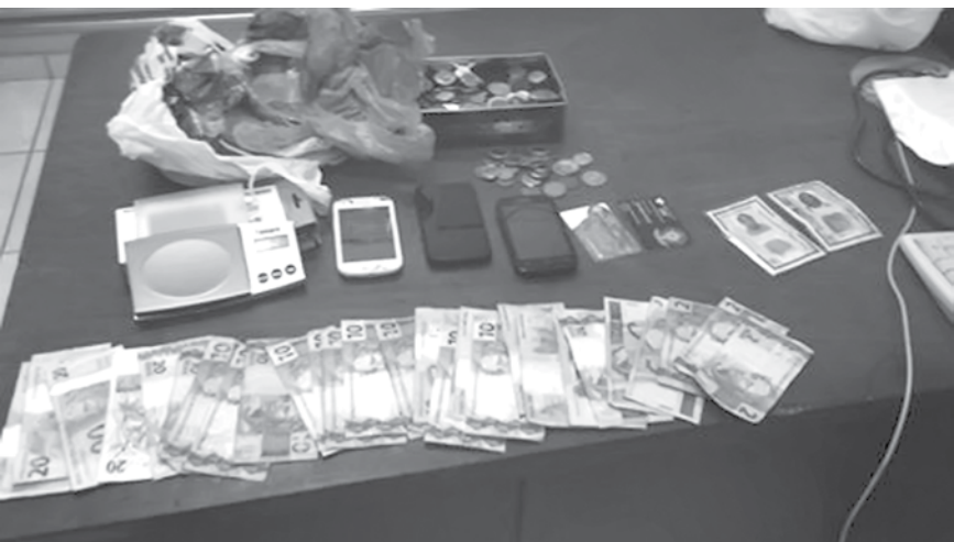
Dinheiro e material utilizados no tráfico foram apreendidos pelos policiais