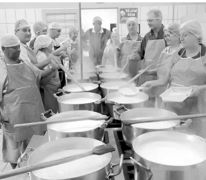
Em destaque, momento de trabalho voluntário da 'Equipe do Doce' da AVCC.