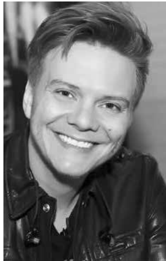
Michel Teló é o novo jurado e “The Voice Brasil” retorna ainda em 2015, na Globo