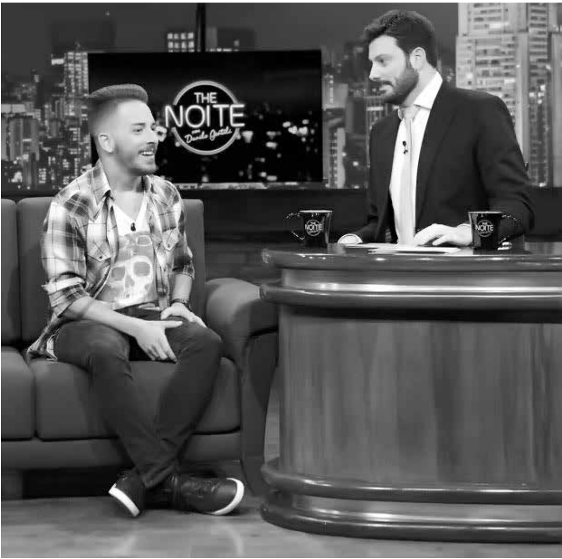
Júnior, no “The Noite”, com Danilo Gentili