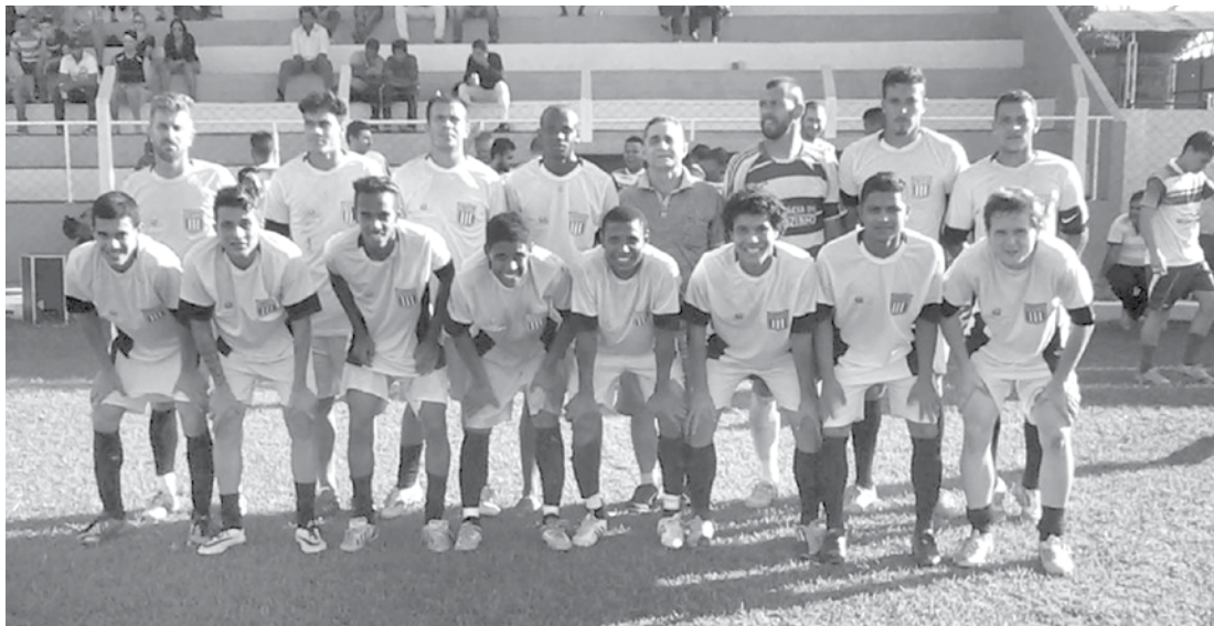
Equipe A.A. Pontalindense pronta para buscar a vaga na semifinal