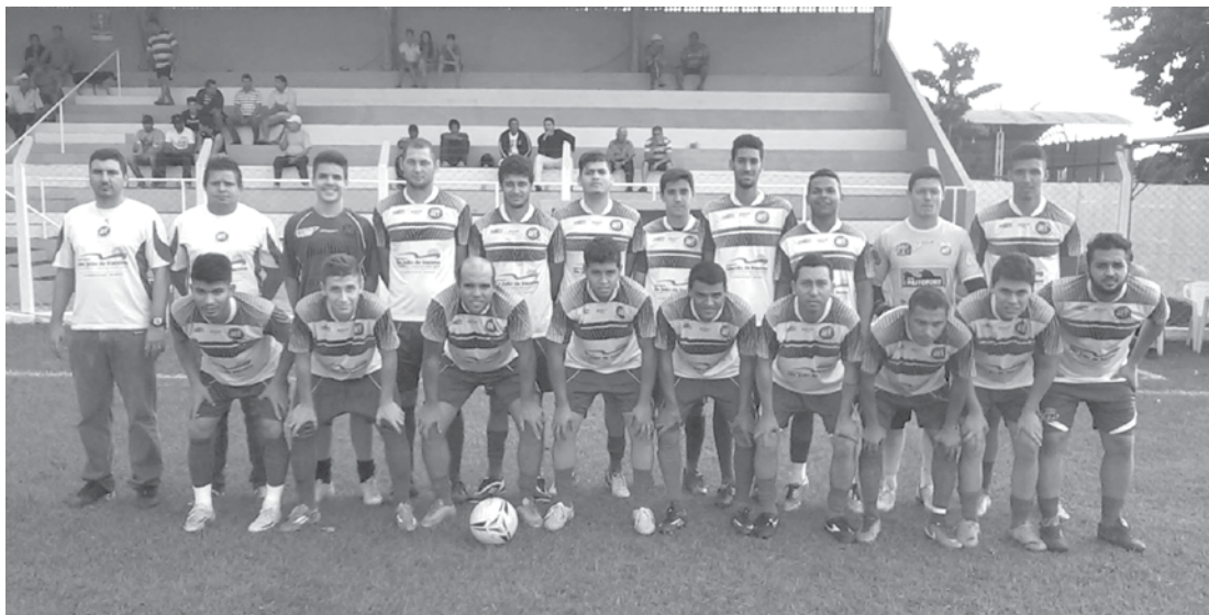
Time de São João de Iracema, Pereira E.C., que avançou às quartas de final vencendo de goleada