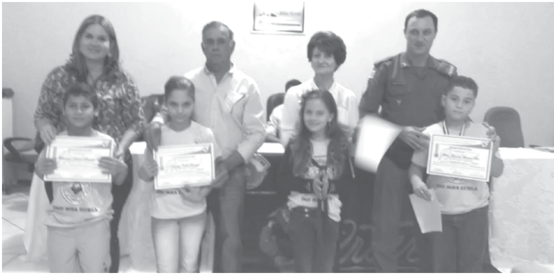
Participantes da formatura do PROERD