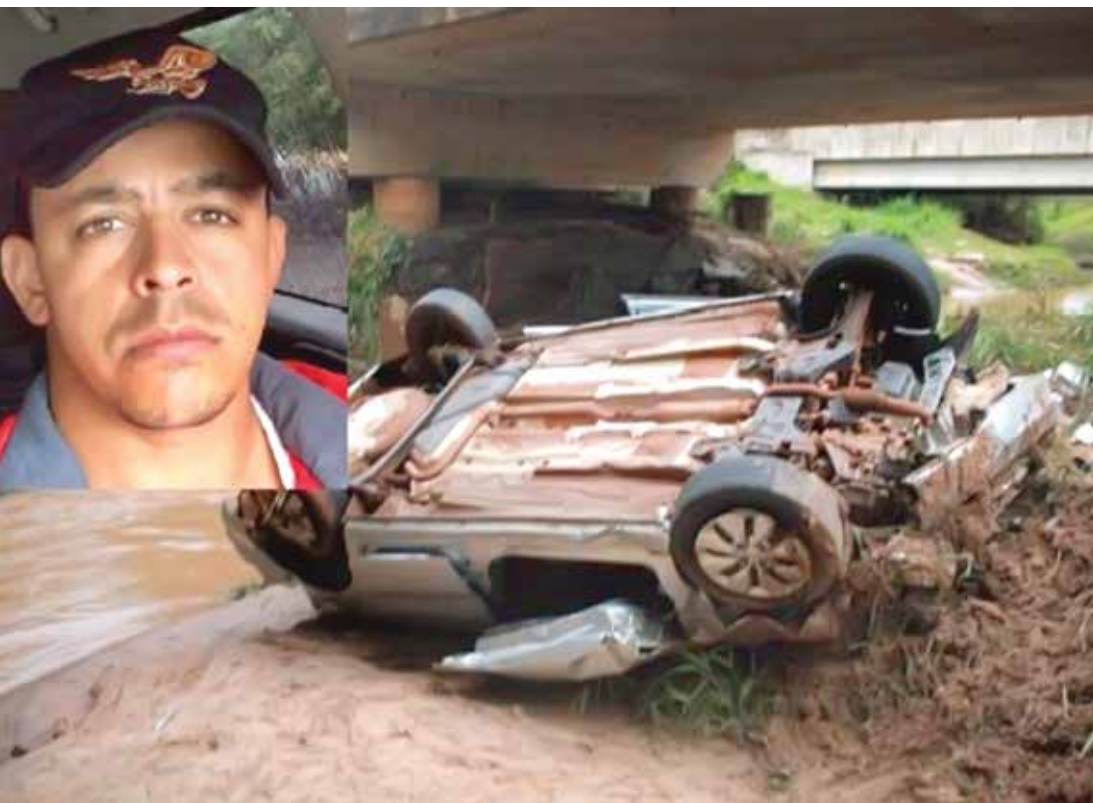
Renner encontra-se sob cuidados da UTI e seu quadro continua grave

Polícia suspeita que aquaplanagem pode ter causado acidente