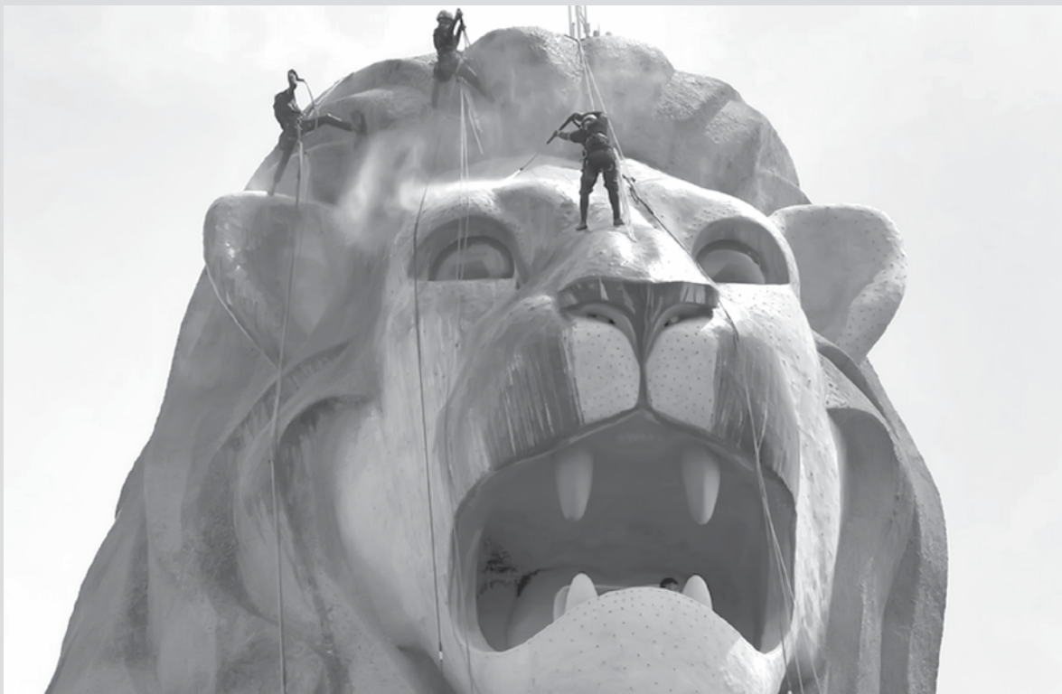
imagem do dia

Equipe de limpeza remove a sujeira acumulada na estátua de leão de 37 metros que é o ícone turístico da ilha resort de Sentosa, à frente da celebração dos 50 anos da cidade nas Filipinas.