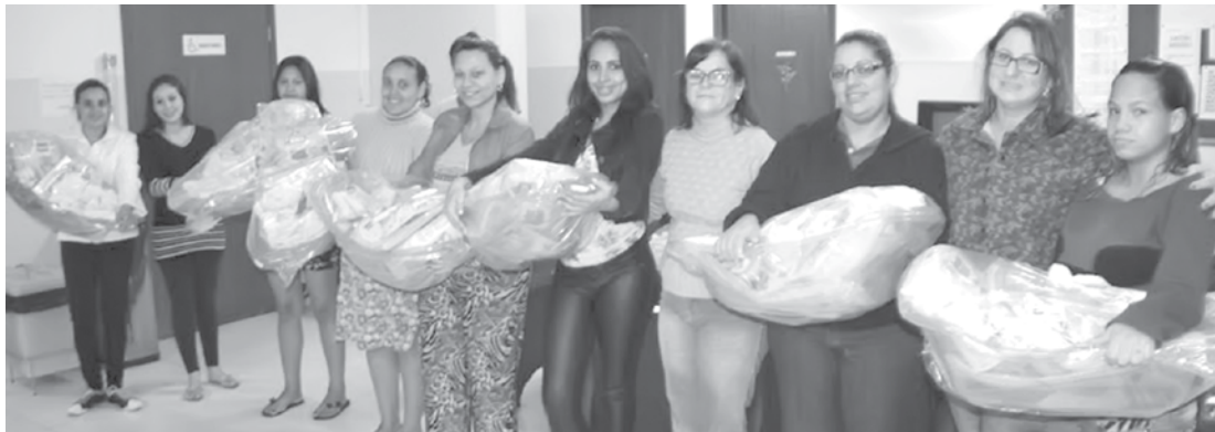
Entrega dos kits para as 'futuras mães'

→ ASSESSORIA DE IMPRENSA Prefeitura de Fernandópolis A Prefeitura de Fernandópolis, através da Secretaria Municipal da Saúde, realizou a entrega de mais 15 kits gestantes, no UBS Por do Sol. Os kits fazem parte do projeto que a saúde desenvolve com as gestantes do município. Ao todo, 79 gestantes já foram beneficiadas com os materiais em toda cidade. As gestantes beneficiadas com os kits participaram do curso de gestantes desenvolvido pela Secretaria da Saúde nos postinhos de saúde do município onde elas têm o acesso garantido aos serviços de saúde, tendo as-