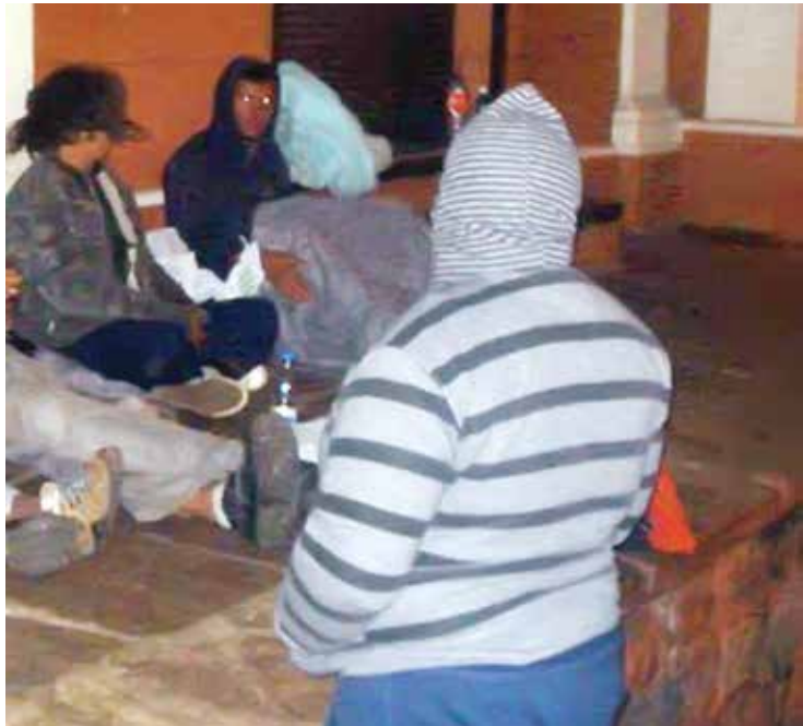
Diversos pontos de Fernandópolis foram percorridos pelo grupo, que não encontrou dificuldades em se aproximar dos moradores de rua