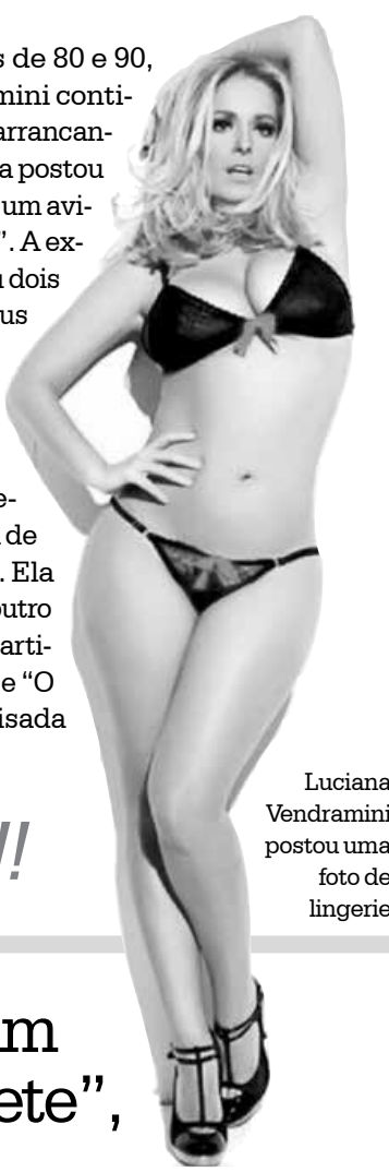
Luciana Vendramini postou uma foto de lingerie

Atualmente, Luciana Vendramini entrevista musas do cinema nacional para um programa de entrevistas num canal a cabo. Ela também grava uma série para outro canal fechado. A eterna musa participou de novelas como “Vamp” e “O Rei do Gado”, atualmente reprisada no “Vale a pena ver de novo”.