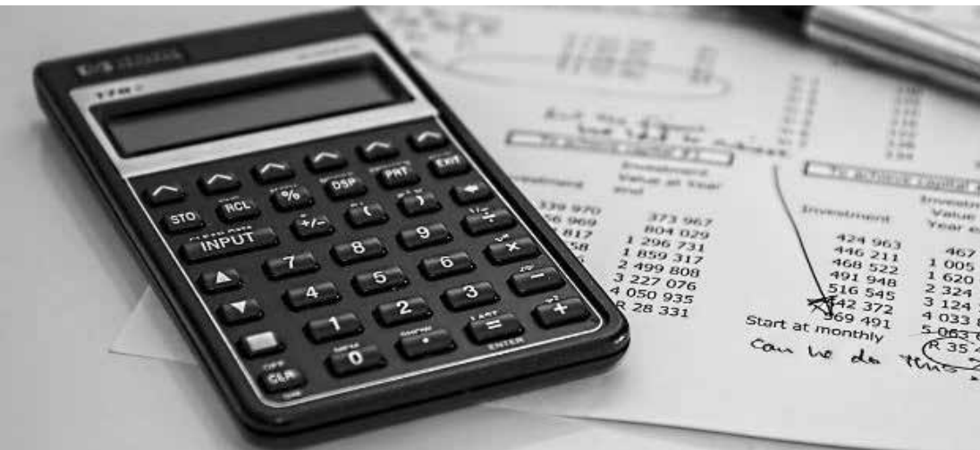
Possível aumento da carga tributária para micro e pequena empresa é destaque do ofício encaminhado à Câmara dos Deputados

→ ASSESSORIA DE IMPRENSA Fecomércio-SP Como um dos principais agentes na defesa do projeto de alteração e do tratamento diferenciado previsto para as empresas enquadradas no Simples Nacional, a Federação do Comércio de Bens, Serviços e Turismo do Estado de São Paulo (FecomercioSP) apresentou, por meio de ofício, propostas de aperfeiçoamento ao Projeto de Lei Parlamentar (PLP) nº 448 de 2014 para serem analisadas no âmbito das discussões da Câmara dos Deputados.