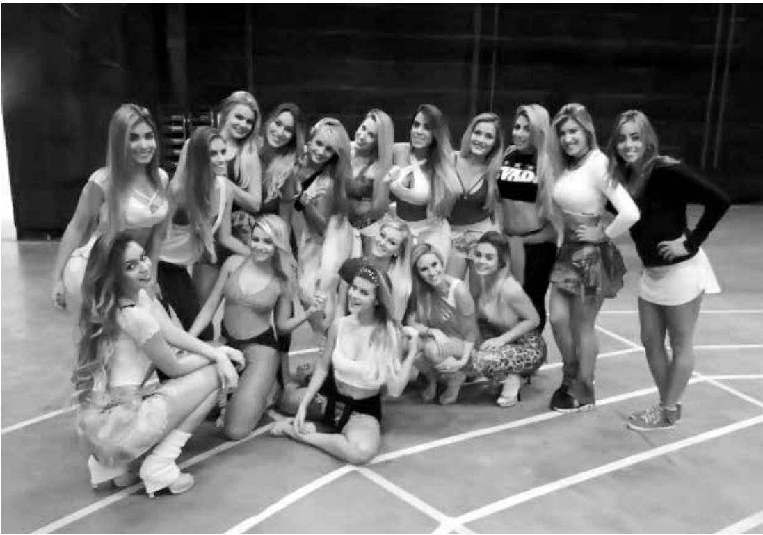
Milhares de internautas alegaram racismo, pela ausência de negras, machismo, pelo termo “mulheres para todos os gostos” e “hipocrisia”, pela aparente contradição entre a campanha #somostodosmaiu e a representação majoritariamente caucasiana no balé do Faustão

A TV Globo disse inicialmente desconhecer a polêmica em torno da postagem. Após o contato da BBC Brasil, a emissora afirmou, por e-mail, que “o post não reflete a totalidade das participantes do quadro”. A produção do programa afirma que “o Domingo do Faustão, assim como toda a programação da Glo-