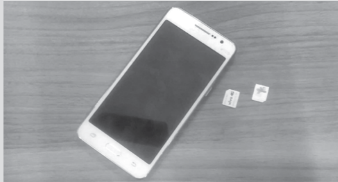
Os dois chips já estavam fora do aparelho quando a PM o encontrou