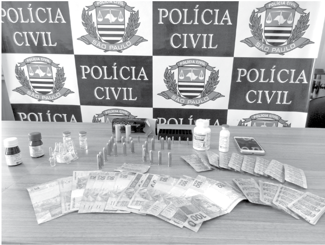
Dinheiro, medicamentos e munições apreendidos pela PC de Ouroeste

Em Ouroeste, um indivíduo foi preso por venda de medicamentos abortivos, anabolizantes e munições. Após investigações realizadas por policiais civis daquele município foi dado cumprimento ao mandado de busca na residência de R.R.P., 23 anos. Lá, foram encontrados diversos medicamentos os quais eram comercializados de forma ilegal. Foram apreendidos medicamentos da marca Oxyeli-