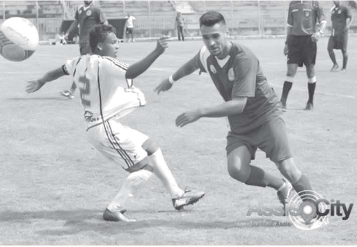
Assisense espera superar o Fefecê, em seus domínios, neste domingo