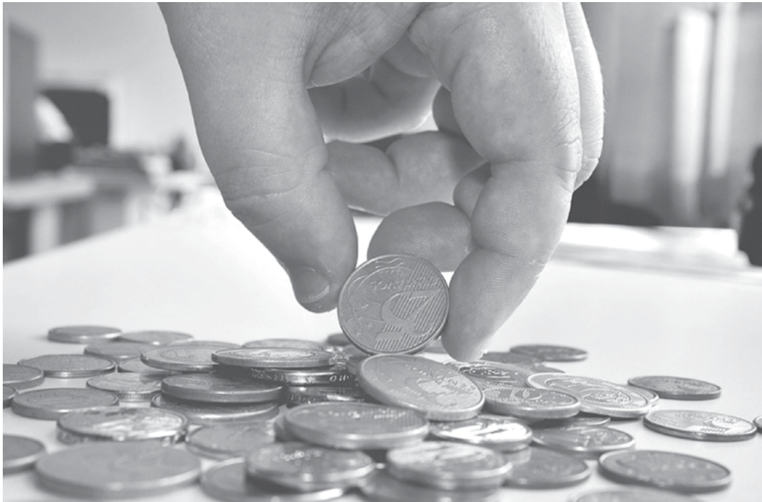
Ultimamente, moeda tem sido artigo raro no comércio de Fernandópolis

De acordo com ele, o dinheiro que está guardado causa uma falsa impressão de que a pessoa está economizando, além de contribuir negativamente com o mercado. “Toda rentabilidade, para ser real,