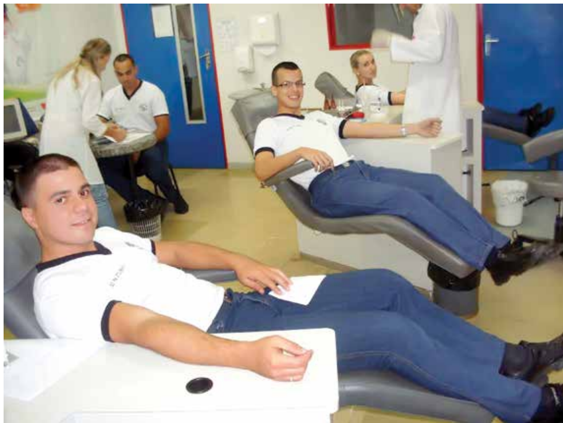
Alunos soldados em dia de doação no Hemocentro de Fernandópolis

O horário de funcionamento do Hemocentro de Fernandópolis é de segunda a sexta-feira, das 7h30 às 18h30, sendo que às quartas-feiras funciona até as 20h e aos sábados das 8h às 12h. A unidade fica situada na Rua Si-