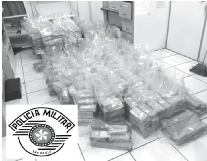
Ao todo, foram apreendidos 810 quilos de maconha na funilaria

Entorpecente apreendido em MG estava na caçamba de caminhonete mens que estavam no local foram presos em flagrante. Além do entorpecente, foram apreendidos um Honda Civic, um cavalo mecânico, dois reboques e dois celulares. A dupla e os materiais foram encaminhados ao Departamento da Polícia Federal de Araraquara. Eles irão responder por tráfico de drogas.