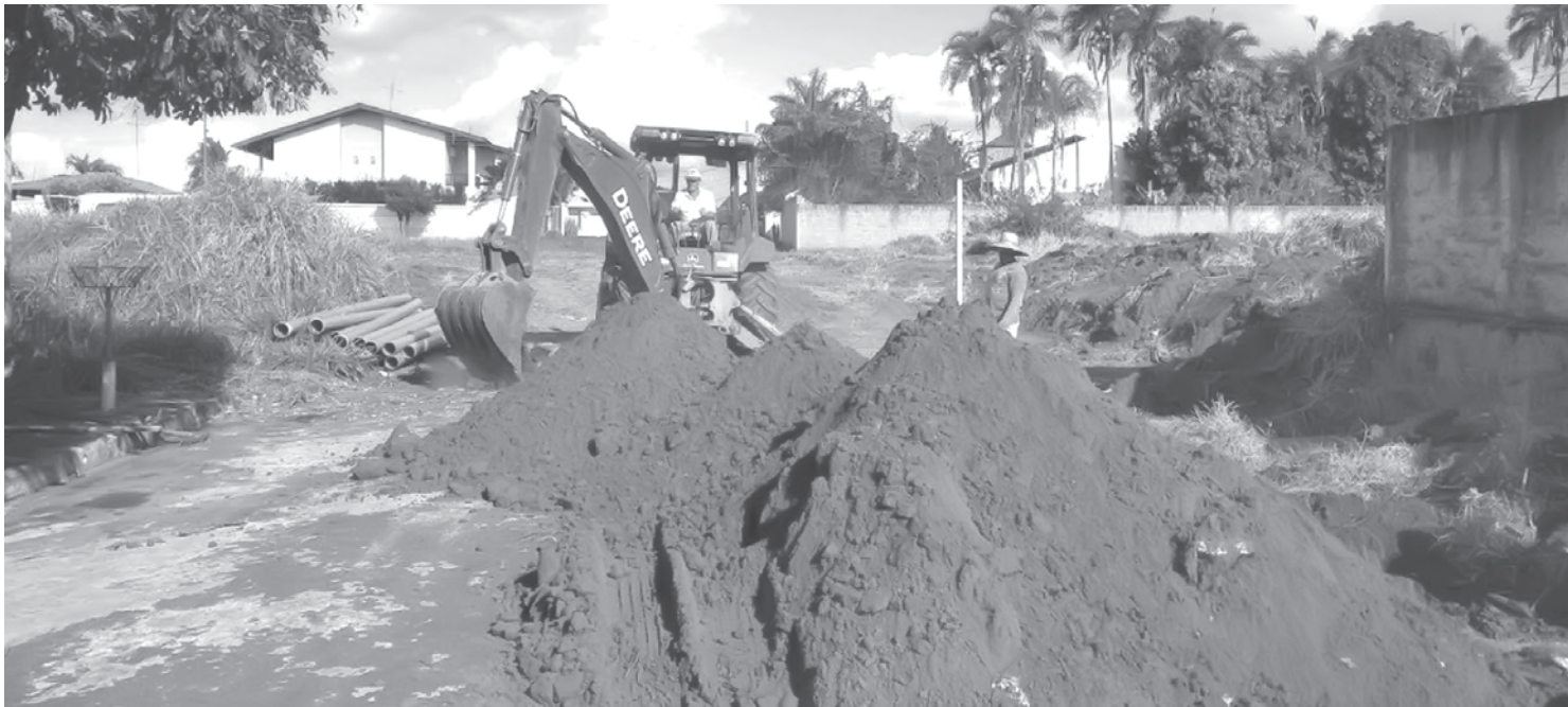
Serviços serão executados com recursos próprios do município