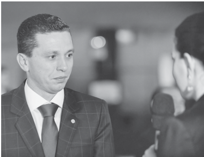
Deputado federal Fausto Pinato durante entrevista à TV Câmara

habitação e saúde (síndrome do pânico, hipertensão, diabetes etc.). Dessa forma, em todas as áreas a Segurança - gênero - tem incidência. O deputado ressaltou que em 2014 foram gastos R$ 260 bilhões com Segurança Pública no país, sem êxito na baixa do índice de violência. “Muito pelo contrário, em 2011, tínhamos 14 das 50 cidades mais violentas do mundo; em 2012, subiu para 15; 16 em 2013 e, em 2014, chegamos a 19”, argumenta Fausto Pinato citando dados da ONG Conselho Cidadão pela Seguridade Social Pública e Justiça Penal do México. “Essa agência viria ao encontro do Plano Nacional de Segurança Pública, lançado pelo Governo Federal e que tem como finalidade estabelecer e implementar uma política de segurança pública para o país, além de melhorar o entendimento entre os órgãos policiais federais e estaduais. No Capítulo V, o plano descreve as medidas que visam a aperfeiçoar o Sistema Nacional de Segurança Públi-