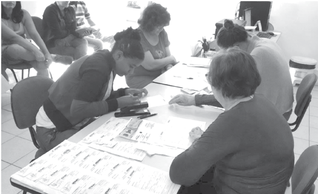
Cursos são gratuitos; interessados devem procurar o CMTMO