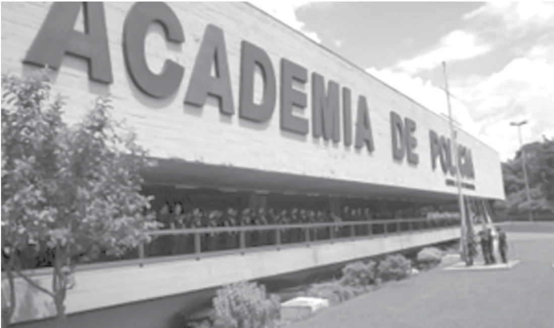
Sede da Acadepol em São Paulo, na Cidade Universitária

Os concursos para escrivão, investigador e auxiliar de necropsia estão na fase de investigação social, na qual é analisada a conduta moral e social do candidato, o que inclui o levantamento de infrações penais, por exemplo. Para os processos de escrivão e auxiliar de necropsia, essa fase tem previsão de término para o final deste mês. Para o concurso de investigador, a análise da conduta social dos candidatos deve seguir até o final de agosto. Depois que sair o resultado da investigação so-