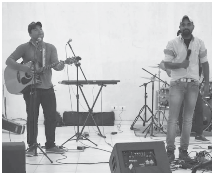
Momentos marcantes da feijoada com a presença dos organizadores, voluntários e convidados especiais