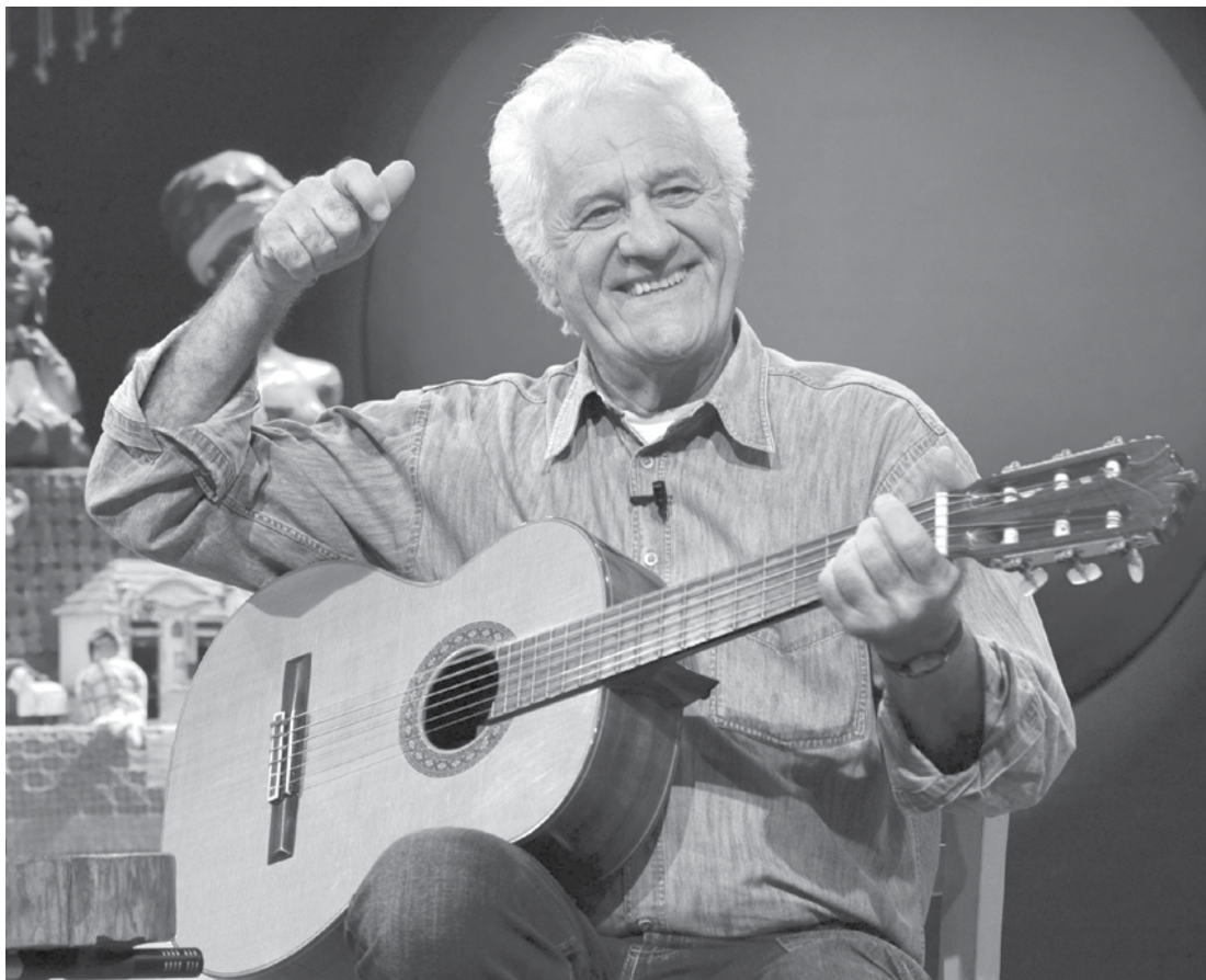
Boldrin em ação no “Sr. Brasil”, da TV Cultura

→ Da REDAÇÃO contato@oextra.net A presença do diretor e apresentador do programa “Sr. Brasil”, Rolando Boldrin, no dia 8 de agosto, às 20h30, no palco da Concha Acústica “Geraldo Alves Machado”, dentro da programação do Festival Literário de Votuporanga - FLIV 2015, está confirmada. Além de trazer muitos causos e canções caipiras em seu repertório, Rolando Boldrin, de 78 anos, prestará uma homenagem ao poeta brasileiro, Manoel de Barros, homenageado no FLIV 2015. Boldrin é reconhecido por seu trabalho de resgate dos valores brasileiros em suas variadas formas de expressão. Ele também fará uma homenagem ao poeta Manoel de Barros, patrono do festival. A programação de shows terá ainda Demônios da Garoa na abertura do dia 7 de agosto e Zélia Duncan, no encerramento, dia 15 de agosto. Todas as apresentações são gratuitas e realizadas no palco da Concha. ROLANDO BOLDRIN As brincadeiras de menino, ainda em São Joaquim da Barra, interior de São Paulo, onde Rolando Boldrin nasceu, já eram com uma viola. Junto com ela o sonho de se apresentar, de cantar, de contar histórias e de viver personagens o acompanhou até 1958, quando, aos 22 anos, con-