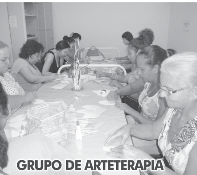
GRUPO DE ARTETERAPIA