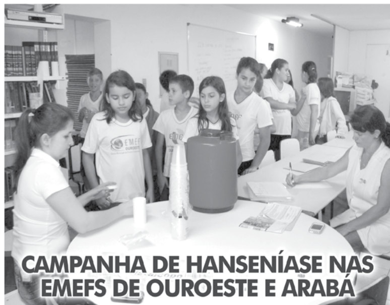
CAMPANHA DE HANSENÍASE NAS EMEFS DE OUROESTE E ARABÁ