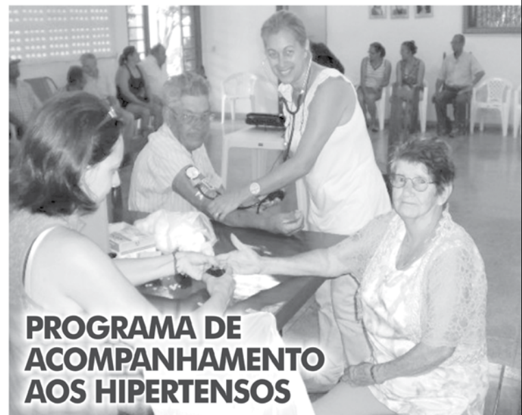
PROGRAMA DE ACOMPANHAMENTO AOS HIPERTENSOS