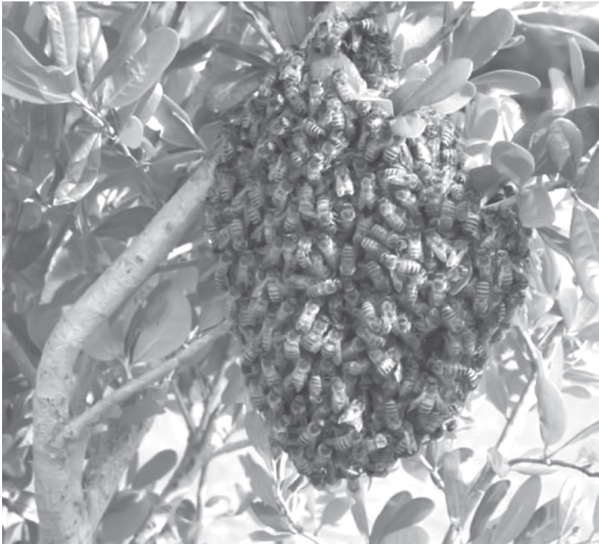
Abelhas “instalaram-se” em residência do Coester e têm gerado transtorno aos moradores do local

A empresária ainda diz que os insetos “tomaram conta do imóvel”. “Ontem, logo pela manhã, eu cheguei com compras e não consegui tirar as coisas do porta-malas. Foi aí que soube dos novos moradores. Agora estou vendo meios de tirá-las, porém não queria acabar com a minha árvore”, ressaltou.