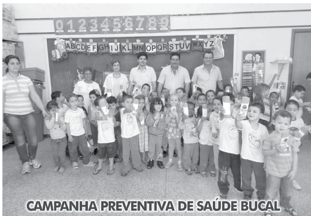
CAMPANHA PREVENTIVA DE SAÚDE BUCAL