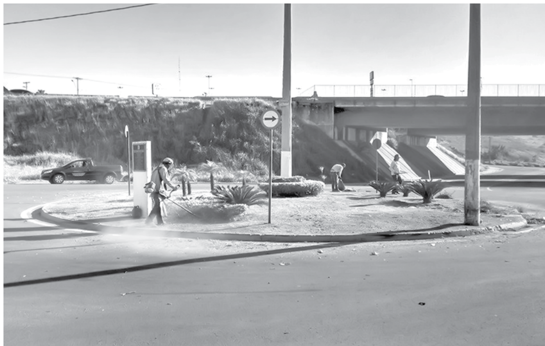
Serviço de manutenção deverá ser concluído ainda esta semana