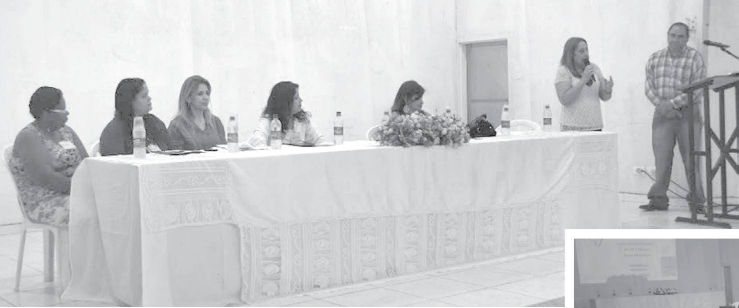
Encontro reuniu profissionais da assistência social e autoridades