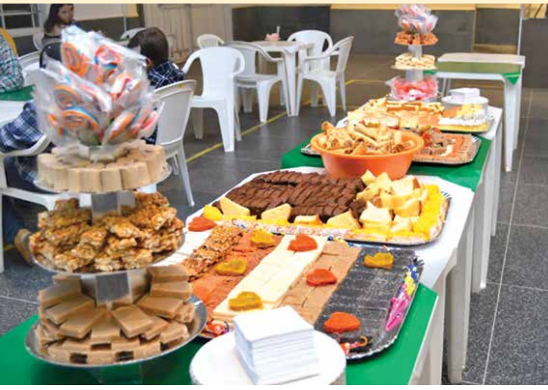
A “Festa Julina” animou os participantes com direito a “cadeia do amor”, “correio elegante”, além de bebidas e pratos típicos desta época do ano