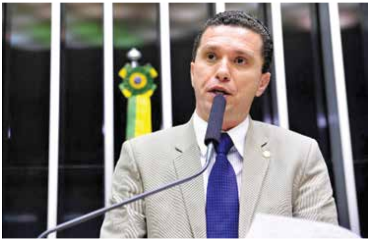
Deputado Fausto Pinato (PRB-SP)

dores nas escolas públicas de ensino médio, abordando os temas relacionados à profissão, atuação, pesquisa, estrutura das universidades, inscrição para o vestibular e o mercado de trabalho. Além disso, os alunos contariam com o apoio de uma professora da rede pública para sanar dúvidas ocorrentes durante a palestra, com todos os participantes do projeto a abordagem das carreiras de ciências exatas, com