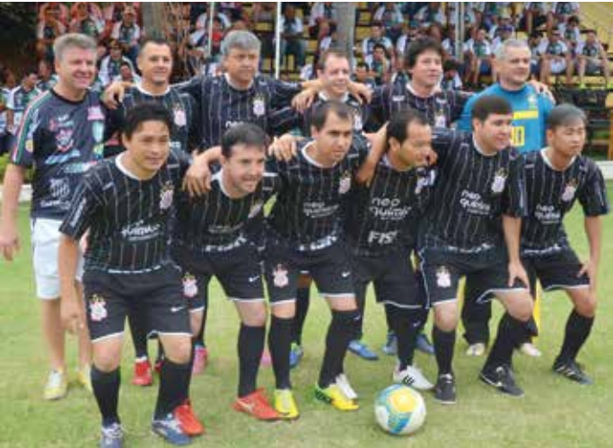
Time do Corinthians, campeão da categoria Máster