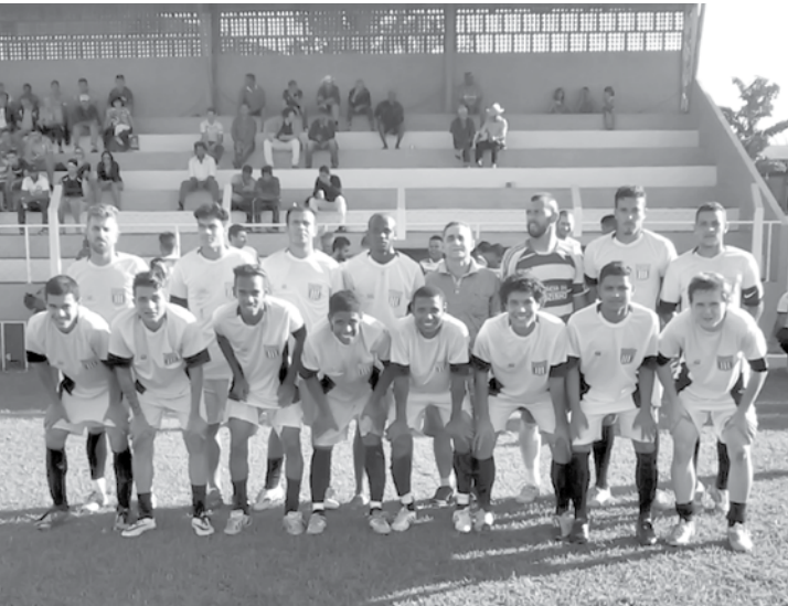
Equipe da A.A. Pontalindense