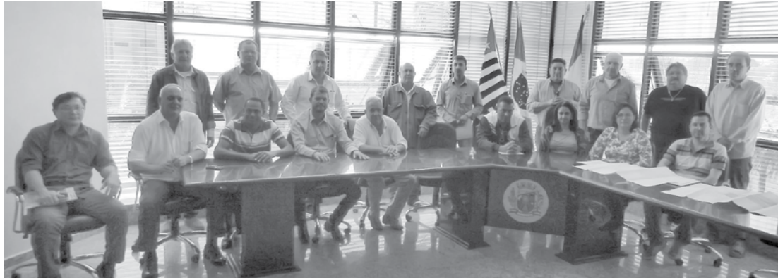
O investimento previsto é de quatro milhões de reais, incluindo construção das lagoas, aquisição da área de 16 hectares e execução de 4.200 metros de rede (emissário)

res e execução de 4.200 metros de rede (emissário).