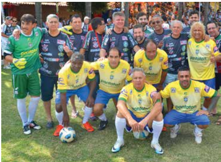
Diretoria da COPASASP com os eternos craques do futebol brasileiro