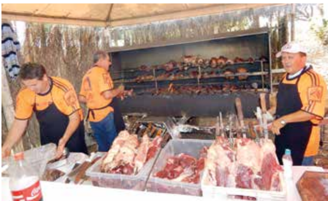
Churrasco especial com uma equipe que “domina a arte”