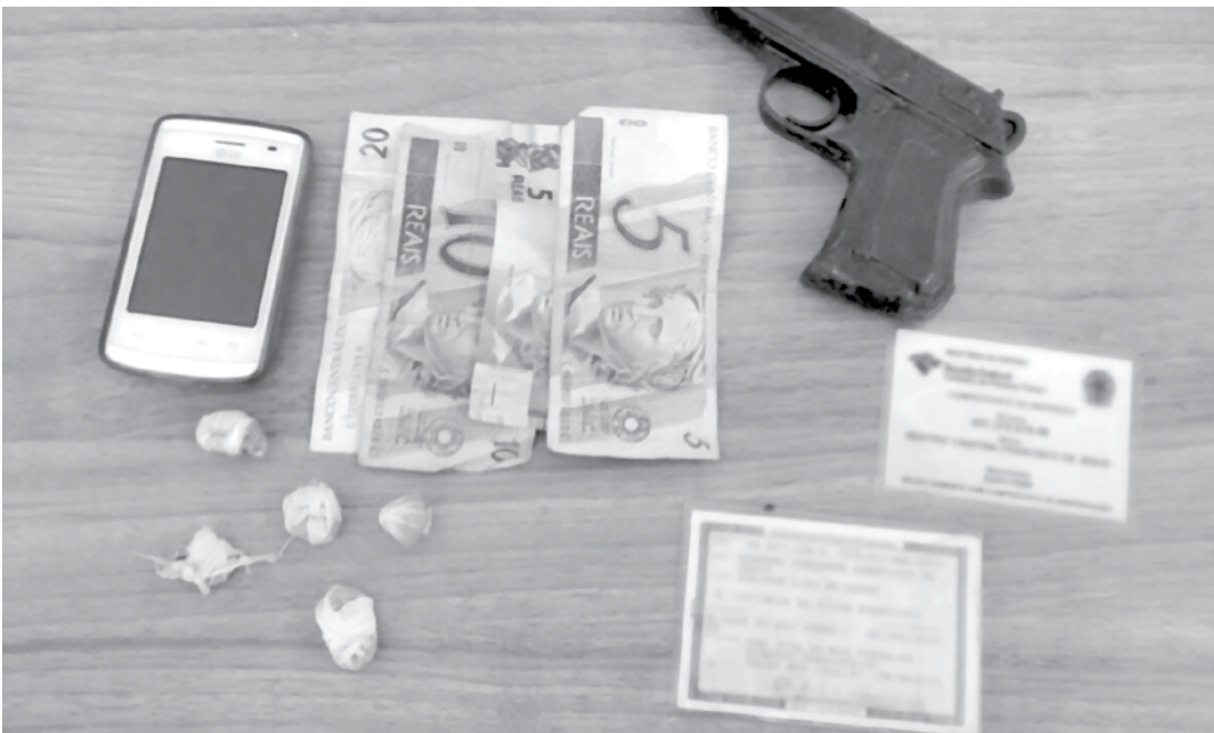
Com o adolescente de 15 anos foram encontradas 5 porções de maconha, dinheiro, celular e uma arma falsa

Com base nas características do local onde a droga foi adquirida, a PM de Fernandópolis entrou em contato com a PM de Ouroeste que deu seguimento à ocorrência. A residência indica-