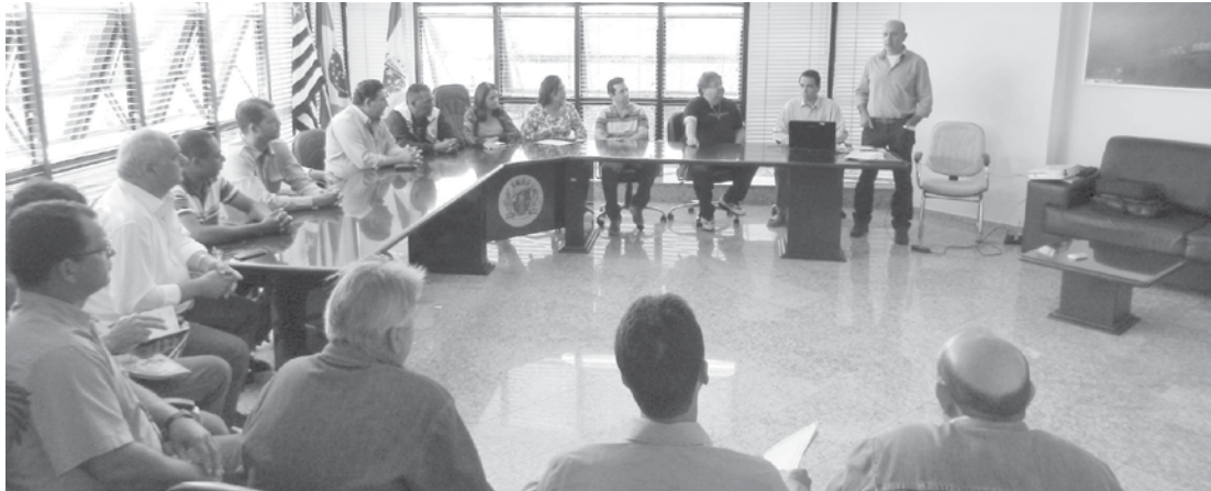
Reunião que aconteceu com representantes da Sabesp e autoridades para apresentação do projeto da nova estação de tratamento de esgotos em Ouroeste

O novo sistema de tratamento será um dos modelos mais modernos usados no interior do Estado de São Paulo. Será composto por lagoa facultativa, seguida de lagoa de maturação com eficiência de 87%, acima do exigido pela legislação que é de 80%. O investimento previsto é de quatro milhões de reais, incluindo construção das lagoas, aquisição da área de 16 hecta-