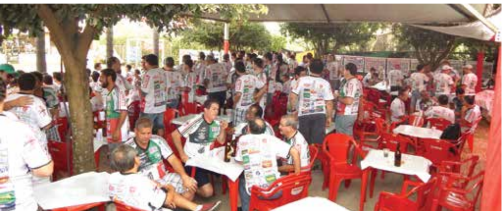
Público novamente compareceu em peso ao evento esportivo