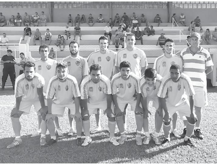
Equipe do Cardoso F.C.