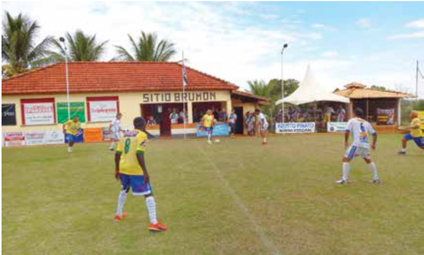
Jogo principal: 13 a 8 para a “Seleção das Estrelas” sobre a “Seleção Regional”