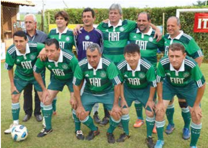
Time do Palmeiras, campeão da categoria Sênior