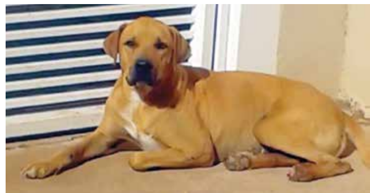
Hoje em dia, o animal está saudável e feliz