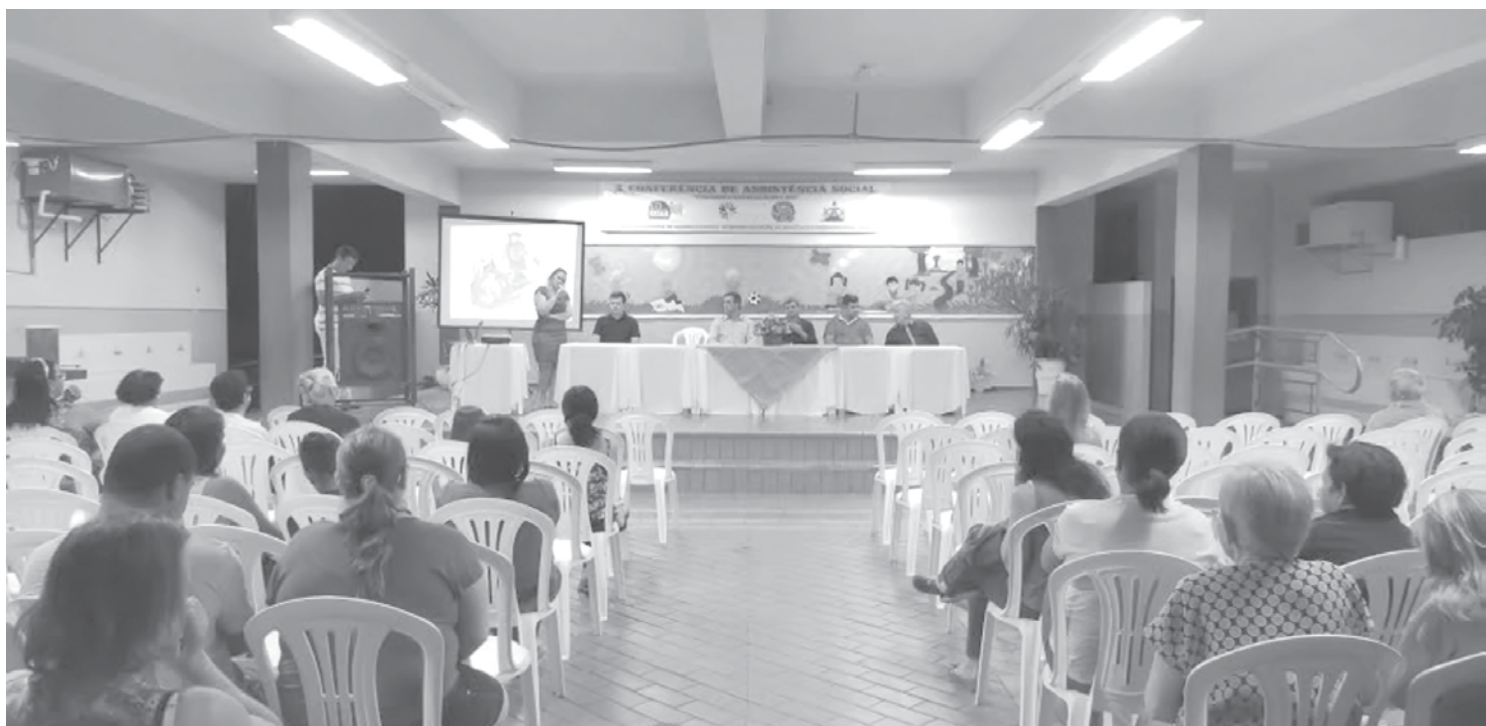
Presidente do CMAS destacou a evolução da assistência social na última década

→ ASSESSORIA DE IMPRENSA Prefeitura de Valentim Gentil