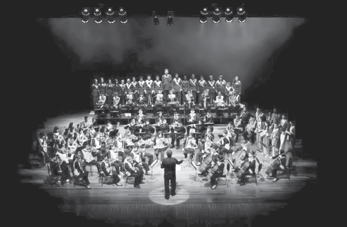
Cerca de 90 alunos dos cursos de instrumentos e canto coral participarão das apresentações

→ Da REDAÇÃO contato@oextra.net Para comemorar o Dia dos Pais, o Projeto Guri – maior projeto sociocultural do país, mantido pela Secretaria da Cultura do Estado de São Paulo – rea-