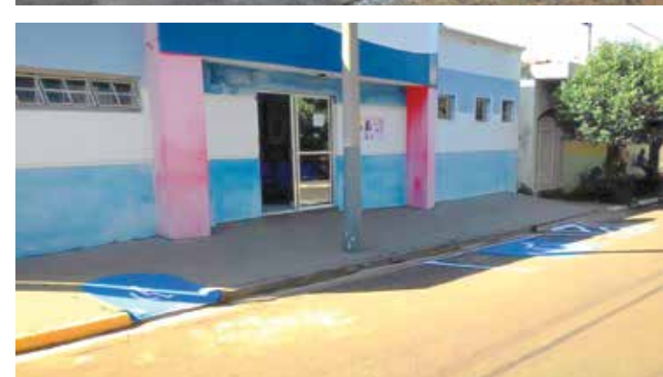
Clima de festa e cuidados especiais em Brasitânia