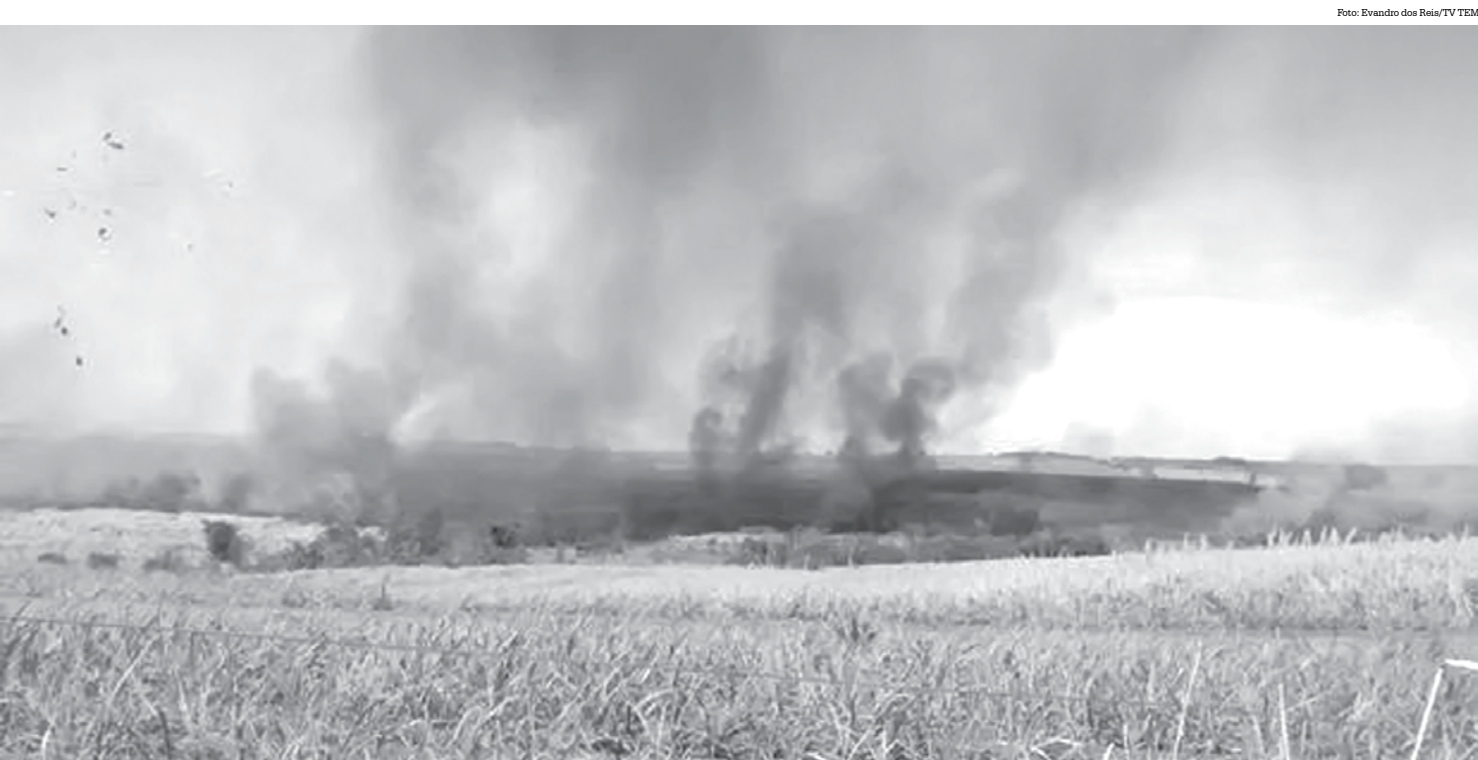
Polícia trabalha com a hipótese de incêndio acidental