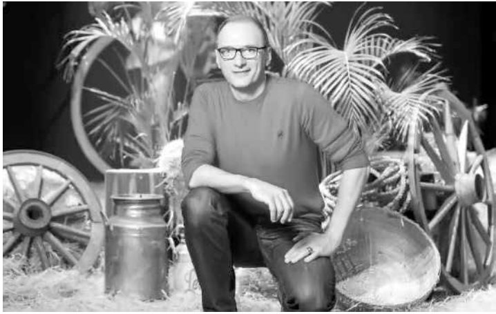
Apresentador será notificado da decisão quando voltar das férias

Mateus, disputadíssimo por autores e diretores depois do sucesso de Félix, tirou férias da TV por determinação da cúpula da Globo para descansar a imagem do marcante vilão de "Amor à vida". Com direção de Vinicius Coimbra, a nova novela terá Andreia Horta como protagonista e Solano terá Mariana Ximenes como colega de vilanias. Além deles, Caio Blat e Sheron Menezes também terão papéis de destaque.