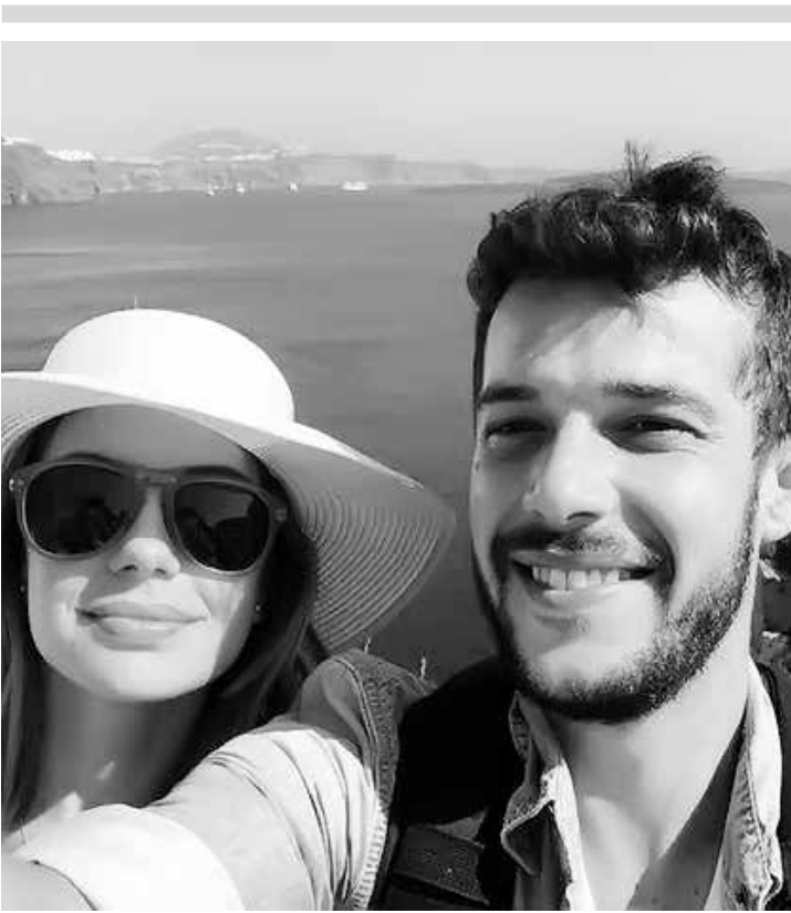
Casal faz viagem romântica pela Europa

Por outro lado a atriz, que é muito discreta, continua ainda fazendo mistério sobre a sua vida amorosa. Em entrevista, por exemplo, Maria Casadevall se recusou mais uma vez a falar sobre o relacionamento que mantém - ou mantinha - com Caio Castro. "Entendo que a curiosidade sobre quem é do meio artístico é algo natural. Mas não falo sobre a minha vida pessoal porque não faz sentido para mim. Se não for para acrescentar algo relevante, melhor ficar calada. Estou bem e isso basta", disse a beleza.