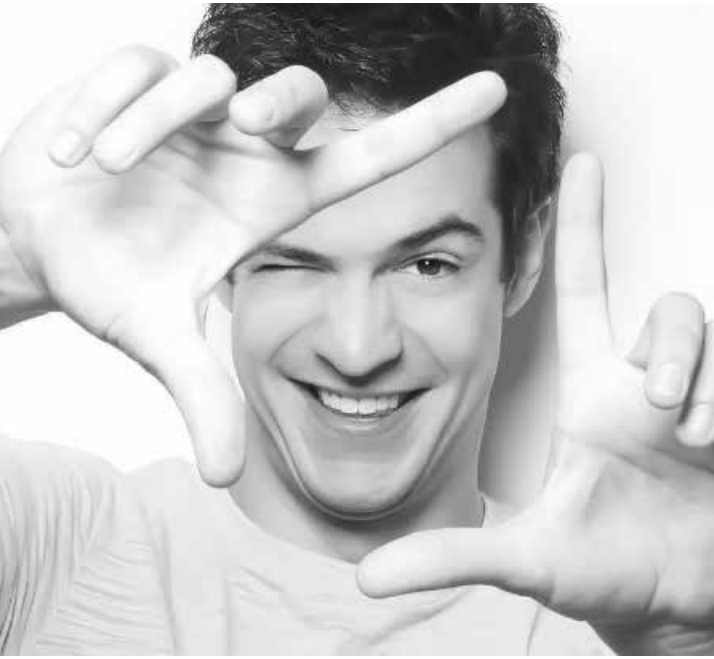
Ator tirou férias após protagonizar o primeiro beijo gay na história da emissora como Félix, de 'Amor à Vida'