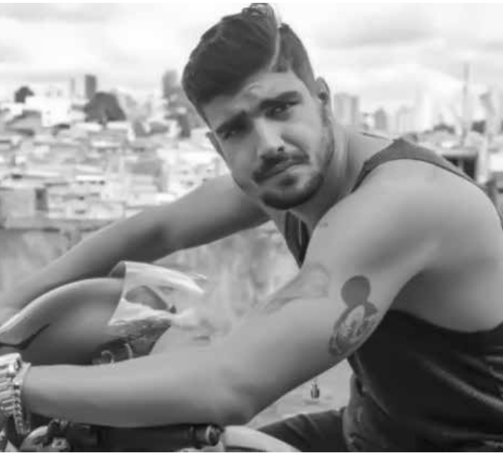
O perfil do ator de 'I Love Paraisópolis' conta com um símbolo azul ao lado que indica a verificação

A partir de agora, quem cruzar com Caio no 'app' poderá ter a certeza de que é ele mesmo e não um perfil falso. Para se certificar de que era mesmo Caio quem estava solicitando essa confirmação, a equipe do aplicativo entrou em contato com o ator para esclarecer o pedido. Caio teria feito seu perfil no Tinder depois do fim do relacionamento - nunca assumido - com a atriz Maria Casadevall, sua colega na novela da Globo.