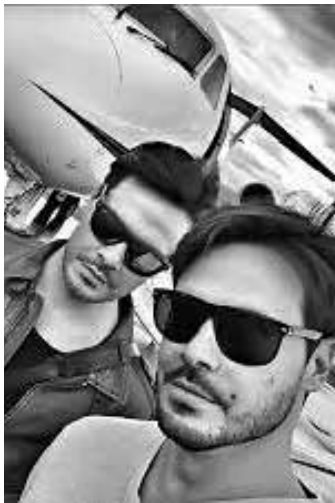
Gêmeos da TV viraram empresários